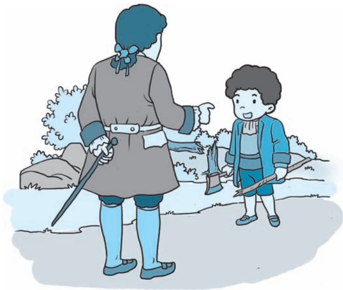
图 2-1 华盛顿勇敢向父亲道歉