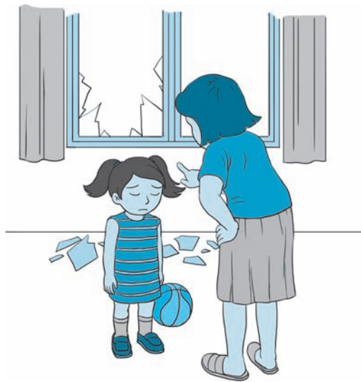
图 1-3 小女孩在听妈妈教诲

尊重父母也十分重要。《弟子规》曰：“父母呼，应勿缓；父母命，行勿懒；父母教，须敬听；父母责，须顺承。”父母呼唤自己，应及时应答，不拖延迟缓；父母交代自己的事情，应该立马去做，不拖延偷懒；父母教诲时，恭敬地认真聆听父母的话；父母批评指责自己时，态度要恭顺，绝不能当面顶撞。