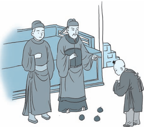
图 1-4 陆绩怀橘

袁术笑着说：“陆绩，你来别人家里做客，怀里怎么还藏着橘子？”陆绩回答道：“橘子很甜，我想拿给母亲尝尝。”袁术听了大为惊讶，后来经常对别人说起陆绩怀橘的事情，并称赞他是个孝顺的好孩子。