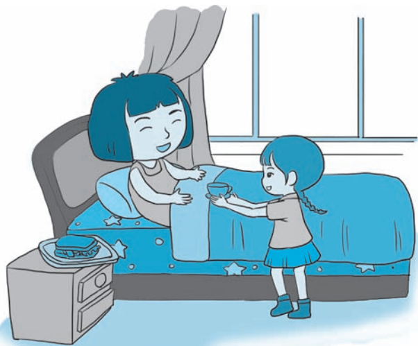
图 1-5 赵婷照顾妈妈