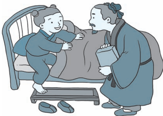
图 1-1 黄香温席