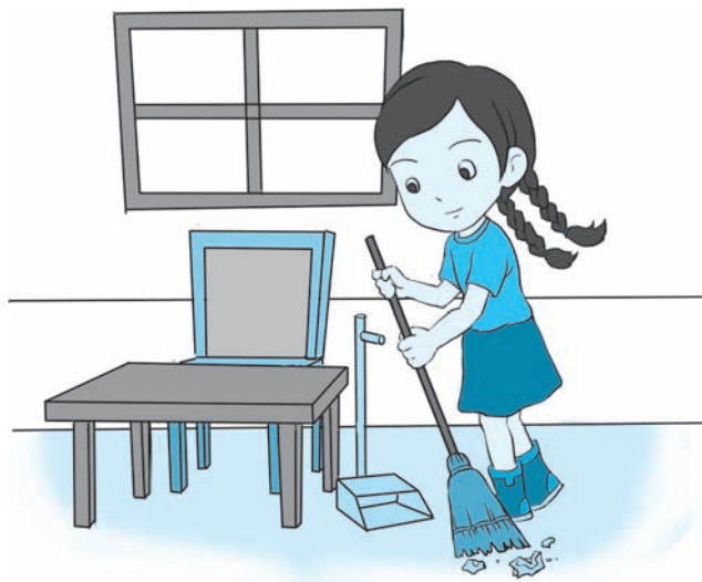
图 1-2 小女孩在家里帮忙扫地

孝顺最重要的是亲近父母、关心父母。在家中可以帮助父母分担一些力所能及的家务，比如洗碗、扫地等。父母身体不适时，应该多问候，尽心尽力地照顾他们。别让父母担忧，别影响父母工作、休息，别惹父母生气，否则就有