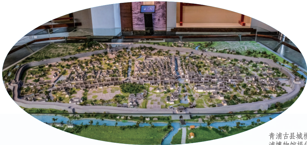
青浦古县城模型图

青浦县名源自古代青龙镇与“五大浦”，县境东北的青龙镇曾为县治所在地。明时青龙镇虽已衰落，但仍为全县政治、经济、文化中心，并在历史上发挥过重要作用。同时，由于县域又位于湖沼平原，湖荡密布，河流纵横，其中吴淞江南岸支流赵屯浦、大盈浦、嵩子浦、顾会浦、盘龙浦最具代表性。因而以青龙镇的“青”字和上述五浦的“浦”字命名县名甚为合适，既体现了青浦地区历史文化底蕴的深厚，也显示了江南水乡的自然特征。