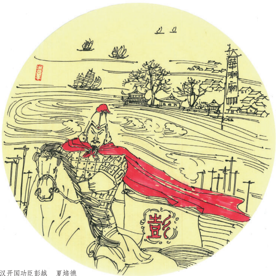
西汉开国功臣彭越 夏培德

这里古时河道多水患，村镇常在水域附近建庙宇以祈求神灵保佑平安，因而不少村镇以庙宇命名。华潮集镇原为小村庄，1962年组建公社后逐步形成小集镇，因集镇建在华潮庙附近而取名“华潮镇”。