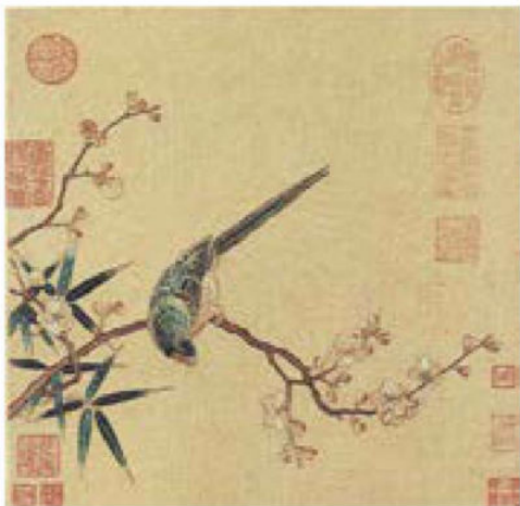
刺绣梅竹鹦鹉图 南宋