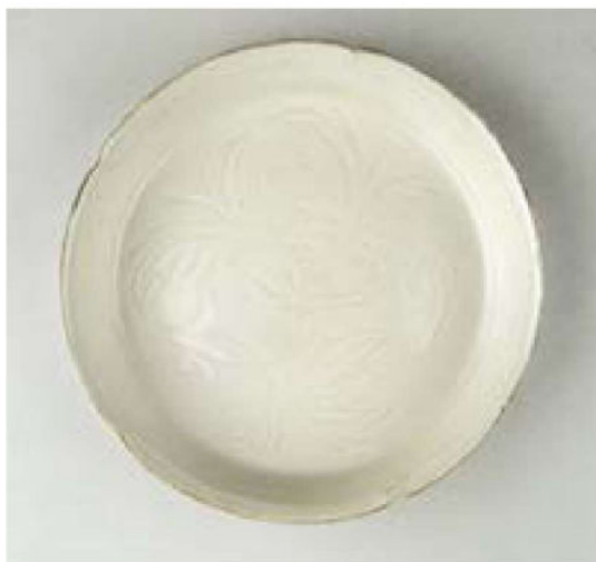
定窑划花梅花洗 宋