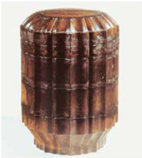
黑漆莲花式四层奩 南宋