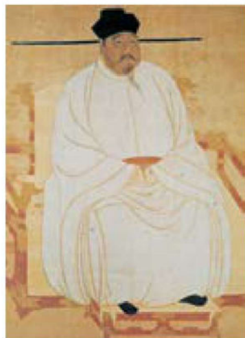
《宋太祖坐像横轴》（局部） 宋