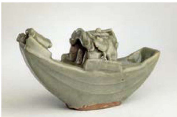
龙泉窑船形砚滴 宋