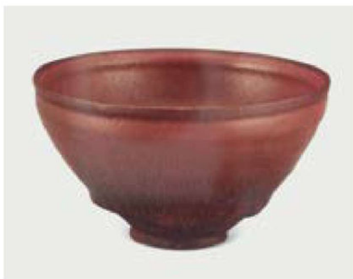
建窑柿红兔毫盏 北宋