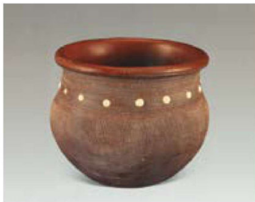
七里镇窑酱釉柳斗罐 宋

荣，物质文明蓬勃发展，物资出口和外销多达 50 多个国家和地区。经济的发展，促进了文化的昌盛。浓厚的兴学之风，使得一些地域和一些家族，对教育十分看重，为日后的人才辈出奠定了坚实的基础。如当时的江西书院发展很快，桂岩书院、白鹿洞书院、白鹭洲书院、鹅湖书院、鹿岡书院等著名书院，使江西成为宋朝时的书院大省，不少名臣、学士，都是从书院走出来的，影响颇为深远。如民族英雄文天祥年青时入白鹭洲书院读书，师从江万里，道德、学问皆有大精进，后由理宗皇帝钦定为状元。“许多人受到书院熏陶功成名就后，也在家乡办起了书院，并亲自为士人授课讲学，大力办学的风气影响了