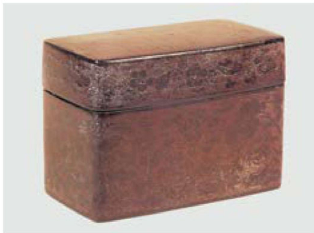
黑漆填朱钺金花卉纹盒 南宋