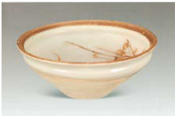
白舍窑白釉剔刻梅梢月纹盏 宋