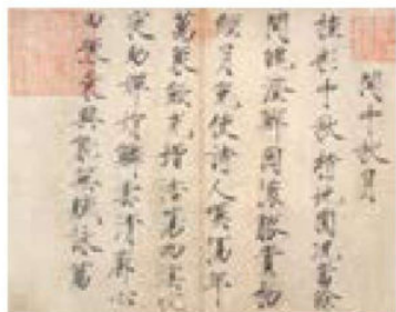
《闰中秋月帖》 宋·赵佶