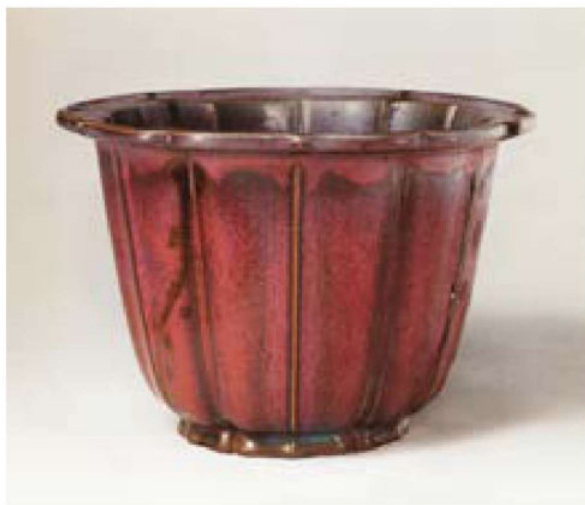
钧窑玫瑰紫釉葵花花盆 宋

拥立为帝。建立流亡小朝廷进行抗元，在福建、两广地区坚持数年。景炎三年（1278）春，赵昰受飓风惊吓，惊恐成疾，死于雷州附近的碙洲，年仅11岁。在今广东省新会市南之崖山，宋军与元军作最后一战，流亡近三年的南宋小朝廷灭亡。8岁末帝赵昺万不得已被护将陆秀夫负帝一起跳海自尽，虽然如此，他们所表现出来的民族气节，不能不让人叹服。