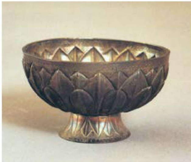
鎏金覆瓣莲花式银盏 南宋

占全省历代进士人数比例的一半。这些都足以说明宋时江西的教育之兴和文化之盛。厚重的文化积淀和代代传承，一直影响至今。”