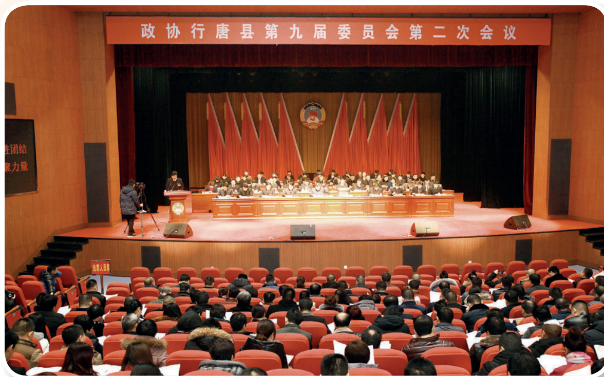
政协行唐县第九届委员会第二次会议