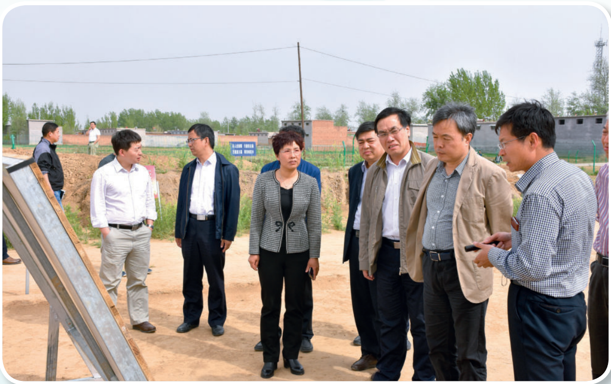
2017年4月17日，国家文物局副局长宋新潮（右二）一行到故郡考古现场进行调研。