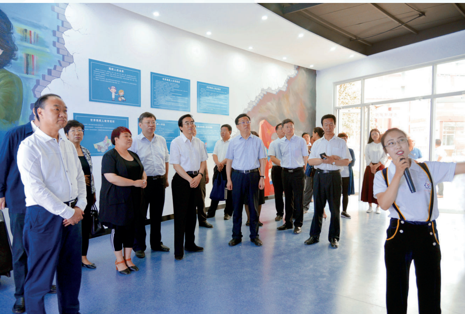
2017年9月3日，中国残疾人联合会副理事长程凯（前排左三）一行来县视察指导残疾人事业发展及脱贫攻坚工作开展情况。