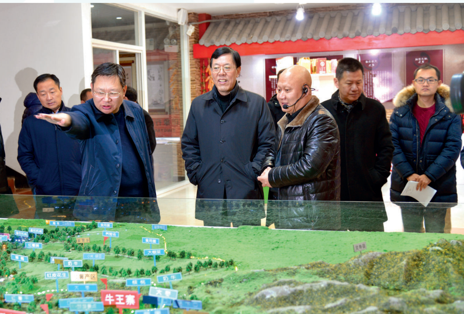
2017年12月12日，中联部副部长李军（左三）一行来县调研，到青岛保税港区行唐功能区、君乐宝太行乳业、农村电子商务中心、东井底村等地，详细了解县脱贫攻坚工作及项目建设情况。