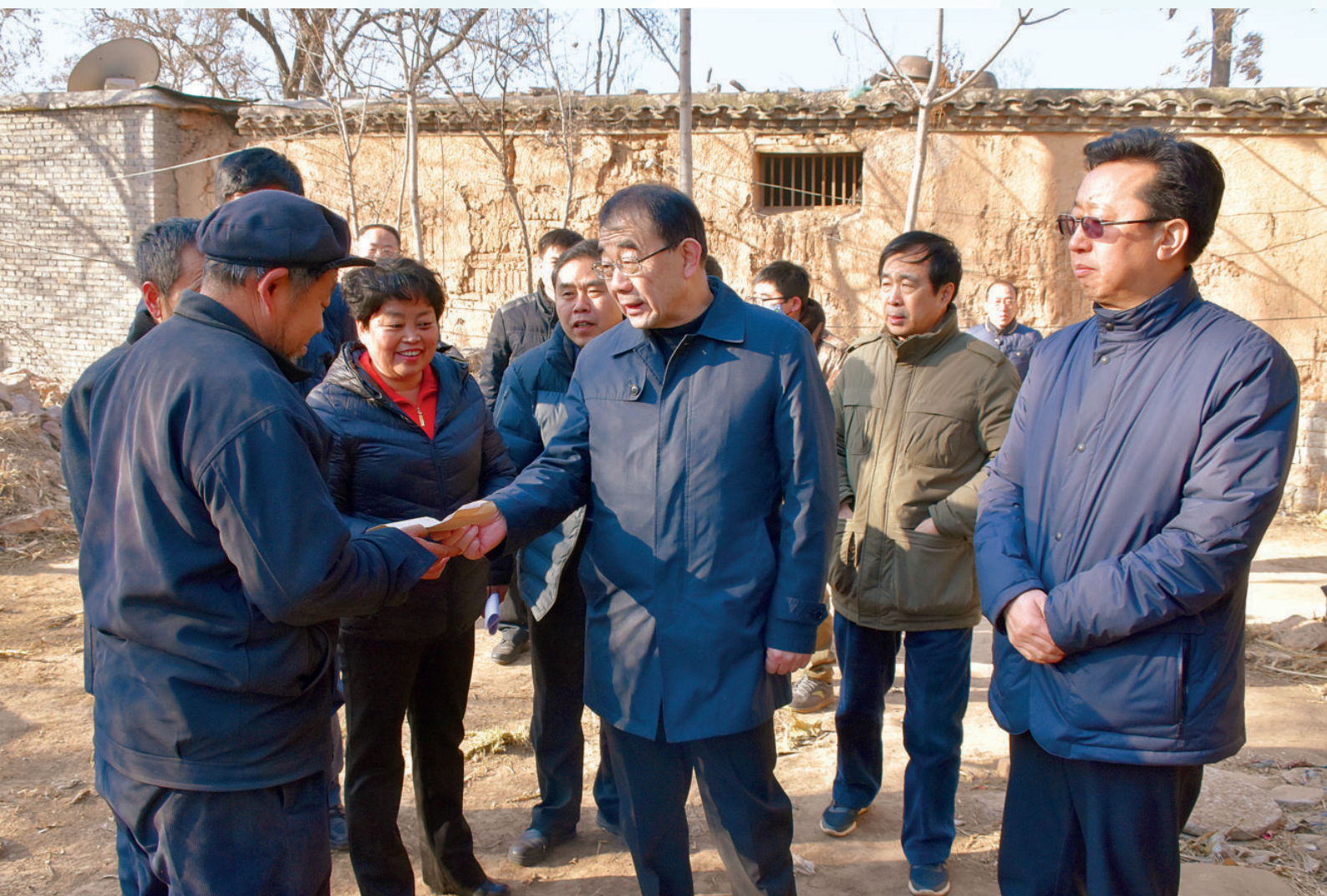
2017年11月14日，省政协副主席许宁（中）到北河乡宣讲十九大精神，并慰问贫困户。