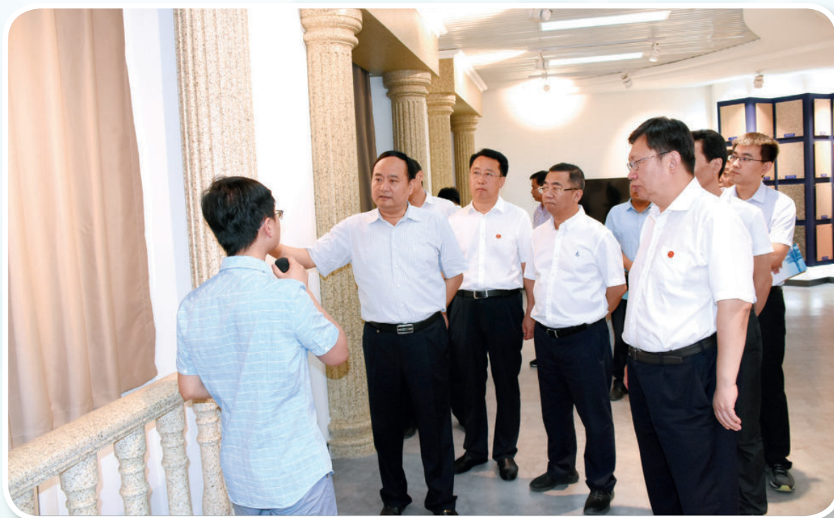
2017年6月25日，市委副书记、市长邓沛然（左二）来县调研经济社会发展情况和扶贫工作，并到九口子乡进行市长讲党课活动。