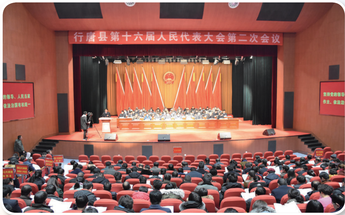
行唐县第十六届人民代表大会第二次会议（张峰 摄）