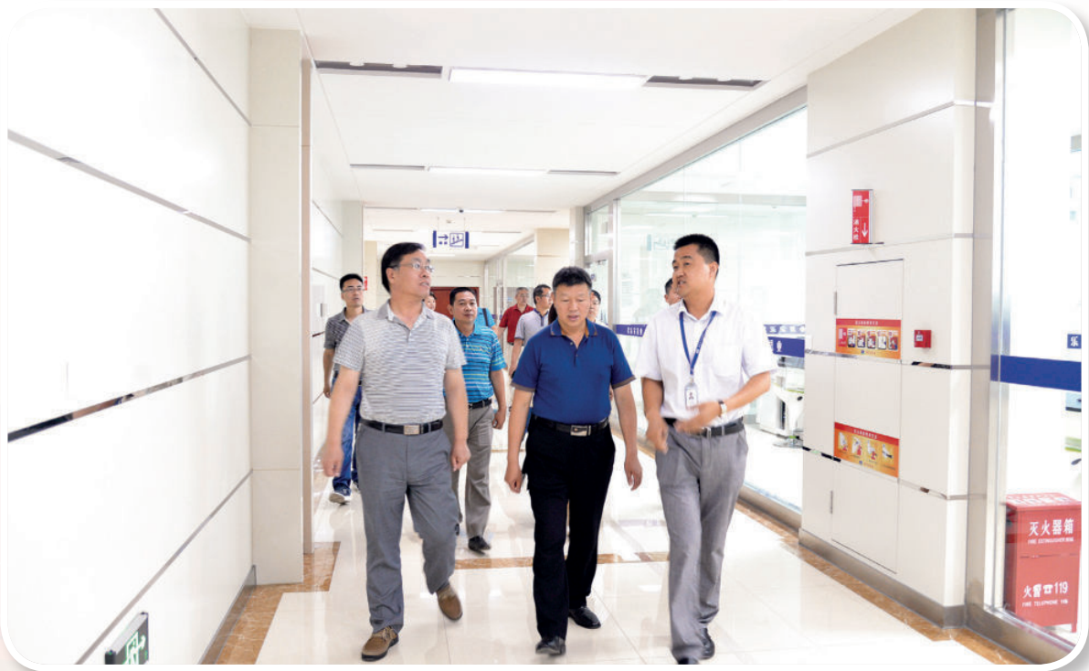
2017年6月9日，中联部休干局一行10人来县进行国情考察。