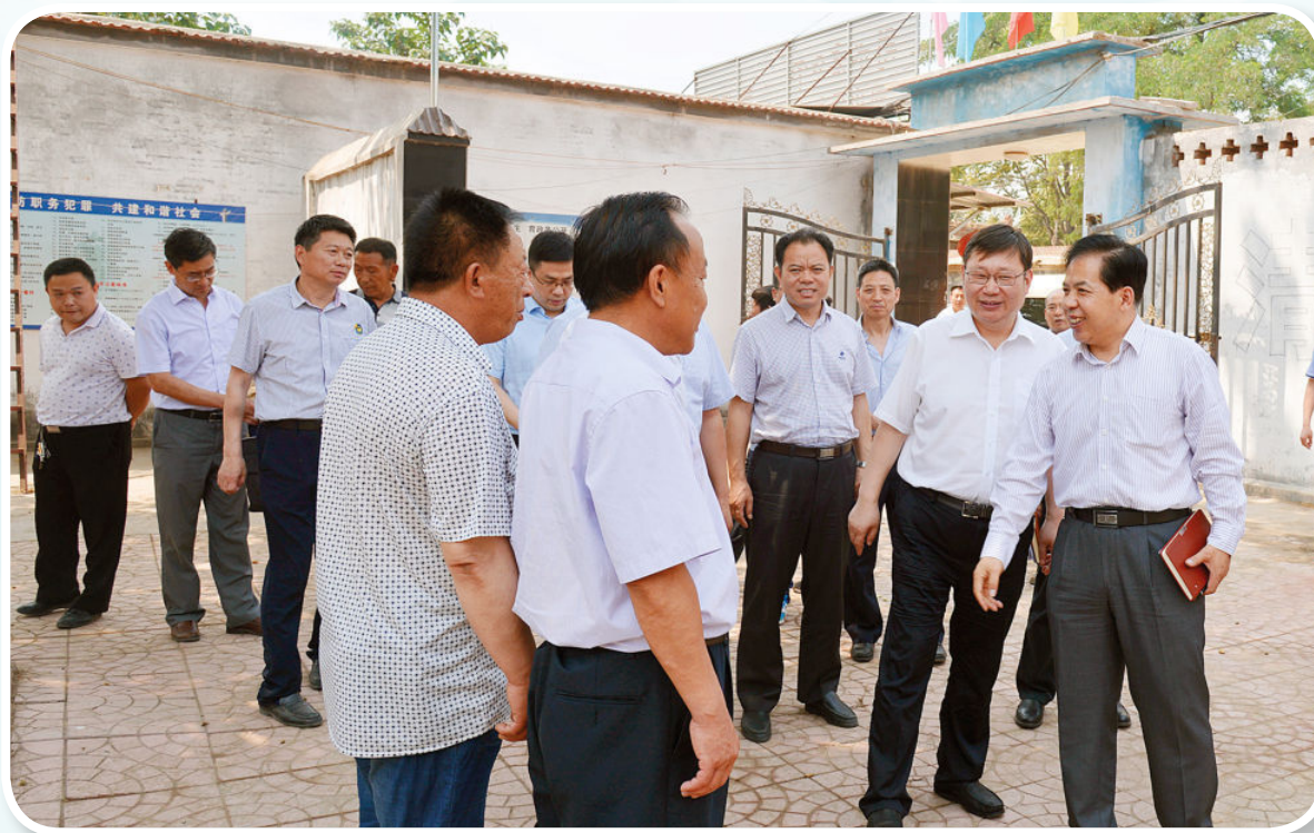
2017年5月18日，省纪委监委、市委常委、市纪委书记张明利（右一）一行到行唐县调研驻村扶贫和县级纪检监察机构改革工作。