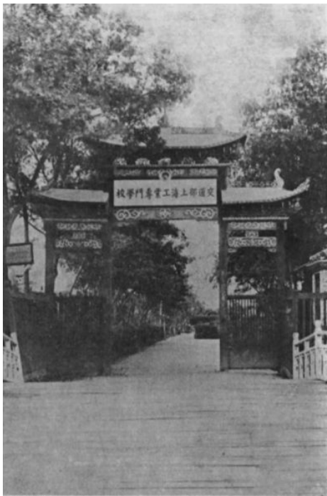
交通部上海工业专门学校

大致谓中国铁路、电机事业日益发展,本校土木、电机两科创办近二十载,成绩丕著。惟管理人