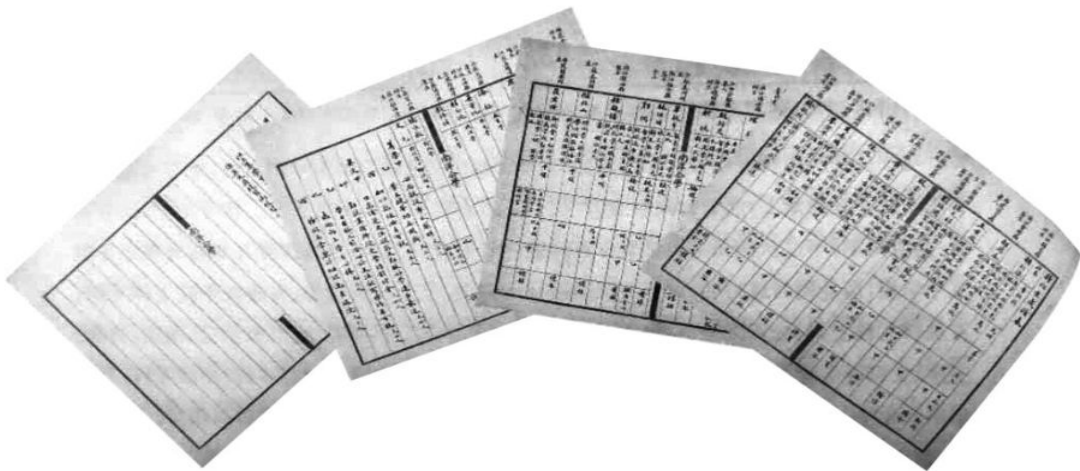
1902年,南洋公学向盛宣怀呈报特班学年大考成绩表

特班的课程分为中文(包括译本)、西文两大类,“以西学功课为重”,并处于不断修订的状态,根据1902年10月3日公学总办汪凤藻呈送给盛宣怀的特班学年大考成绩表显示,经济特科班开设的课程有:文词、算学、英文、日文、专研科(分哲学、外交学、法律学、政治学、理财学、行政学、文学、教育9个门类)等。