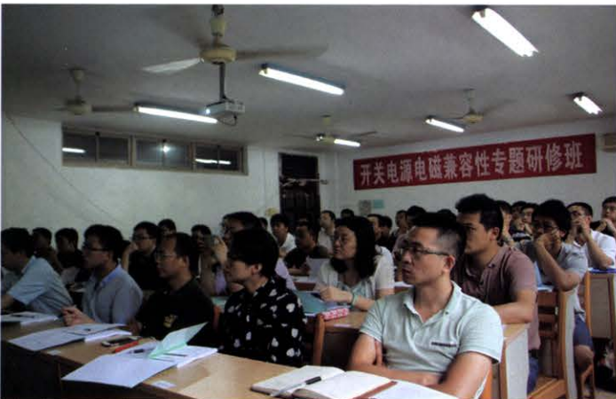
开关电源电磁兼容性专题研修班(8月 杭州)