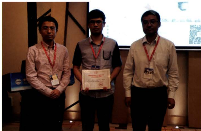
本次年会新设分会场优秀报告人评选