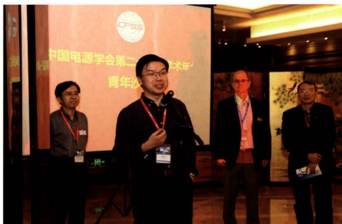
年会青年沙龙现场