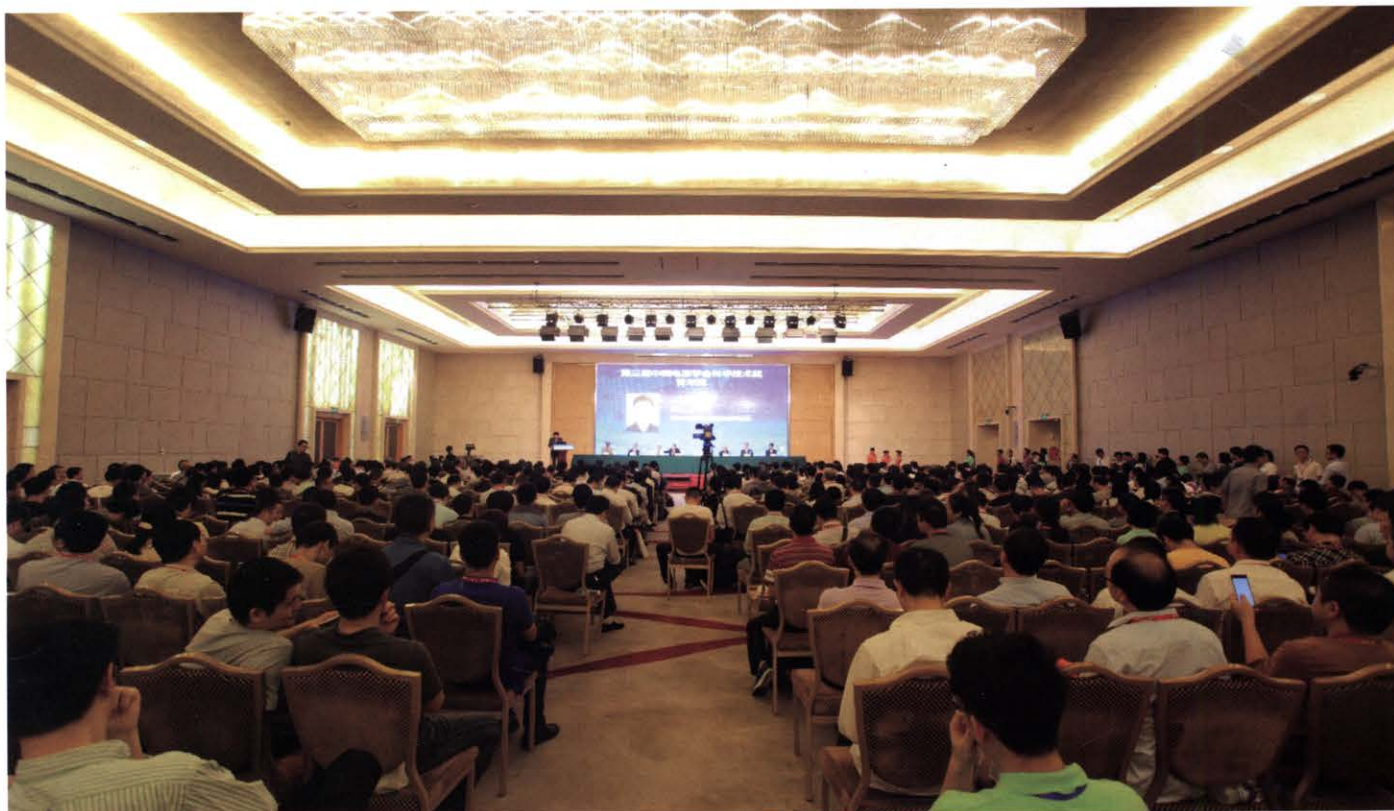
中国电源学会第二十一届学术年会于11月6至9日在深圳召开