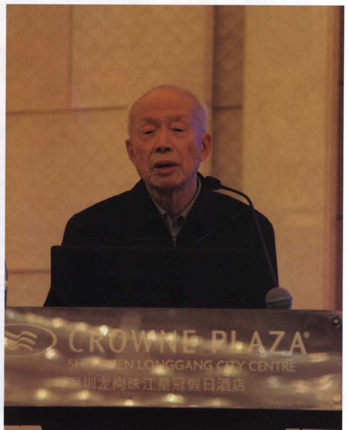
臧克茂院士作大会报告