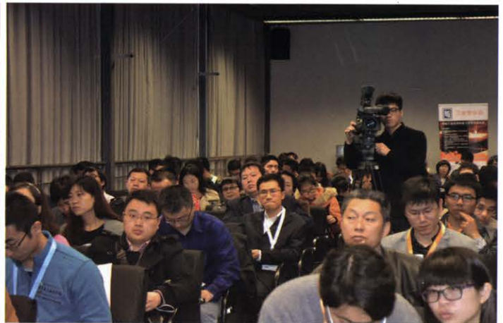
2015国际电力电子创新论坛(3月 上海)