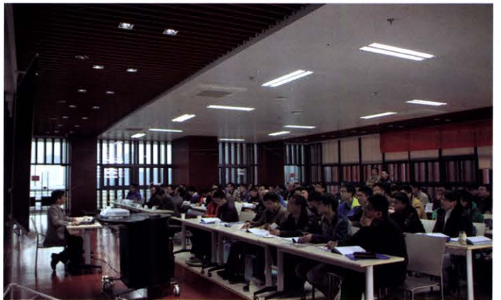
高效率与功率密度电源变换技术与设计高级研讨班 (12月 南京)