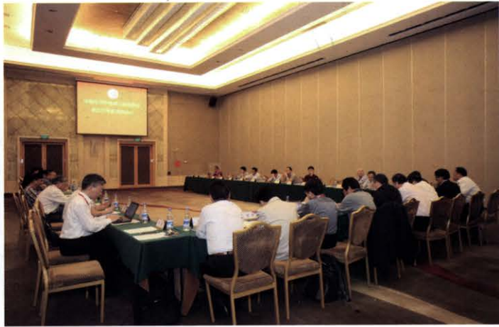
中国电源学会七届五次常务理事会议胜利召开