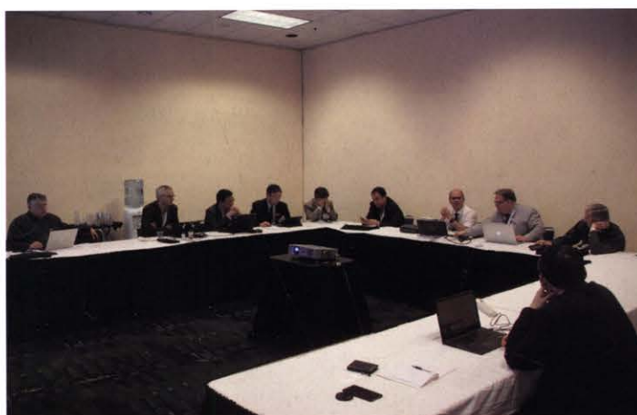
出访期间中国电源学会与IEEE 电力电子学会(PELS)进行会谈