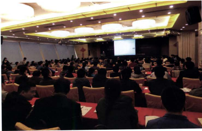
开关电源中的功率变换器拓扑、分析与设计培训会 (3月 北京)