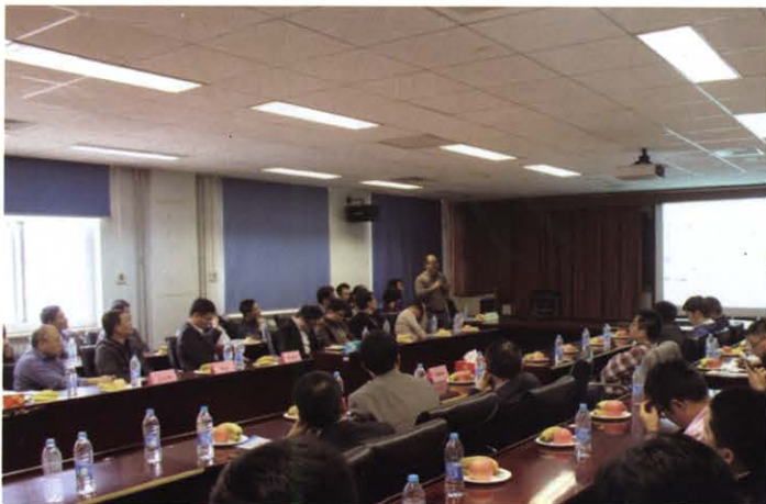
青椒沙龙 (4月 北京)