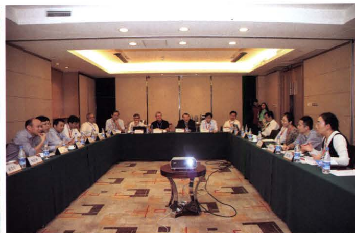
11月中国电源学会与PSMA召开中美企业交流会