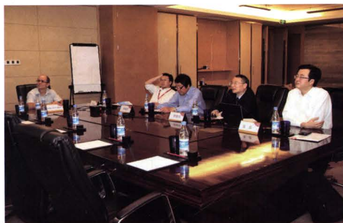
11月中国电源学会与IEEE PELS在深圳召开工作会议