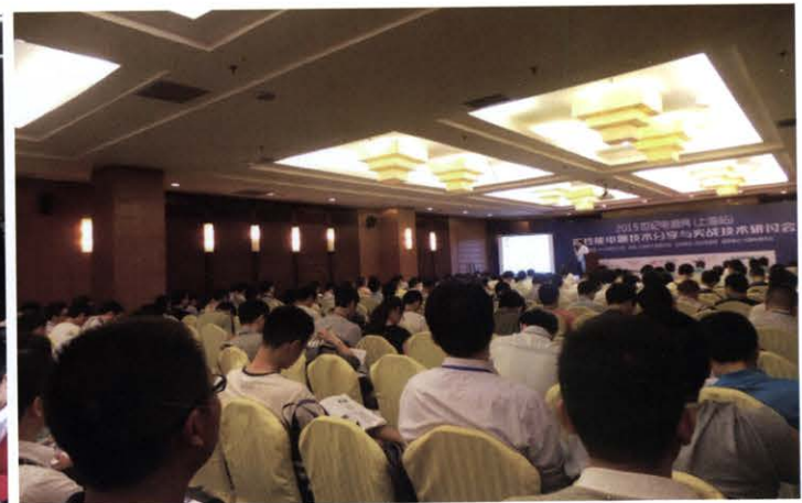
高性能电源技术分享与实战技术研讨会(6月 上海)