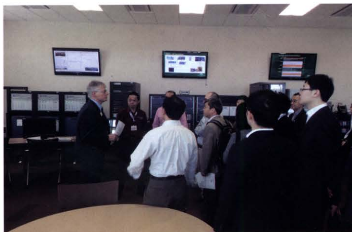
出访期间参观当地科研机构