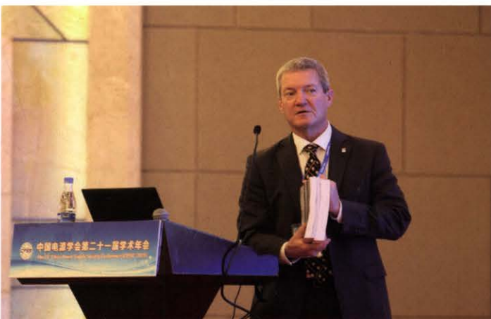
美国电源制造商协会(PSMA)主席Ernie Parker先生作大会报告