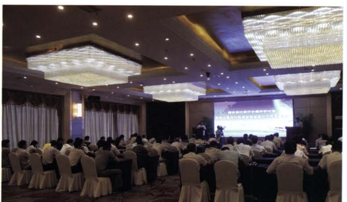
固态高功率开关器件研讨会(7月 株洲)