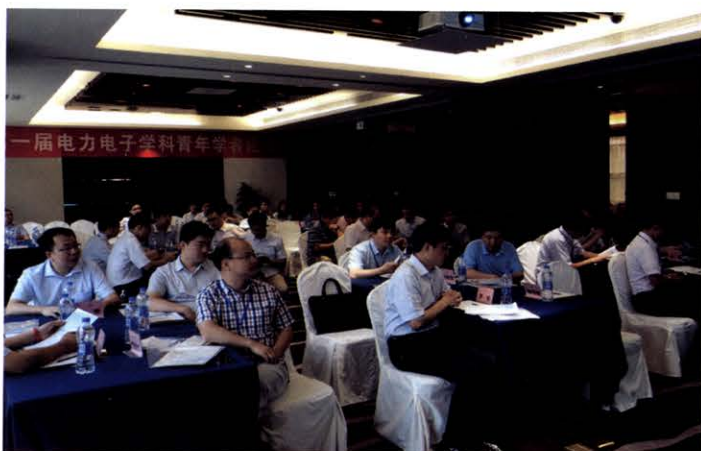
第一届电力电子学科青年学者论坛(7月 长沙)