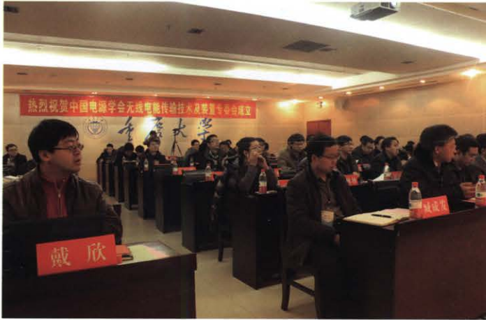
无线电能传输技术及装置专业委员会成立大会 (1月 重庆)