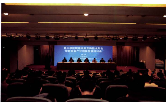
新能源电能变换技术专委会第二届年会(12月 合肥)