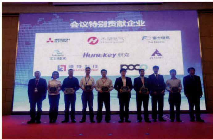
年会为8家特别贡献企业颁奖