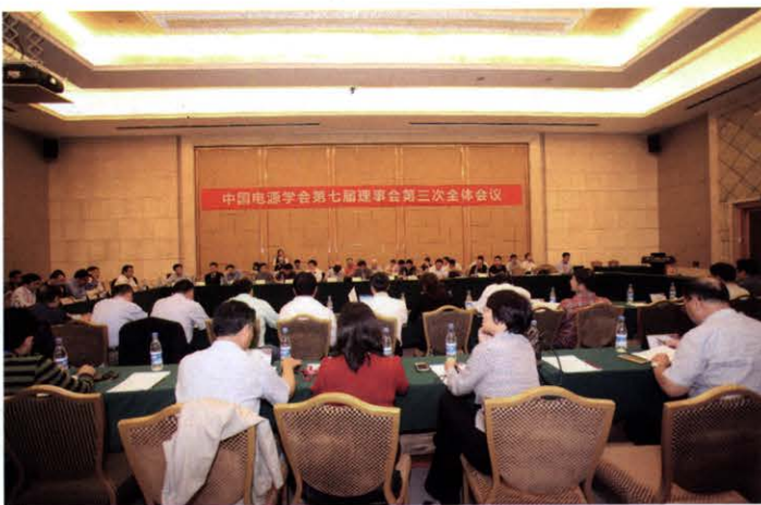
中国电源学会七届三次全体理事会议胜利召开