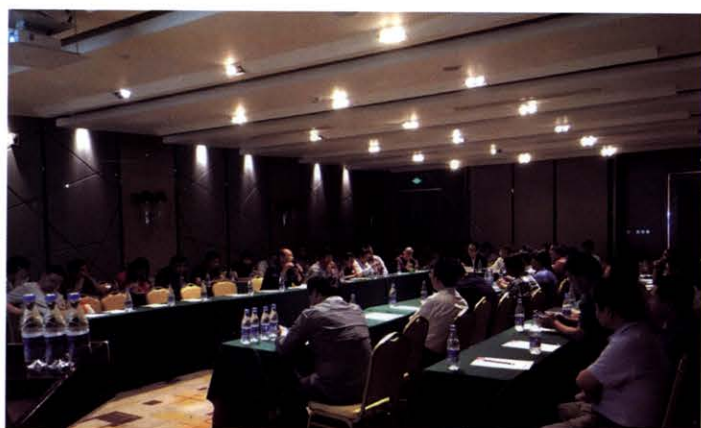
磁元件新技术应用座谈交流会(11月 深圳)