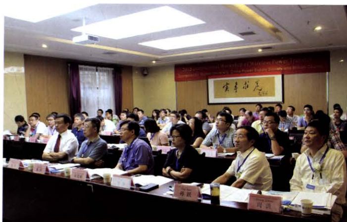
2015无线电能传输国际研讨会(8月 武汉)