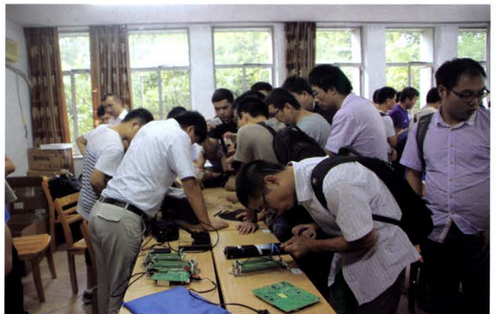
开关电源电磁兼容性专题研修班实验演示