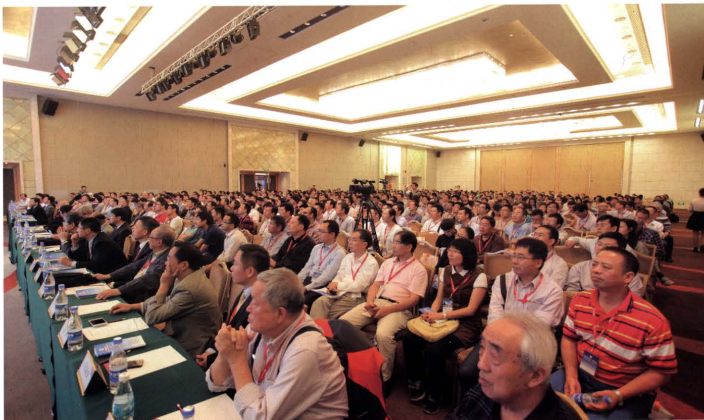
会议参会人数超过1200人，图为会议主会场