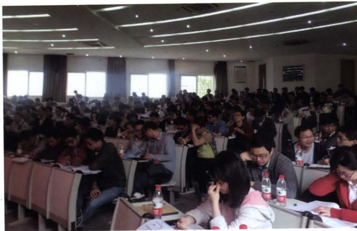
电磁技术与 EMI 特性分析培训会(4月 武汉)