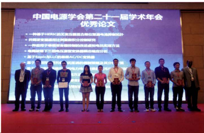
年会评选出20篇优秀论文