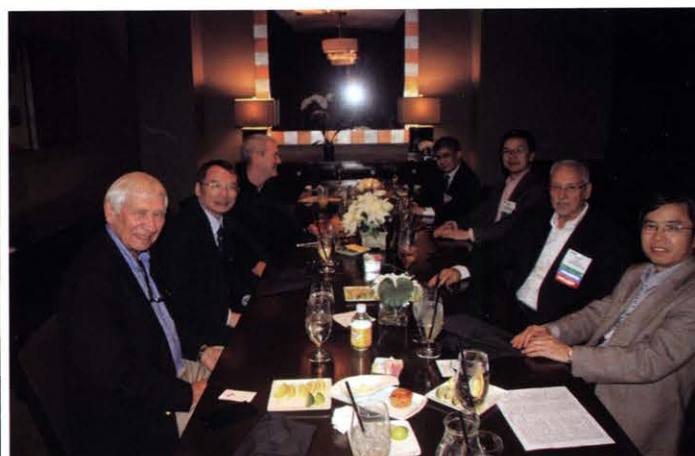
出访期间中国电源学会与美国电源制造商协会(PSMA)进行会谈