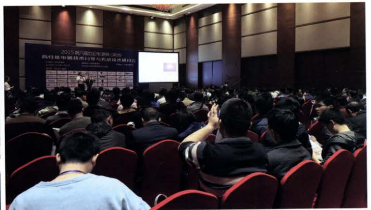
高性能电源技术分享与实战技术研讨会(12月 深圳)