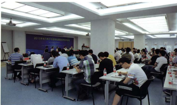
2015年电力电子与变频电源新技术学术论坛(7月 苏州)