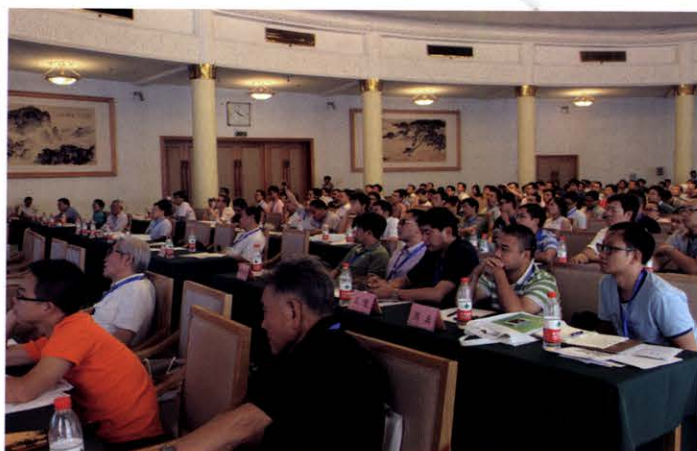
第四届全国电能质量学术会议暨电能质量行业发展论坛(8月 济南)