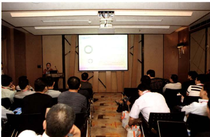
年会共计安排40个主题分会场