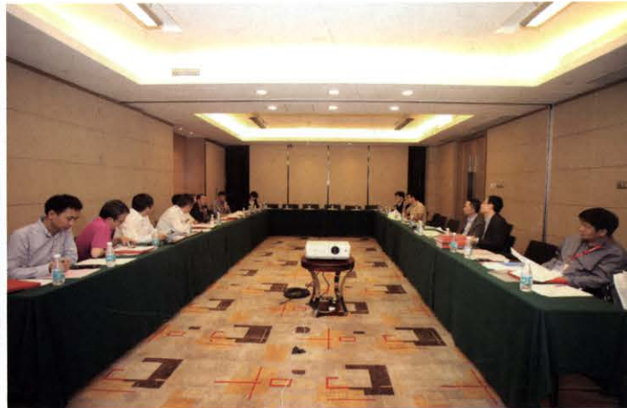
中国电源学会-Springer电力电子技术英文丛书编委会议