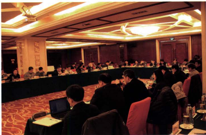
中国电源学会七届四次常务理事会议胜利召开