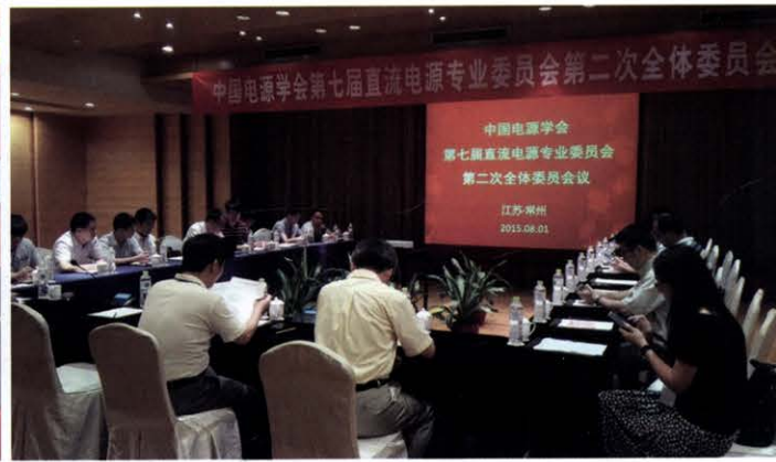
直流电源专委会七届二次全体委员会议