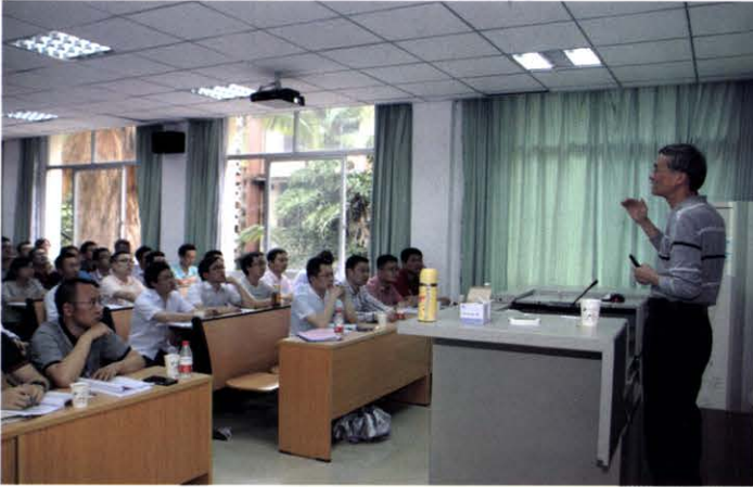
功率变换器磁技术分析、测试与应用高级研修班 (5月 福州)