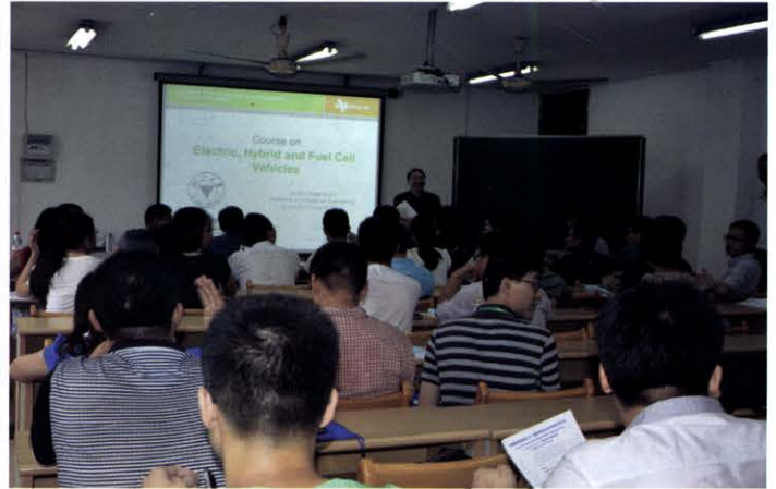
电动和混合动力汽车专题研修班(6月 杭州)