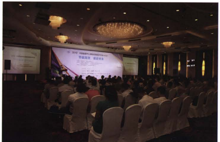
2015中国数据中心基础设施技术年会(5月 北京)