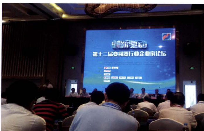
第十二届变频器行业企业家论坛(8月 苏州)