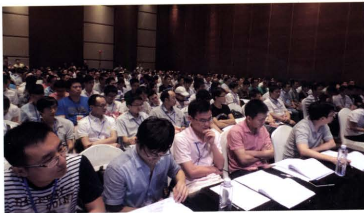
开关电源设计验证技术培训会(深圳 8月)