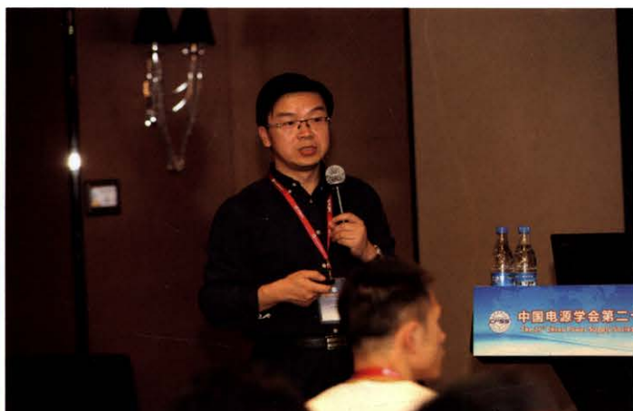
西安交通大学刘进军教授作技术讲座