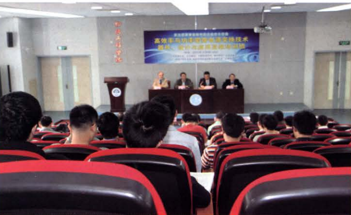
高效率与功率密度电源变换技术：器件、设计与应用 高级研修班(10月 上海)