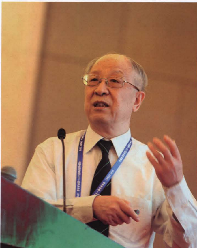
韩英铎院士作大会报告