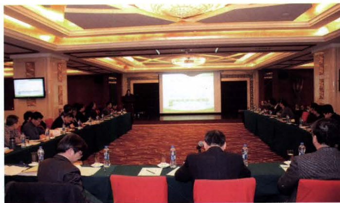
《电源学报》编委会议