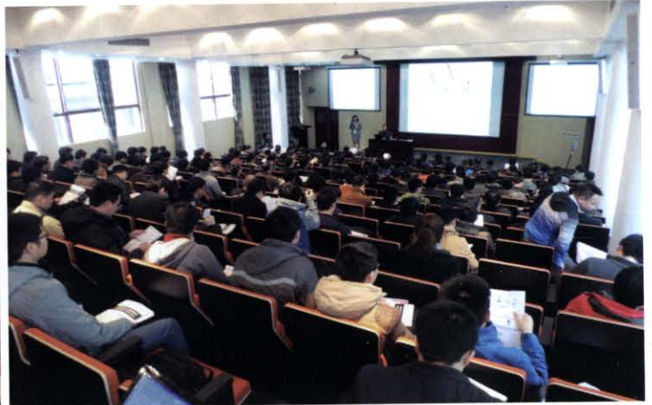
变压器磁技术高级培训会(3月 上海)