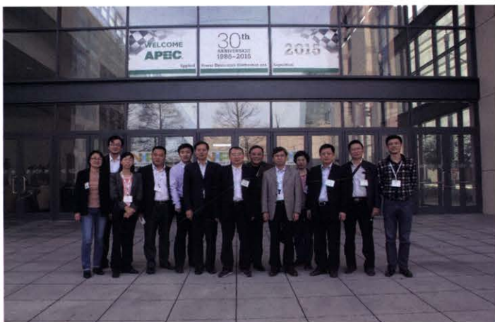
中国电源学会代表团出访美国参加APEC2015国际会议