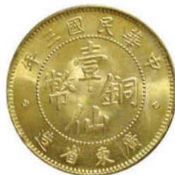
KT. 21 民国三年壹仙，黄铜