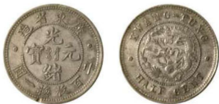
KT. 01 二百枚换一圆，又称广东半仙