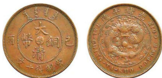
KT. 19 己酉粤错配光绪龙 (J-7)