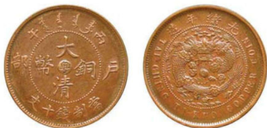
KT. 14 丙午粤直头清 / 部颁龙