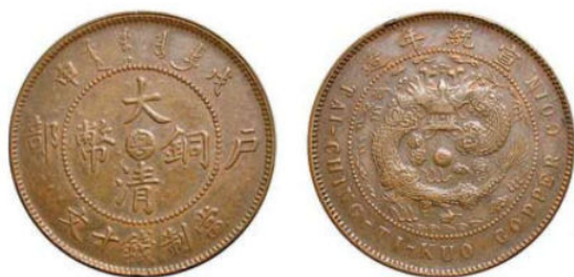
KT. 17 戊申粤错配宣统龙 (H-8)