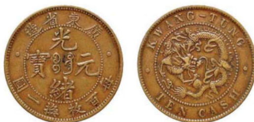
KT. 03 百枚换一圆错配 TEN CASH (A-3)