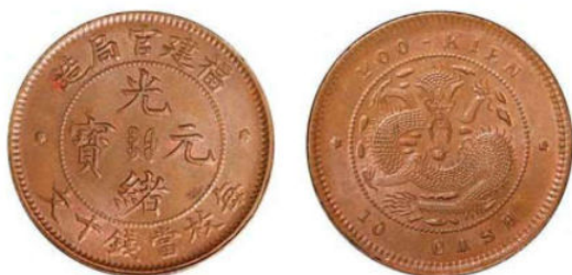
FK.05 福建官局十文 / 龙尾无云