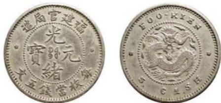
FK.03 福建官局五文, 白铜