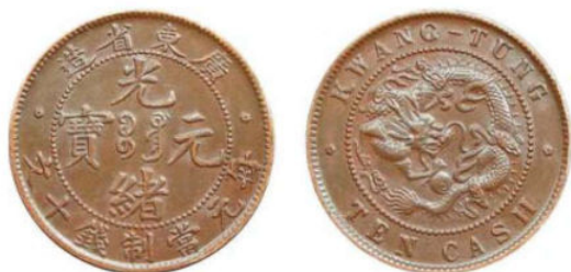
KT. 05 广东高宝 / 七刺左 N (B-3)