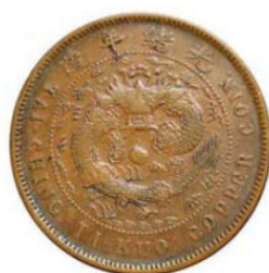
KT. 12 丙午粤弯头清 / 光绪细云龙 (F-5)