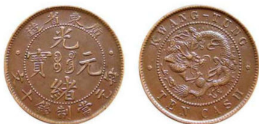
KT. 04 广东高宝 / 八刺右 N (B-2)