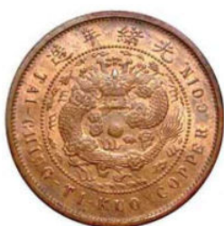
KT. 11 丙午粤弯头清 / 部颁龙 (F-6)