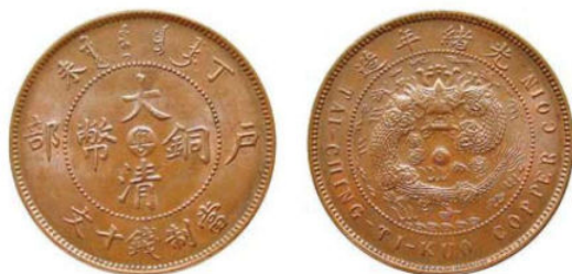
KT. 15 丁未粤 / 光绪细云龙类