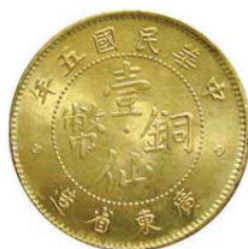
KT. 25 民国五年壹仙 (N-9)，黄铜