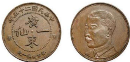
KT. 30 广东孙像一仙