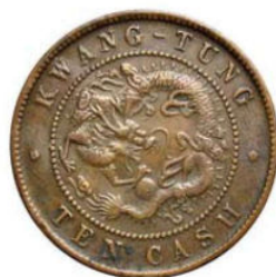
KT. 08 广东低宝 / 八刺右 N (C-2)