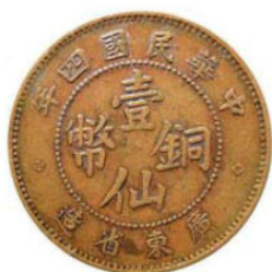
KT. 24 民国四年壹仙 (M-9)