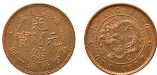
KT. 02 百枚换一圆 / ONE CENT (A-1)