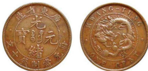
KT. 06 广东高宝错配 ONE CENT (B-1)