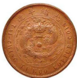
KT. 13 丙午粤直头清 / 光绪细云龙类