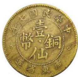
KT. 26 民国七年壹仙 (O-9)，黄铜