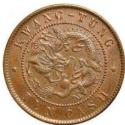
KT. 07 广东低宝类 / 七刺左 N 类