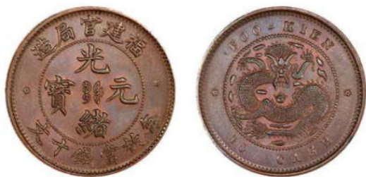
FK.04 福建官局十文 / 龙胸一云

福建官局造五文白铜属试样性质, 目前已知存世三枚, 两枚由私人收藏, 其中一枚(左图)为《中国铜元图典》图 29 原物, 于 2006 年北京嘉德春拍马定祥专场拍出; 另一枚由上海博物馆收藏。