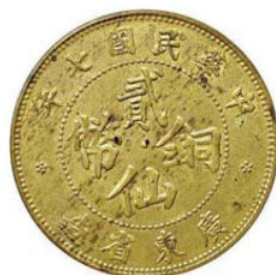
KT. 27 民国七年贰仙，黄铜