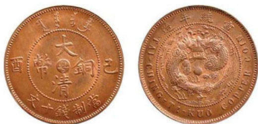
KT. 18 己酉粤 / 宣统细云龙 (J-8)

宣统龙错配戊申粤，目前已知存世三四枚，图示马定祥先生旧藏，《中国铜元图典》图 14 原物，一枚由上海博物馆收藏，一枚于 2016 年北京诚轩春拍拍出。己酉粤错配光绪龙，目前已知存世略多于宣统龙错配戊申粤。中心粤大清铜币戊申与己酉年份的产量相对较少，存世的“干支混配”比光绪元宝的“仙文混配”更为稀少，品相好的更是难得，为广东铜元珍品之一。