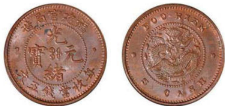
FK.01 福建官局五文 / 短尾