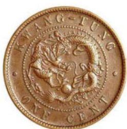
KT. 09 广东低宝错配 ONE CENT (C-1)