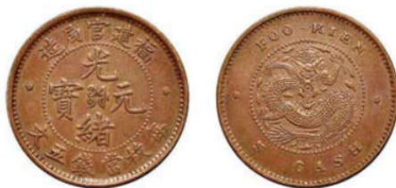
FK.02 福建官局五文 / 长尾