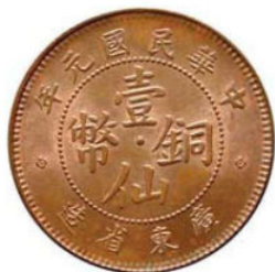
KT. 20 民国元年壹仙 (K-9)