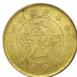
KT. 23 民国四年壹仙，黄铜