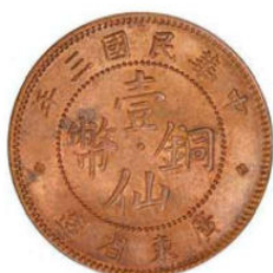
KT. 22 民国三年壹仙 (L-9)