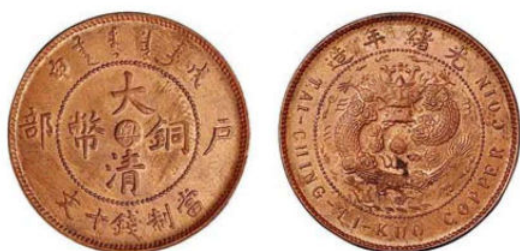
KT. 16 戊申粤 / 光绪细云龙 (H-7)