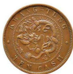
KT. 10 广东小字肥绪 (E-4)