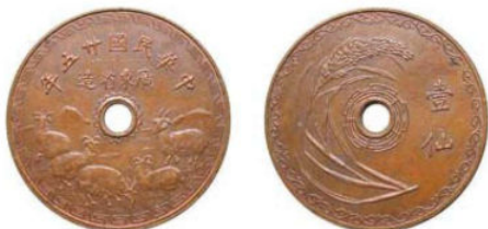
KT. 29 广东五羊壹仙，中孔台阶

民国廿五年广东省造五羊壹仙（广东五羊币）设计独特、制造精美，图案布局与主题构思之巧妙，堪称民国铜元之最。因不合当时政府推行的币制政策，发行后不久即收回，传世数量稀少，是深受藏家喜爱和追逐的珍品，历年来行情一路走高，民国铜元的领头羊。