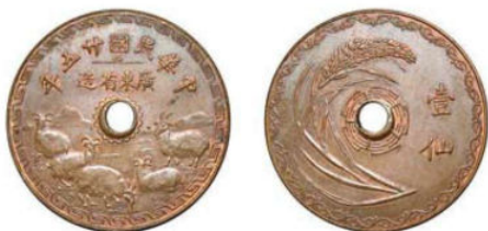
KT. 28 广东五羊壹仙