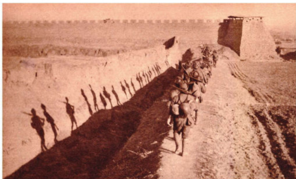
1937年10月底，日军进占赞皇县城。