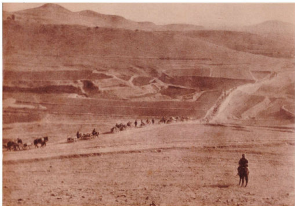
日军向赞皇进攻途中