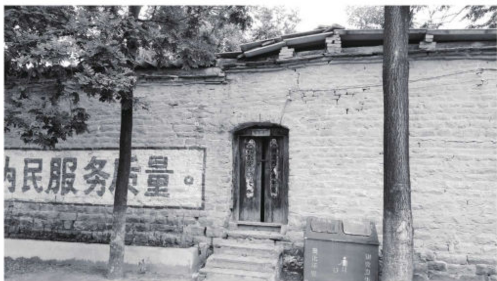
中共赞皇县委旧址