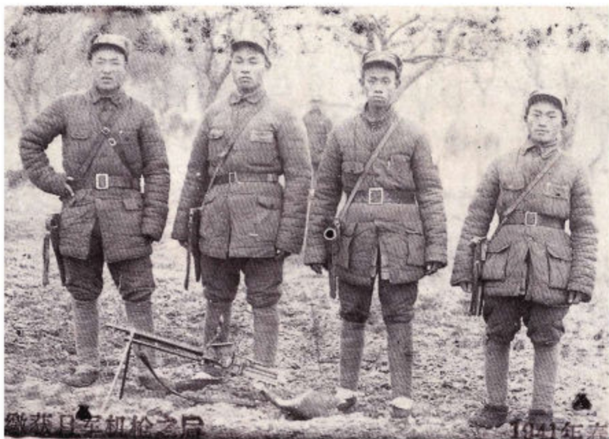
骑兵团部分战士1941年合影。左一为著名战斗英雄韩永正（革命烈士）。