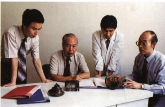
主持石油机械零部件失效分析