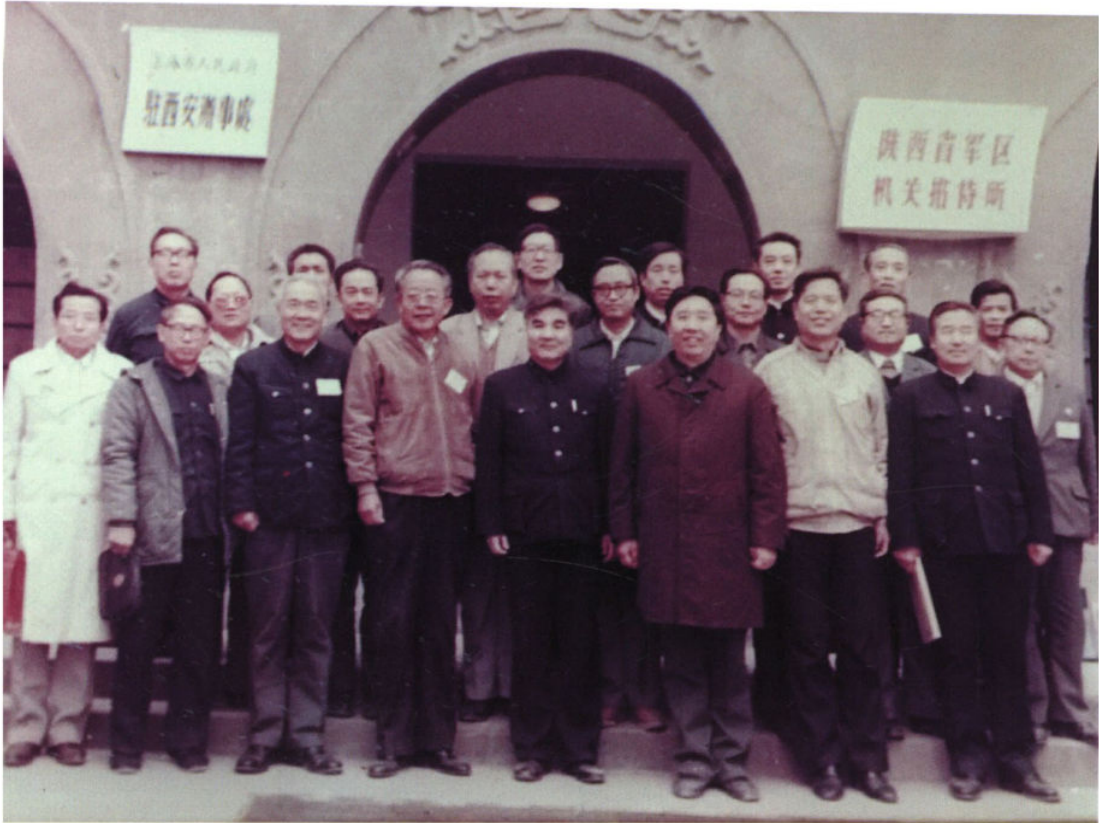
20 世纪 80 年代，陕西省石油学会理事会的一次合影。 陕西省副省长曾慎达（前排左五）为理事长