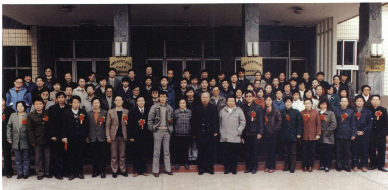
中国石油天然气总公司石油管材研究中心搬迁西安前夕在宝鸡原址的合影 (1993年)