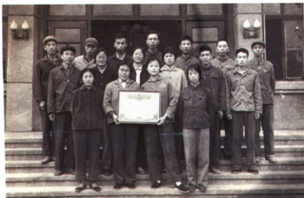
宝鸡石油机械厂金属材料试验研究组 (检验科一班) 集体合影 (1979年)