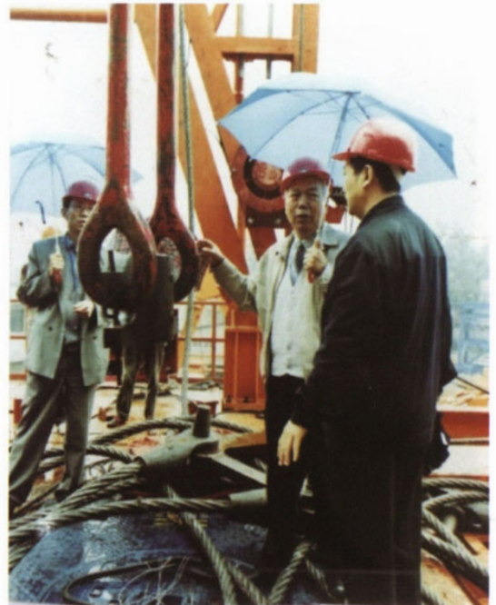
现场调研轻型吊环吊卡的使用情况