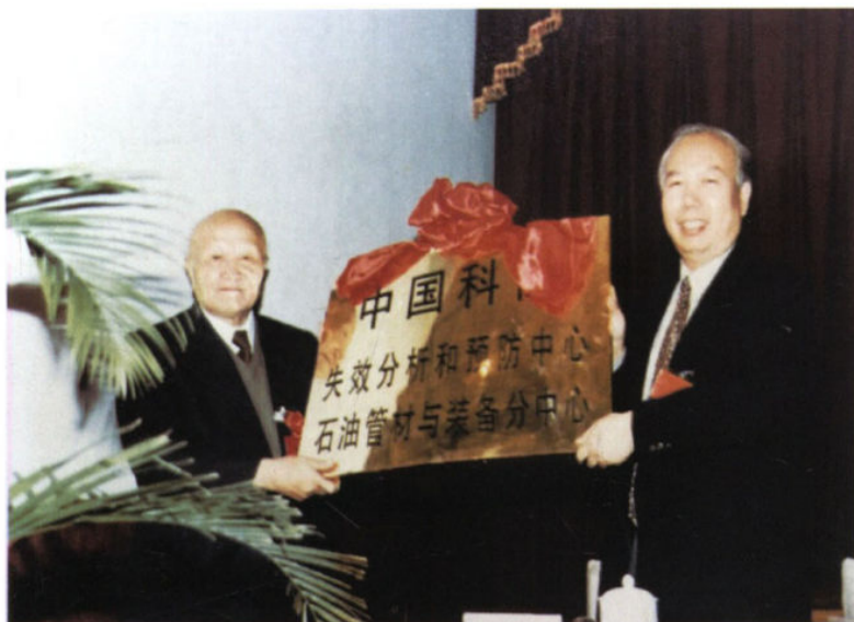
1996年10月，师昌绪院士向石油管材研究所颁发“中国科协失效分析和预防中心石油管材与装备分中心”牌匾