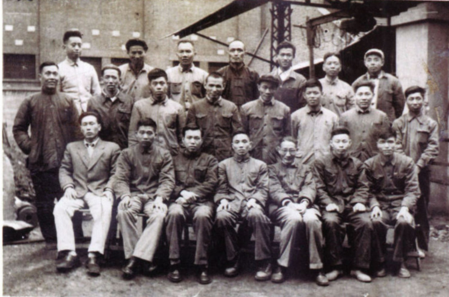
在上海东风机器厂 协助解决 B 型吊钳产品 质量问题时与热处理工 段的工人和技术人员合 影（1963年5月）