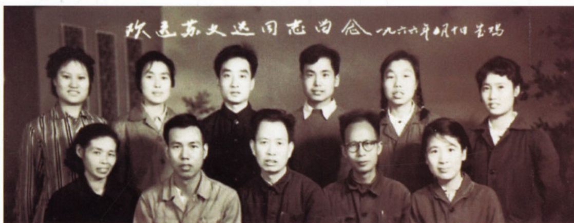
石油工业部第一机械厂设计科综合组全体合影（1966年）