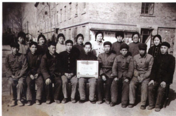
宝鸡石油机械厂研究所材料研究室 成立时的合影 (1978年)