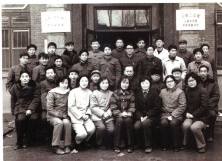
石油工业部在宝鸡石油机械厂中心实验室基础上组建了石油工业部石油专用管材料试验中心 (1982年)