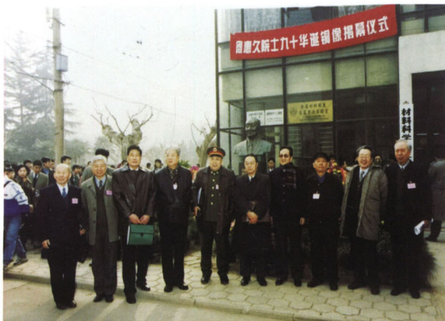
1999年4月，西安交通大学举行了周惠久院士铜像揭幕仪式。原机械工业部副部长、中国机械工程学会理事长陆燕荪（左四），中国工程院院士徐滨士（左五）、崔昆（左一）、雷廷权（右三）、李鹤林（右一），清华大学教授陈南平（右二）等参加了揭幕式