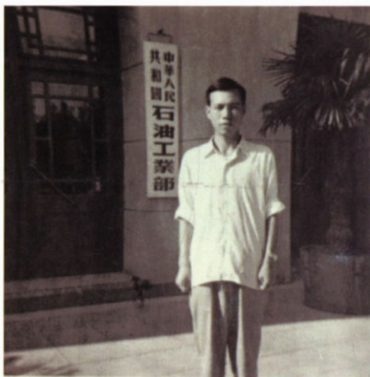
在石油工业部机关编写 《石油机械用钢手册》（1963年至1965年）