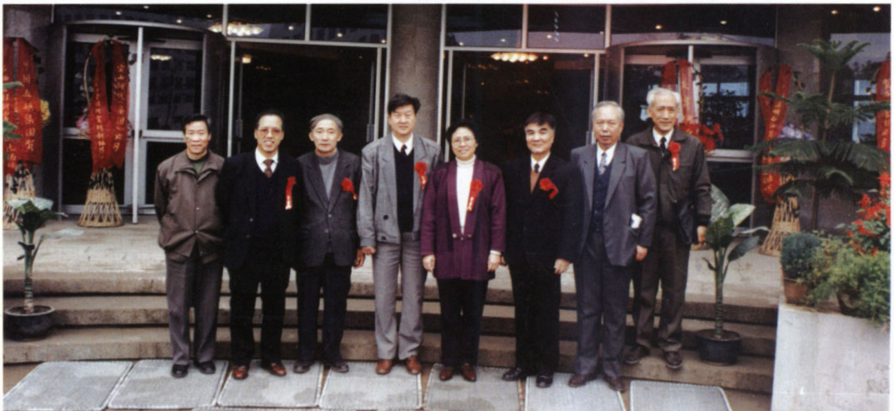
1994年11月，石油管材研究所西安新址落成，由宝鸡向西安的搬迁工作全部完成，上级领导来所祝贺时合影。左起：中国石油天然气总公司技术监督局副局长金志俊、陕西省计划委员会主任李树元、中国石油天然气总公司原副总经理李天相、中国石油天然气总公司副总经理张永一、中共陕西省副书记范肖梅、陕西省原副省长曾慎达、石油管材研究所所长李鹤林、中国石油天然气总公司科技局副局长王明太