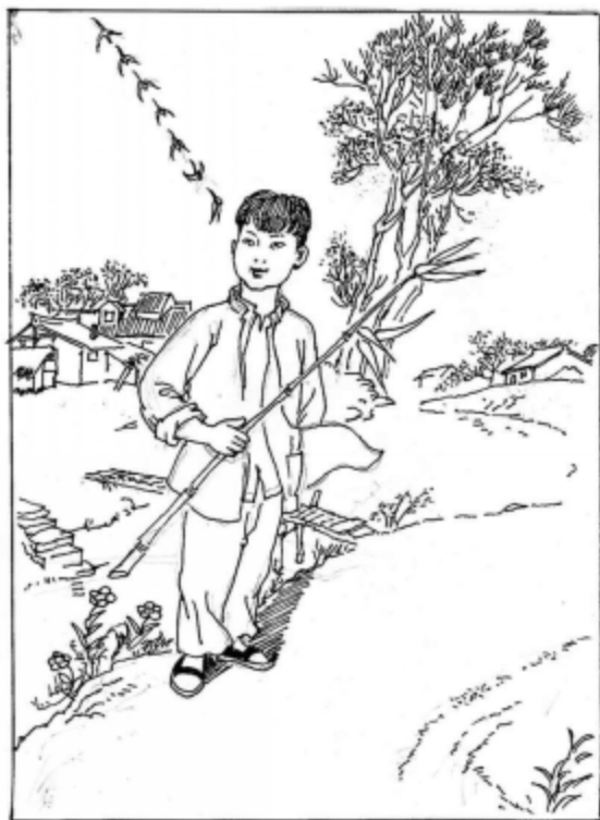
儿时的岁月——我心底最美的图画