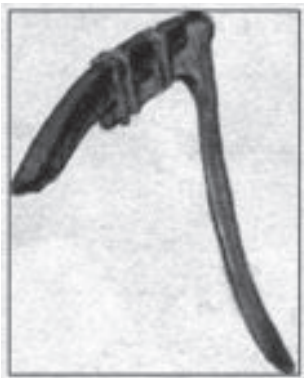
大汶口出土的骨镰