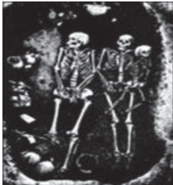
大汶口遗址的墓葬