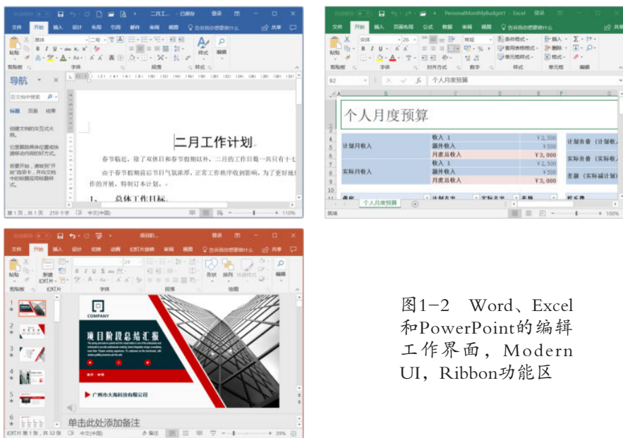
图1-2 Word、Excel和PowerPoint的编辑工作界面，Modern UI, Ribbon功能区

无论是打开一个已经建立的文档，还是新建一个文档后，Office都自然而然进入了“编辑界面”。这是最重要的工作界面，日常的编辑、排版、修改、审阅等工作均在这一界面上进行。