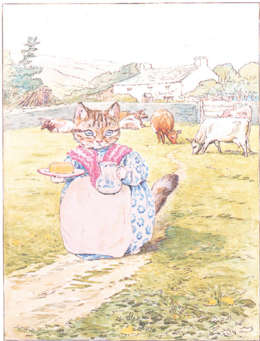
从农场取的黄油和牛奶