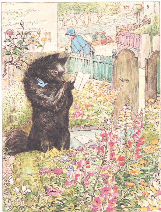
达吉丝收到了邀请