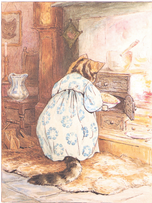
用鼠肉做成的馅饼