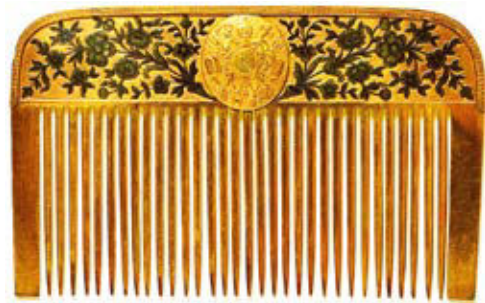
19世纪俄国传统风格的梳子。

wài pó shuō dào : “ qīn ài de hái zi , qù gēn fù qīn dào gè bié ba , nǐ zài 外婆说道：“亲爱的孩子，去跟父亲道个别吧，你再 yě méi bàn fǎ kàn dào tā le 。 tā nián jì qīng qīng jiù sǐ le ……” 也没办法看到他了。他年纪轻轻就死了……”