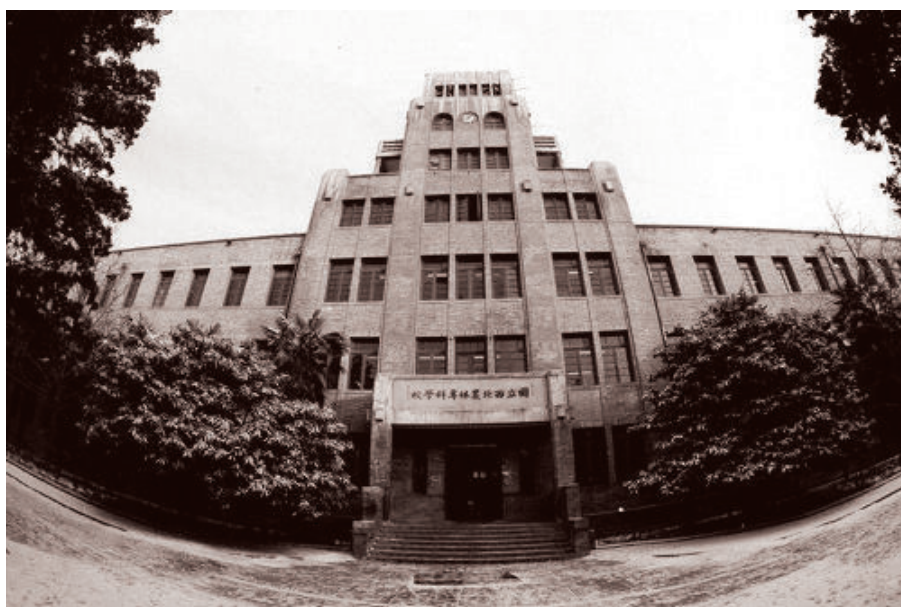
国立西北农林专科学校—国立西北农学院主楼 (1934年建成, 1941年曾遭日机轰炸)