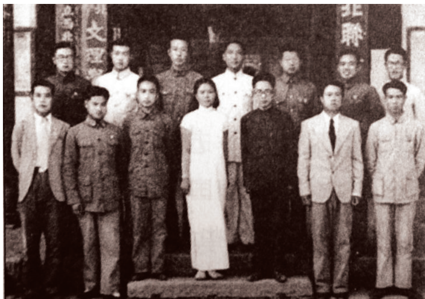
1939年国立西北师范学院教育系同学在城固合影