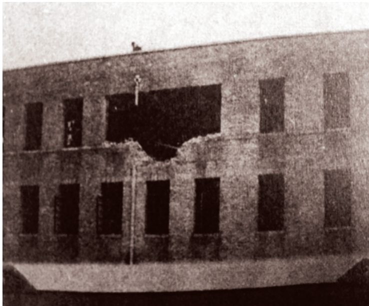
1940年8月30日，1941年8月5日，1941年11月3日，国立西北农学院相继三次遭日机轰炸。图为遭日机轰炸后的西农主楼（三号楼）外景