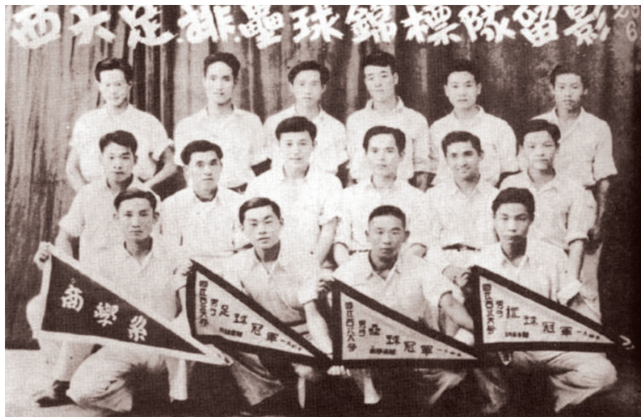
1940年，国立西北大学足球、排球、垒球锦标队合影