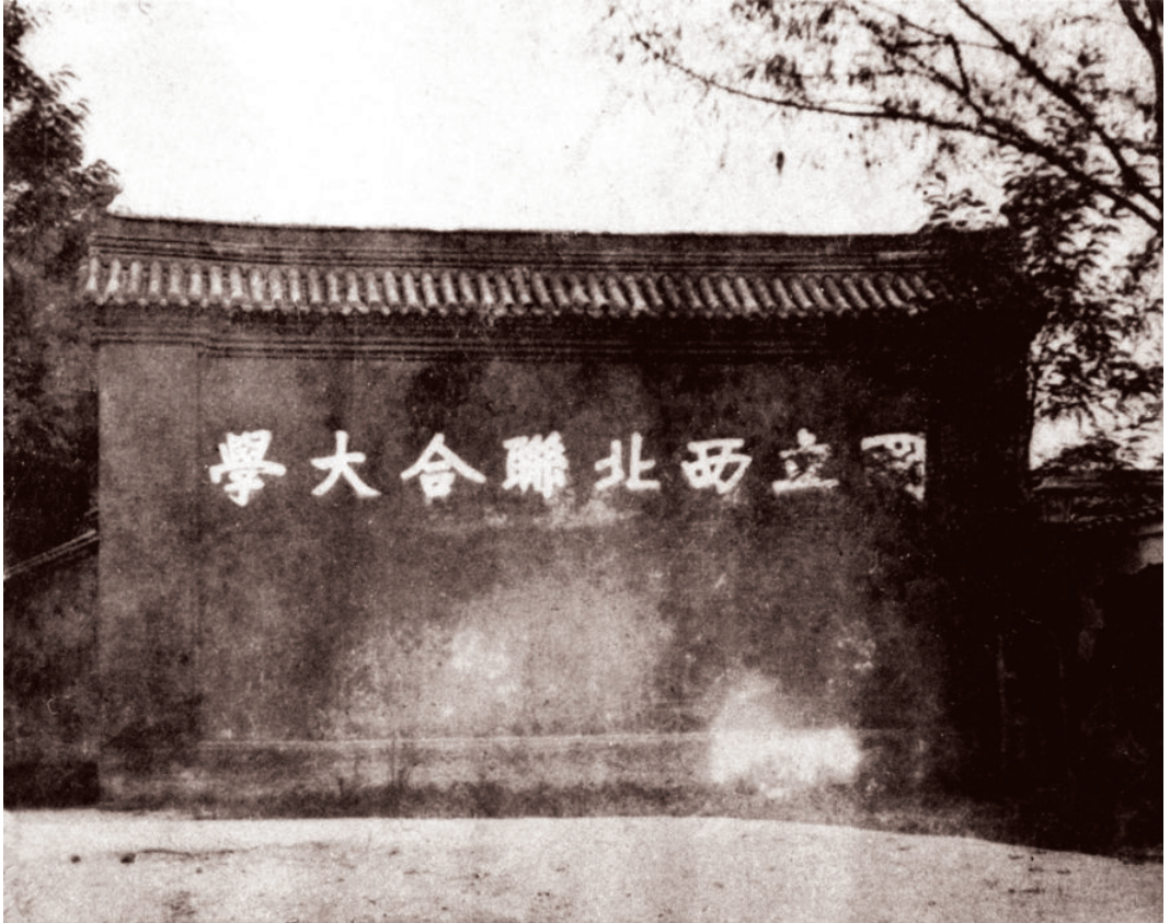
国立西北联合大学影壁（原位于陕西城固县考院）