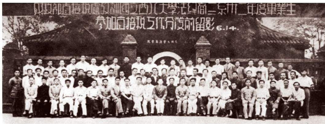
1943年6月14日，国立西北大学法商学院卅二年度毕业学生合影