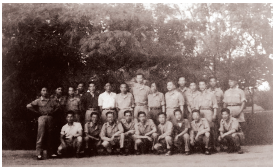
1946年国立西北农学院从军学生复员回校的部分学生合影