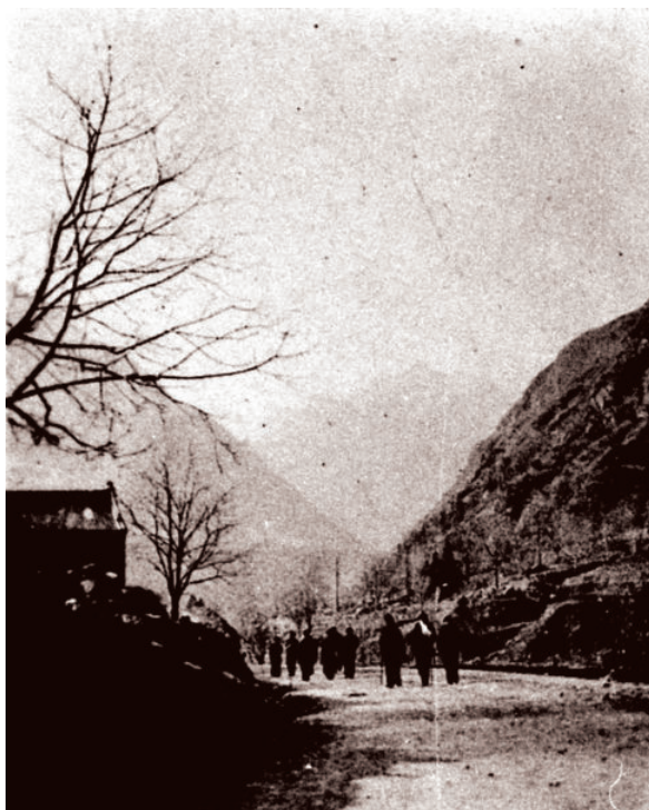
1938年3月，国立西安临时大学迁陕南途中