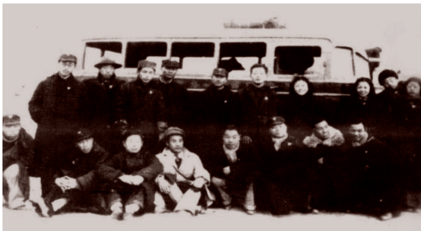
1937年冬，国立西安临时大学部分学生赴延安学习，临行前合影