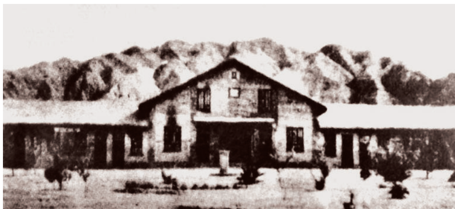
迁兰州后的国立西北师范学院