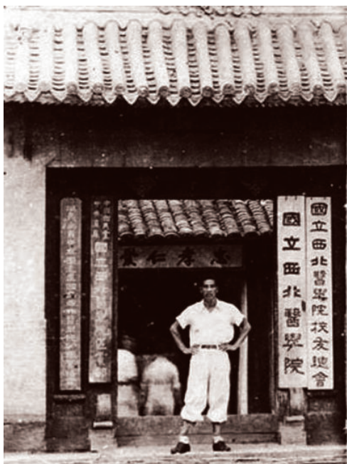
独立设置后的国立西北医学院及其附属医院