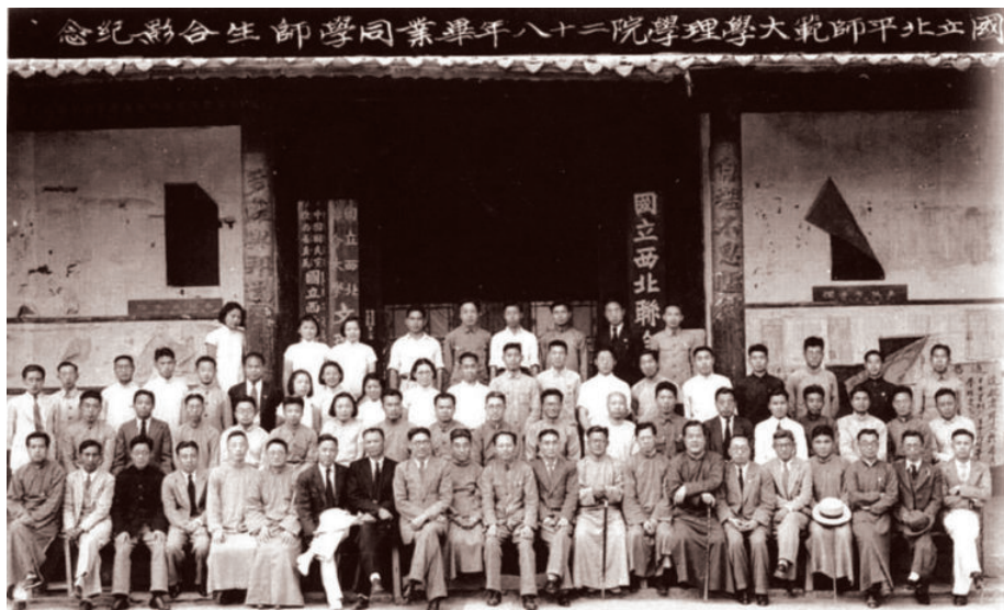
1939年，国立北平师范大学理学院毕业生（国立西北联合大学师范学院）合影 （背景可见国立西北联合大学校牌、国立西北联合大学文理学院院牌）