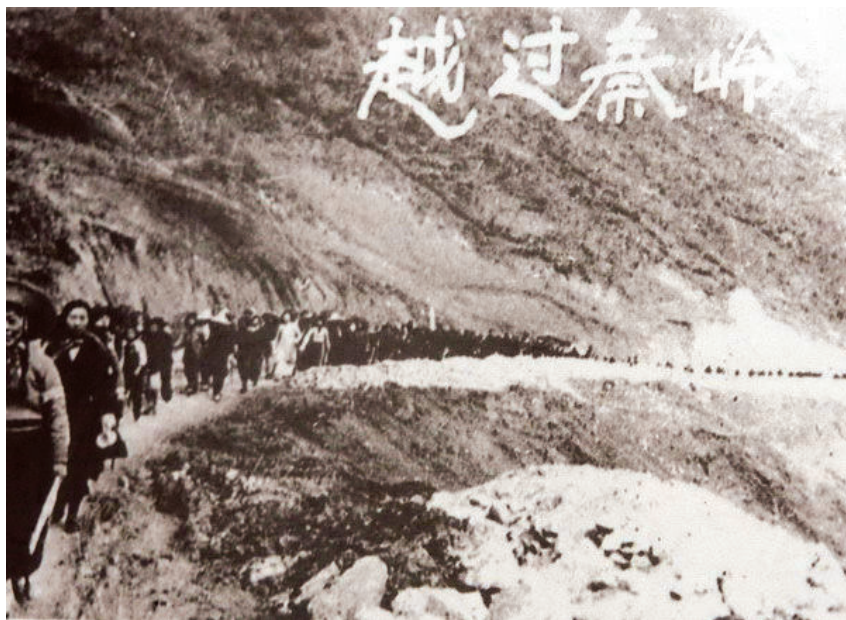
国立西安临时大学翻越秦岭南迁途中的第一中队（包括 220 名女生）