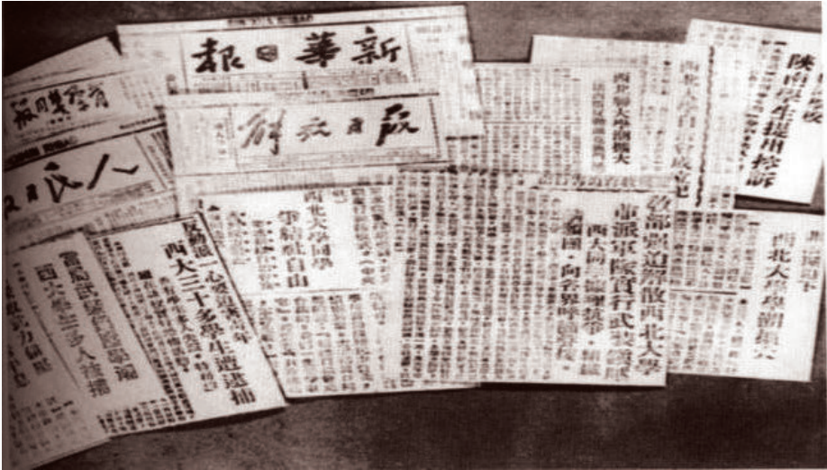
1946年,《解放日报》《新华日报》等报刊有关国立西北大学城固学生运动的报道