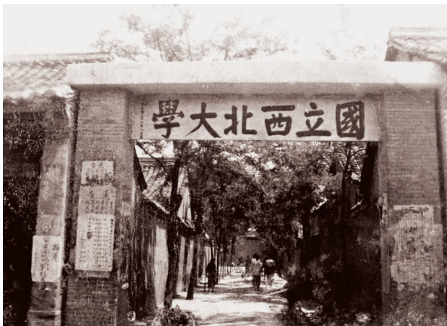
国立西北大学大门（今陕西城固县考院，西北联大校本部旧址）