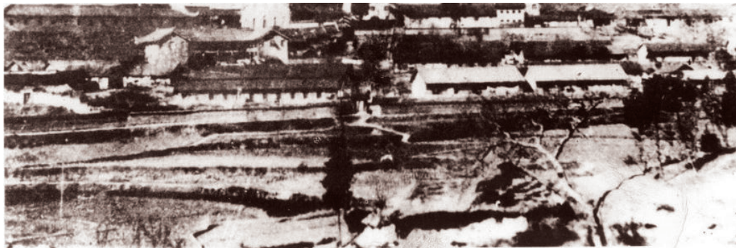
国立西北工学院城固古路坝校址远眺