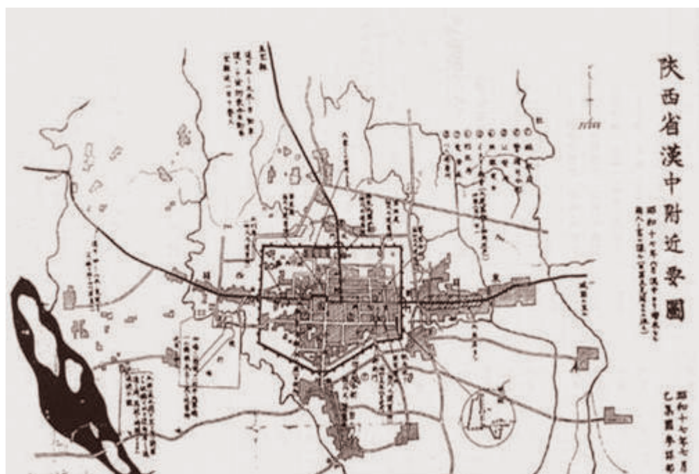
日军使用的《陕西省汉中附近要图》（昭和十七年七月）