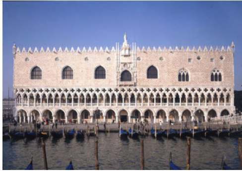
图1 帕拉蒂奥式建筑