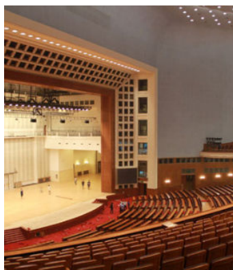
图 5 人民大会堂大礼堂