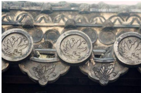
图3 滴水、瓦当与钉帽饰

屋顶装饰不仅在正脊上，垂脊、戗脊和瓦头上也有。这种装饰不是随意加上去的，而是有它的实用功能的。宫殿屋顶的琉璃筒瓦，由下至上，一个套一个。呈平面状的屋面设计不利于排泄雨水，为了便于雨水的排泄，屋面通常会形成一定的坡度，这样一来，上瓦必然会压到下瓦，当这种力连续传递到最下边的瓦时，便会导致其被挤下屋面。出于这样的考虑，人们会把最下边的瓦片加以固定，固定的方法通常是把瓦下边的木制构件用铁钉钉住，这样脊瓦便不会再下滑了。即便这样也并非十全十美，因为雨水若是顺着铁钉流下便会侵蚀木制构件，所以人们会在每一个钉孔上套上一个琉璃构件，这就形成了檐口处排列整齐的一串串琉璃钉帽（图3）。后来，人们对垂脊、戗脊上的琉璃钉帽加以装饰，便