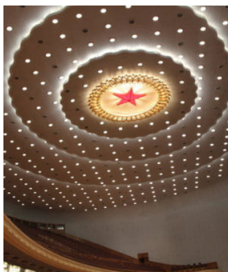
图 4 人民大会堂大礼堂车顶

人民大会堂里的大礼堂也使人感到亲切。“水天一色”的顶篷就是采用了天似“穹隆”的圆形设计，使顶篷与墙面圆角相接。顶篷中心是一颗红色的五角星，红星周围放出一束束的金光，光芒的外环是镏金的花瓣。外圈有三环波浪形暗灯槽，槽板上有 500 个灯孔，犹如夜空中群星璀璨，象征着全国人民团结在党中央周围（图 4）。与这种浑圆的空间相适应，建筑的其他部分大多采用流动的曲线（图 5）。