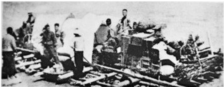
20世纪30年代,行驶在黄河宁夏段的大型皮筏

军粮上路后,康熙及其随行诸王子、大臣、侍从于银川横城登船北上,约期到白塔为出征将士送行。当时,供“御驾”的船只多达101艘,其中有3艘楼船专为康熙及其近臣使用。楼船就是双层船。想想看,当年的黄河上浩浩荡荡行驶着这样一条船队,那是何等的壮观。