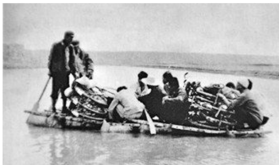
20世纪80年代,中宁石空渡口的羊皮筏