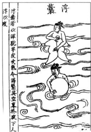
《武经总要》里士兵用浑脱渡黄河的图

浑脱的普遍使用，首先就是从西夏开始的。黄河流经西夏全境，流程近2000公里，其中，中卫以上近1300公里水域水流湍急，礁石密布，有险滩无数，很多地方没有渡船，浑脱便成为最理想的渡具。上岸后，浑脱还能放掉气盛上水。后来，这种实用性极强的袋囊传入中原，并