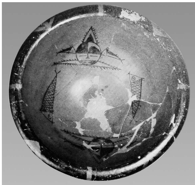
图 1-4 半坡类型彩陶人面鱼纹盆 新石器时代早期 高 15.6 厘米,口径 24.8 厘米 1958 年陕西省宝鸡市北首岭出土 中国国家博物馆藏