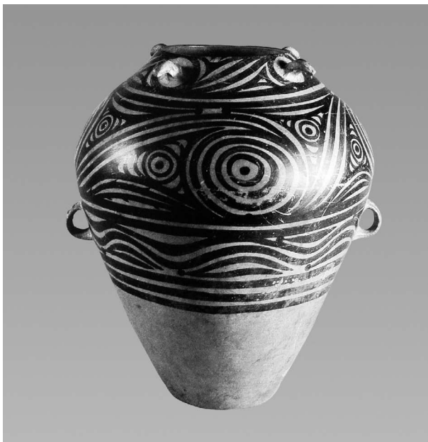
图 1-7 马家窑类型四系双耳彩陶瓮 新石器时代晚期 高 50 厘米,口径 18.4 厘米,底径 15.9 厘米 1956 年甘肃省永靖县出土 中国国家博物馆藏

马家窑类型彩陶在装饰彩绘上主要使用了黑彩,也有一部分是在黑彩中加施红彩。装饰的面积比以前大,有的饰满器物全身,盆、钵、碗等器物往往内外均加彩绘。纹样以波状纹、垂幛纹或旋涡纹等几何纹为主,以动物纹和人物纹为辅。陕西陇县出土的尖底瓶与甘肃永靖县出土的四系双耳彩陶瓮(图 1-7)是这一时期的代表。其主要采用弧线与螺旋纹为图案,外加鱼眼图案作为点缀。整体线条流畅,画面生动活泼,和谐统一,充满韵律感。