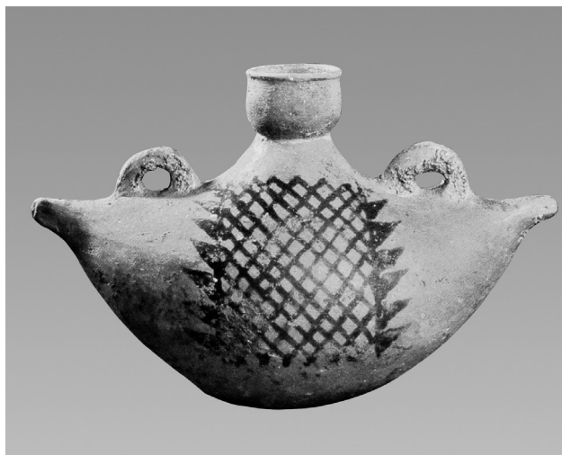
图 1-5 半坡类型彩陶船形壶 新石器时代早期 高 16.5 厘米,长 39.8 厘米 1955 年陕西省西安市半坡出土 中国国家博物馆藏