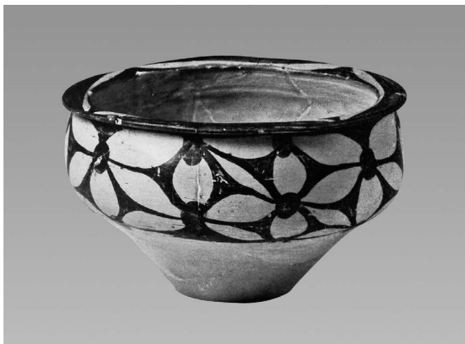
图 1-6 庙底沟类型彩陶花瓣纹盆 新石器时代 高 12.2 厘米,口径 20.3 厘米 1956 年河南省陕县庙底沟出土 中国国家博物馆藏

叶和茎蔓组合成连续交错的多方连续图案,这些图案大都经过装饰变形,纹样和底纹各自形成和谐、有规律的整体,显示了原始先民独特的审美意识。