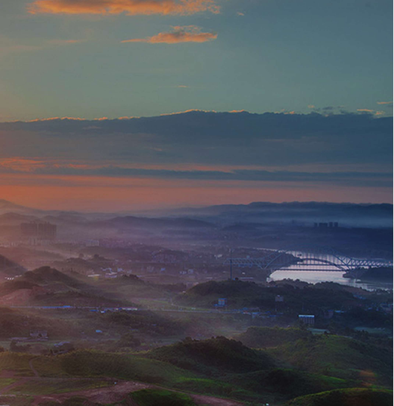
在青秀山上俯瞰南宁