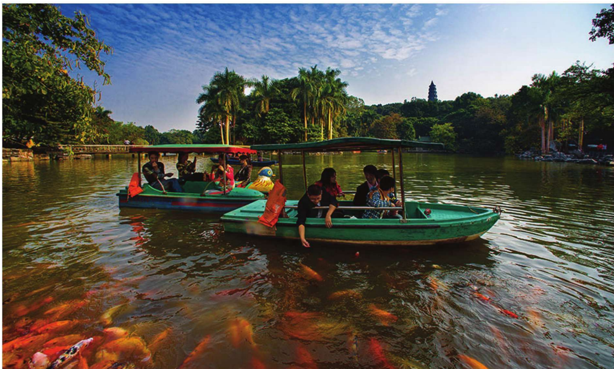
南宁青秀山景区 | 覃少荣 摄