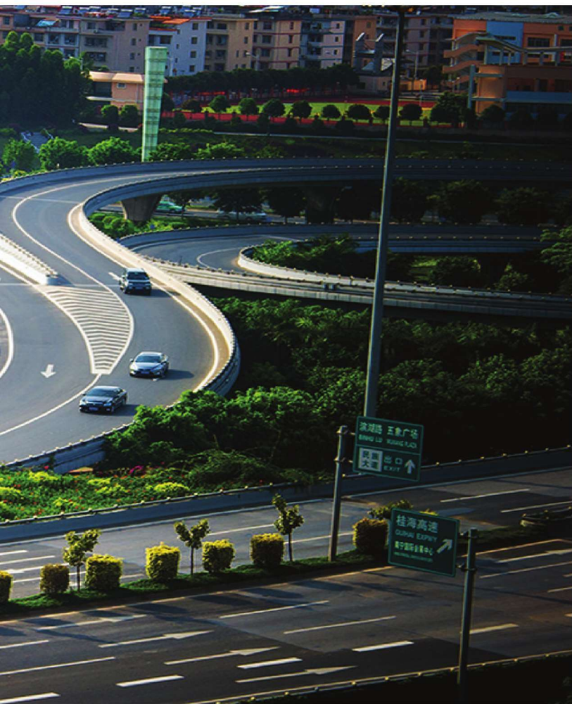
南宁的立交桥

祖祖辈辈生活在这里的南宁人，性格低调，宽厚包容，喜欢帮助他人。网上曾经就流传过一张照片：一位女子受伤倒在地上，一位热心的南宁大姐停下脚步，在炎炎夏日之下帮她撑起了伞。这张图片可以作为南宁的名片，体现的正是南宁的城市精神——能帮就帮。南宁的城市精神体现着这座城市的灵魂，而一座城市有了来自灵魂的精神力量，其发展将不可限量。