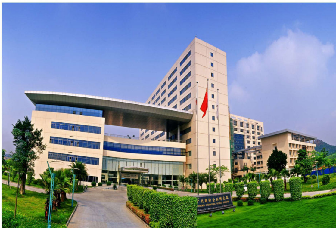
广州国际企业孵化器