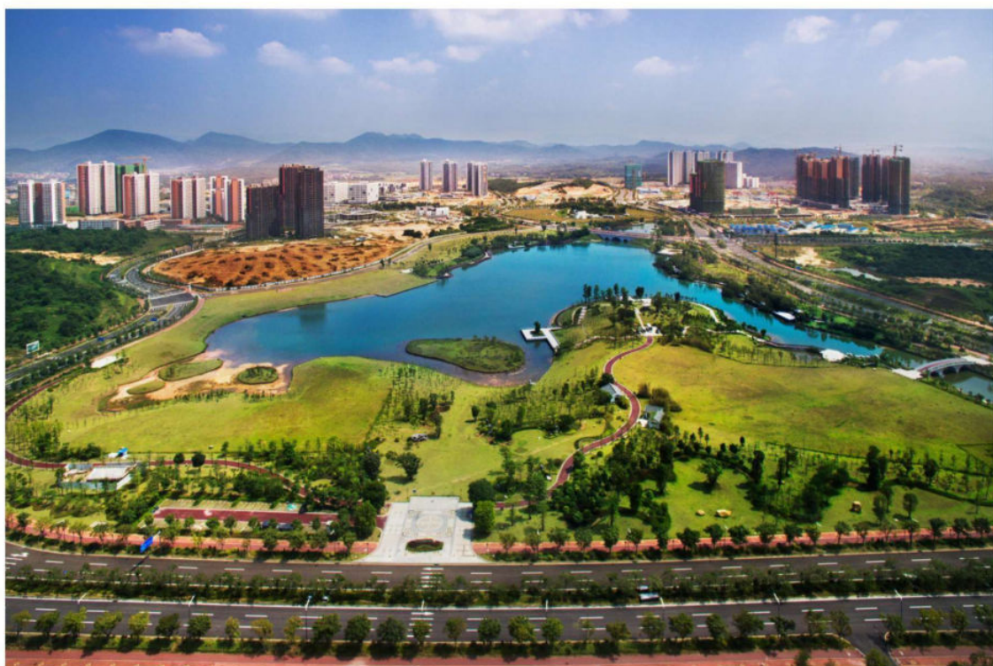
中新知识城凤凰湖