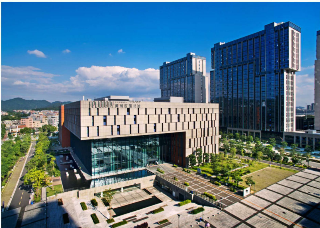
黄埔区图书馆（江海宾摄）