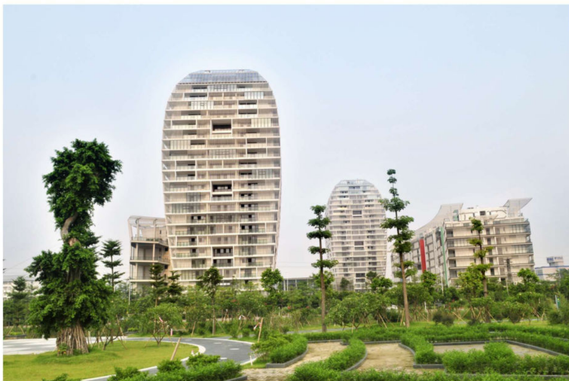
广州香雪国际酒店公寓