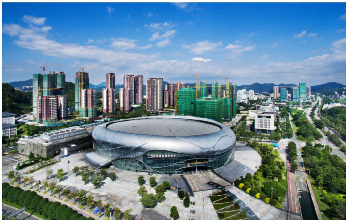
宝能国际体育演艺中心