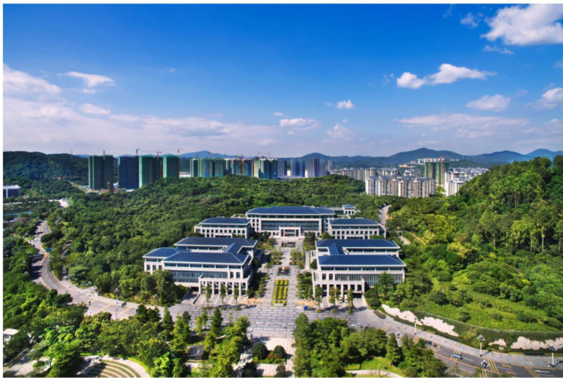
广州市黄埔区政务中心