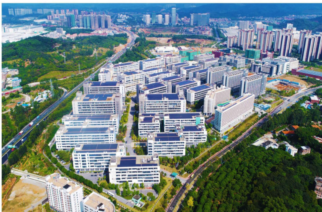
广州市黄埔区科技企业加速器