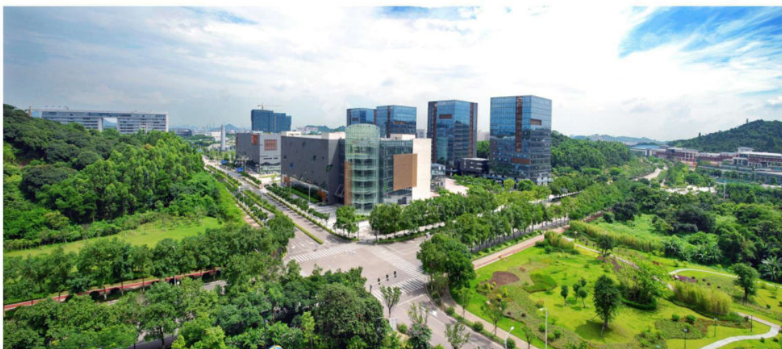
广州科学城企业集群