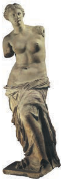
维纳斯是西方神话中众女神中最美的一位，因而也是被艺术家塑造得最多的一位。图为断臂的维纳斯雕塑。

zhè zūn rén jìn jiē zhī bèi shòu tuī chóng de kǎ bǐ tuō lì “这尊人尽皆知、备受推崇的卡比托利