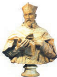
红衣主教也称枢机，他是天主教教宗治理普世教会的职务上最得力的助手和顾问。由于他们所穿的礼服都是“鲜红”色的，因此也俗称“红衣主教”。图为红衣主教的雕塑。