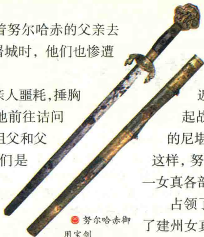
● 努尔哈赤御用宝剑

盛怒之后的努尔哈赤回到家中，拿出了他父亲留下的 13 副盔甲。挑选了一批勇士，用这些盔甲武装起来，并率领他们攻打尼堪外兰。经过激战，尼堪外兰狼狈逃走。努尔哈赤攻克土伦城，又