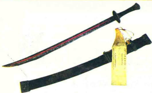
● 这是清太宗皇太极御用腰刀，全长 94.5 厘米、宽 4.5 厘米、厚 0.7 厘米，刀刃锋利，钢质极优，是清太宗皇太极在开国战争中的兵器。

事实力……在实施这些措施的过程中，皇太极还参照中国历代封建王朝的行政组织，设立了吏、户、礼、兵、刑、工六部，由八旗贝勒（亲王）兼管各部事务。1636 年又设都察院，以监察各级官吏。