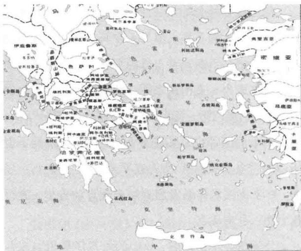
◆ 古希腊诸城邦势力图

时移势迁，迦太基与罗马，成为了两大霸主。罗马擅长于陆地作战，罗马军团是罗马人的骄傲，也