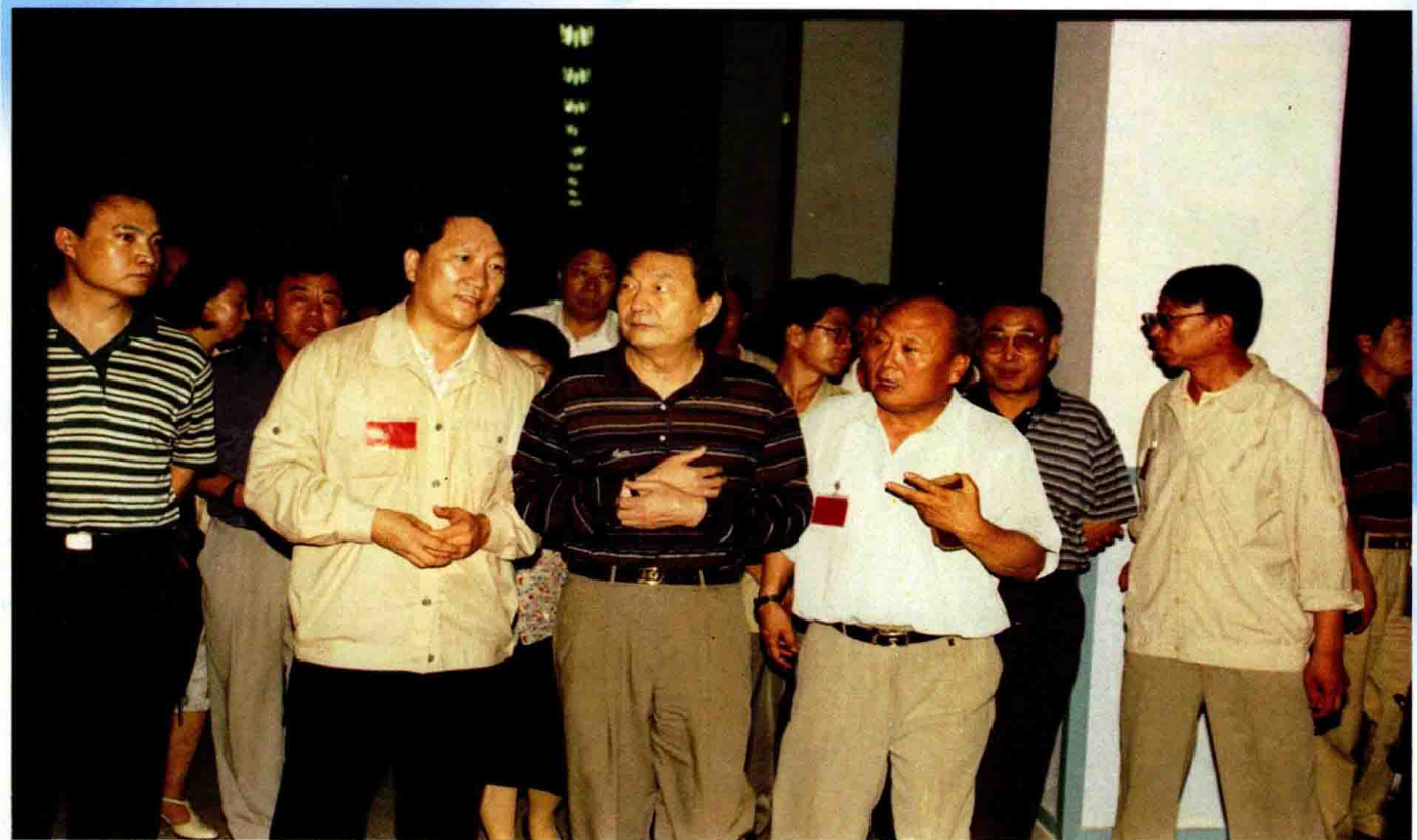
1997年7月22日，国务院总理朱镕基到辽化视察。