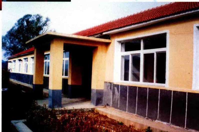
2003年,市总工会按照市委、市政府农村扶贫工作要求,把下达河乡东新堡小学校的教室翻修一新。