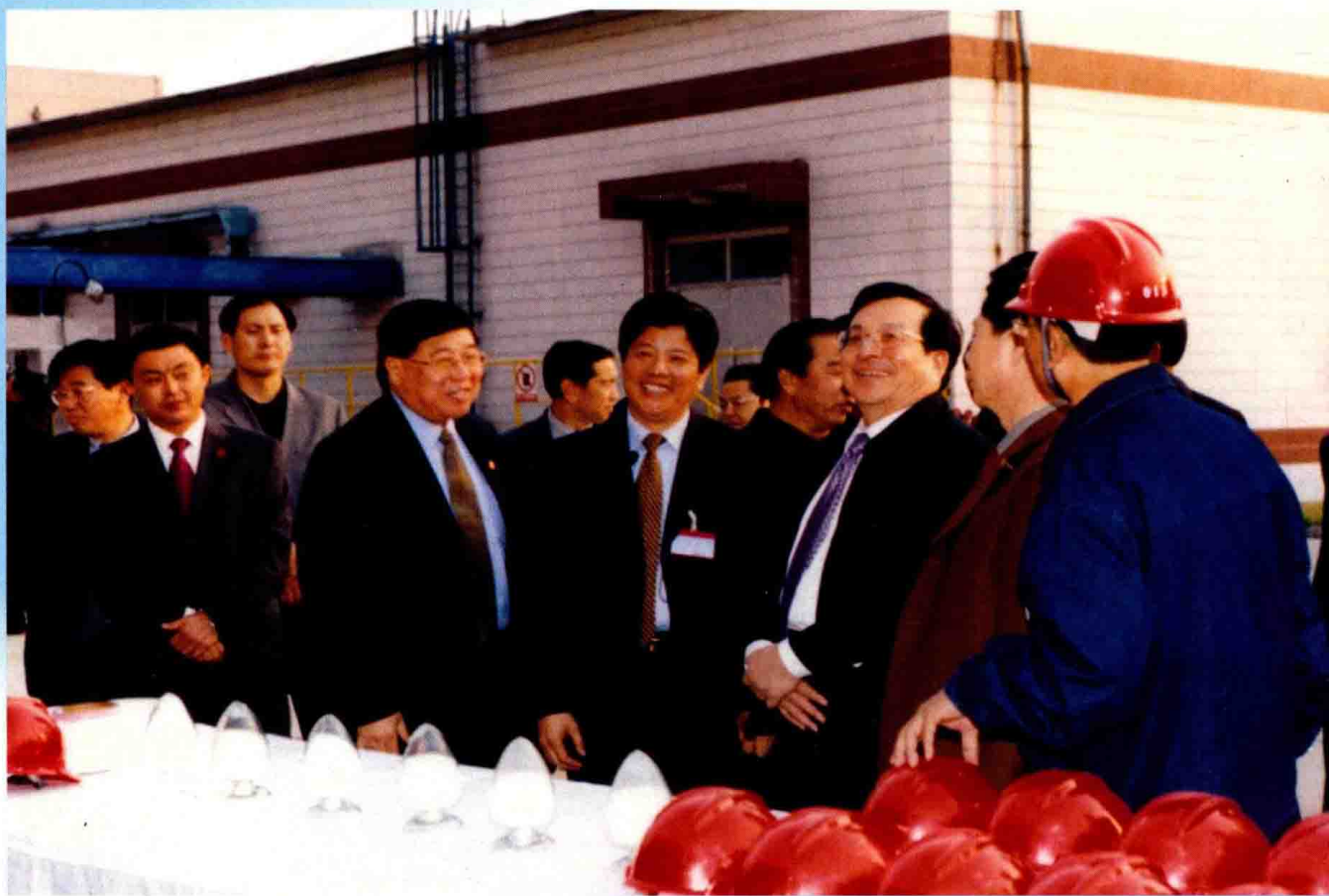
2003年10月21日，中央政治局常委、国家副主席曾庆红（右三）到辽阳石化视察。