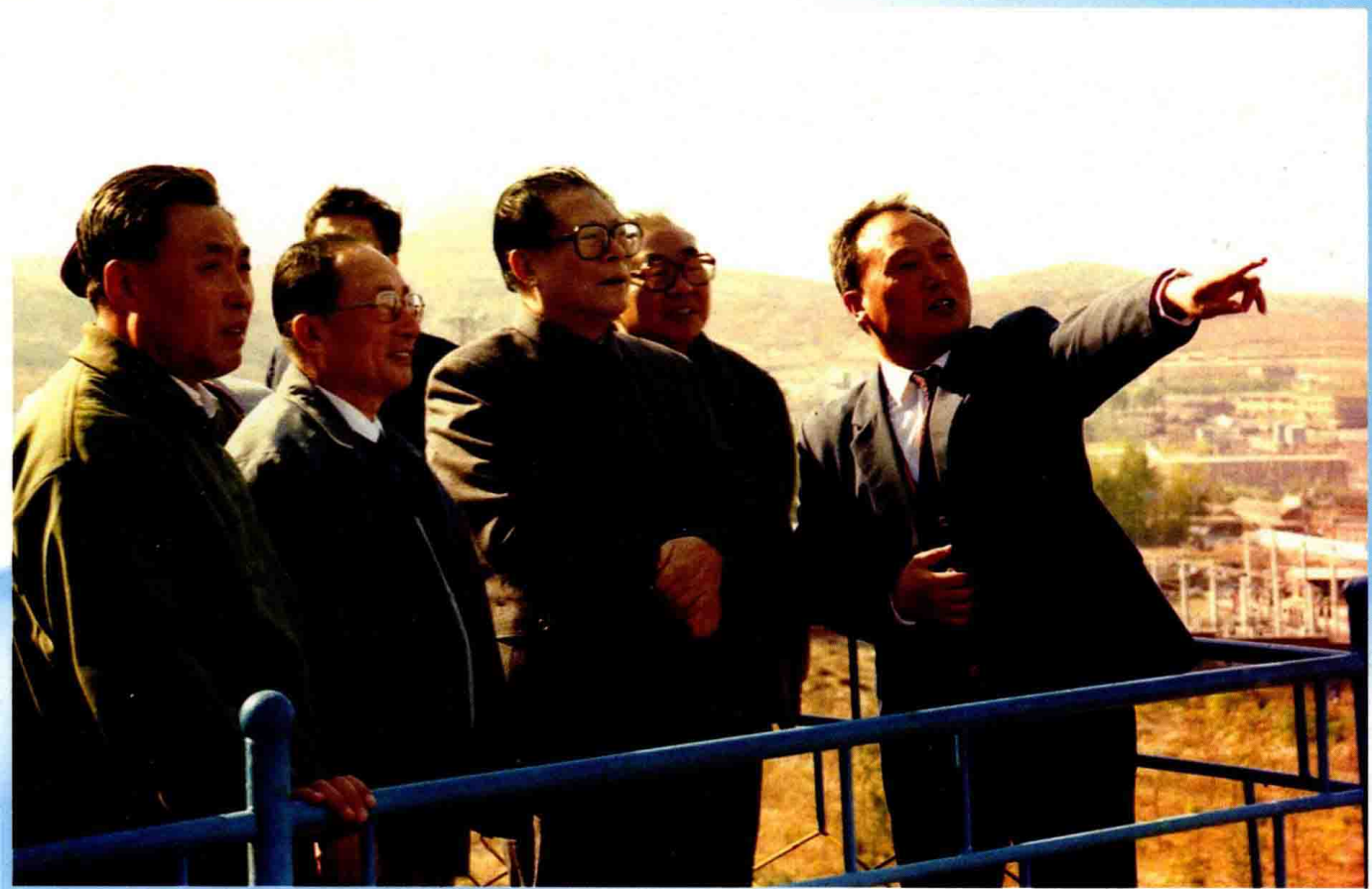
1990年10月28日，江泽民总书记（右二）到辽化视察