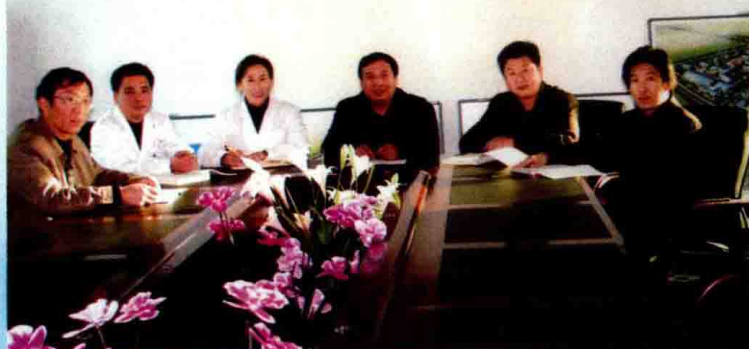
辽阳市汤河温泉职工疗养院领导班子成员