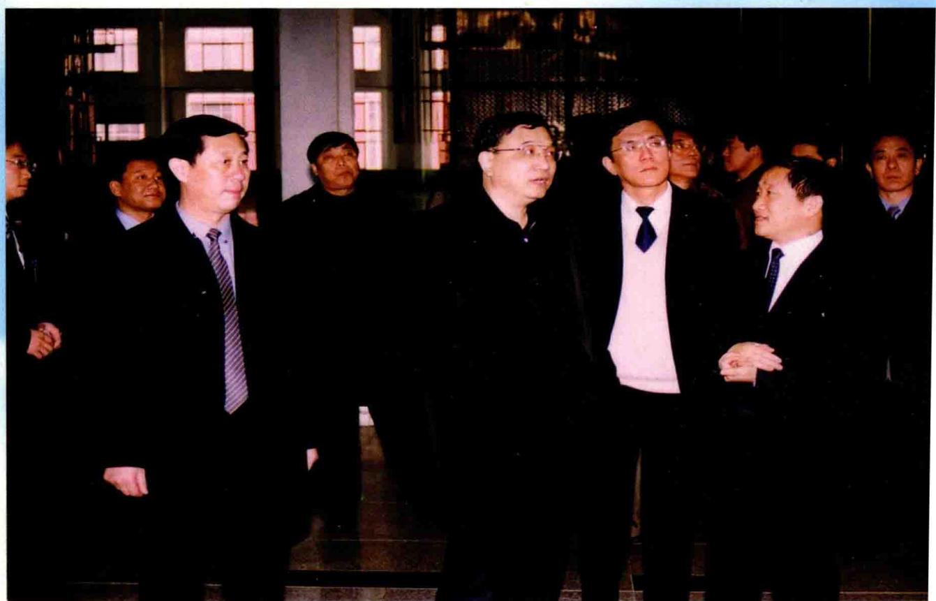
2005年1月6日，辽宁省委书记李克强视察辽宁忠旺集团。