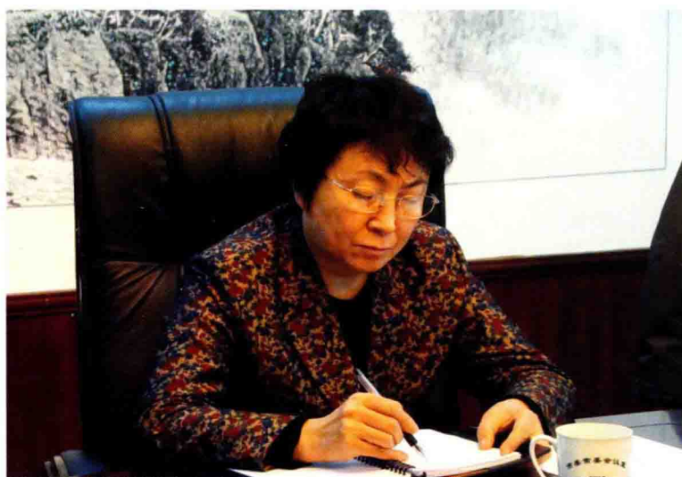
2009年2月20日，省委常委、省总工会主席王俊莲来营口调研，听取工会工作汇报