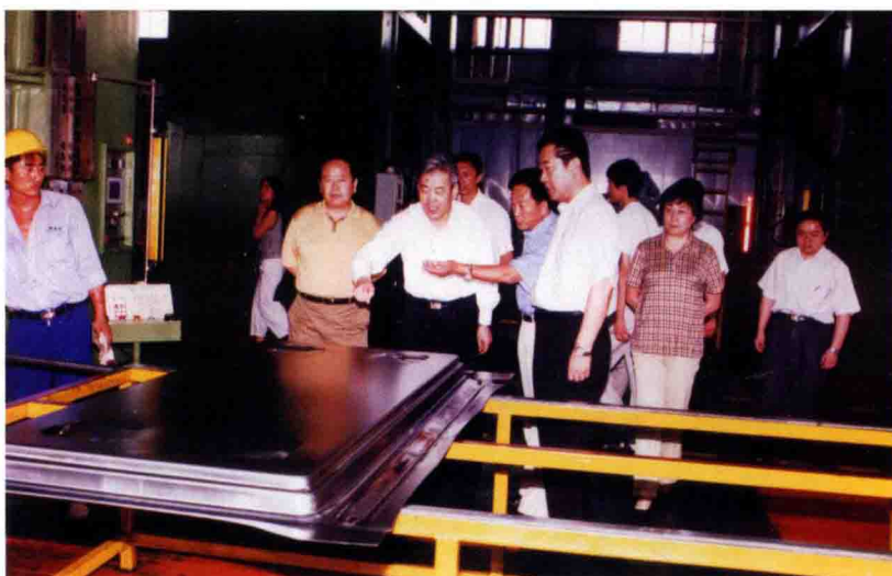
2004年8月11日，全国总工会副主席孙宝树(左3)等领导参观营口盼盼集团生产车间