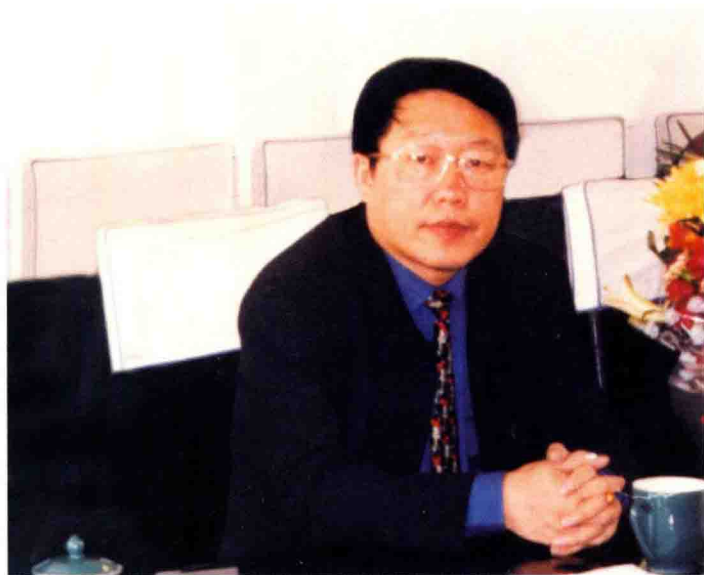
2000年4月26日，市总工会欢送全国劳模赴京参加表彰大会，市委书记许卫国出席并讲话