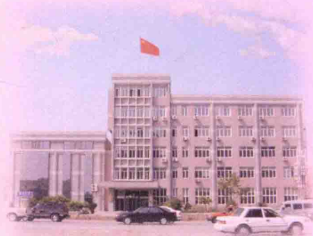
营口市总工会办公楼