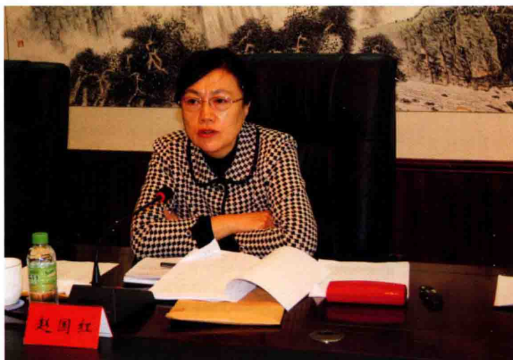
2010年10月28日，省委常委、省总工会主席赵国红来营口调研，听取工会工作汇报