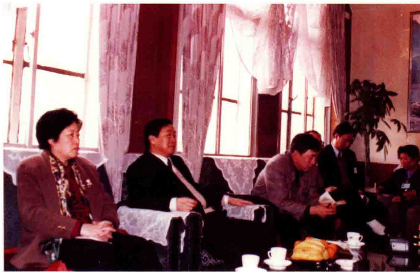
1997年3月12日，省委副书记王怀远(左二)，省委常委、省总工会主席孙春兰(左一)来营口调研。在营口二纺厂听取全心全意依靠职工办企业情况汇报