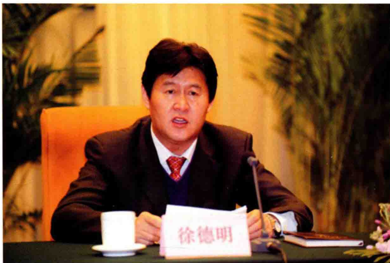
2002年7月17日至19日，全省工会主席工作会议在营口召开，省委常委、省总工会主席徐德明出席并讲话