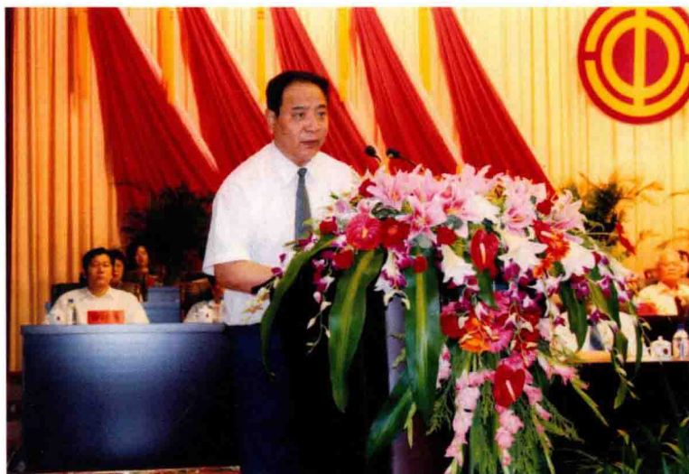
2006年8月31日，市委书记程亚军在市工会第十五次代表大会上致祝词