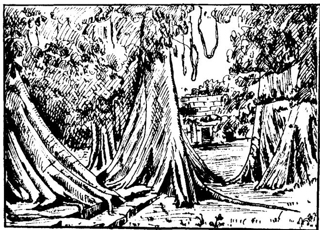
热带雨林中的板状根

芽，……这样就使树冠色彩缤纷，加上藤本植物攀援上升，开满各种颜色的花朵，好象是一座空中花园一样。热带雨林中的乔木，为了支持住高大的树干，在树干的下部生长了热带植物所特有的板状根和支柱根。板状根象块巨大的三角板，从离地数米高的树干上插入地下，有的板状根一片就可以做一张乒乓球台。支柱根