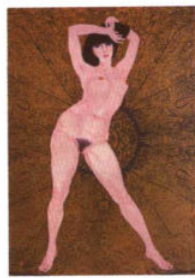
裸妇习作 / 加山又造