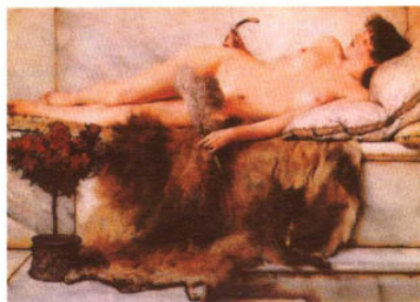
浴室 / 塔得玛