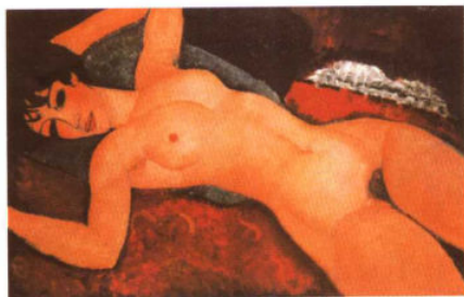
玫瑰色的裸体 / 莫迪里亚尼