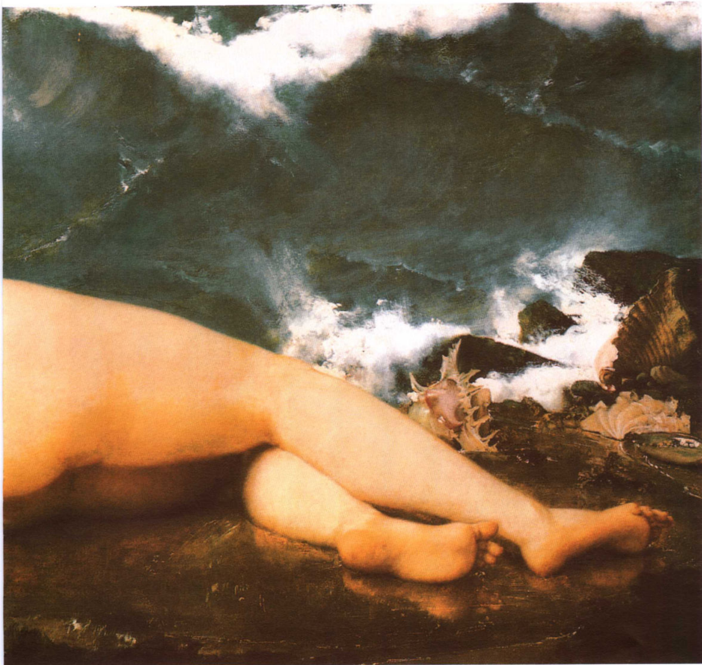
◎ 十九世纪 现实主义人体名画