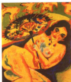
日本伞下的姑娘 / 凯尔希纳