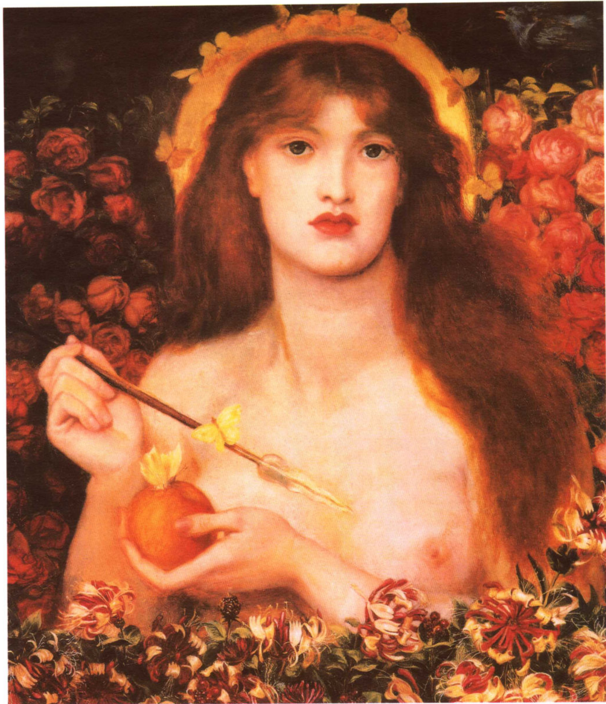
◎ 十九世纪 英国人体名画