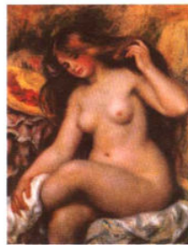
金发浴女 / 雷诺阿