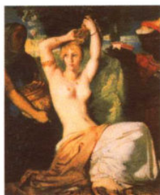
梳妆中的埃斯特 / 夏塞里奥