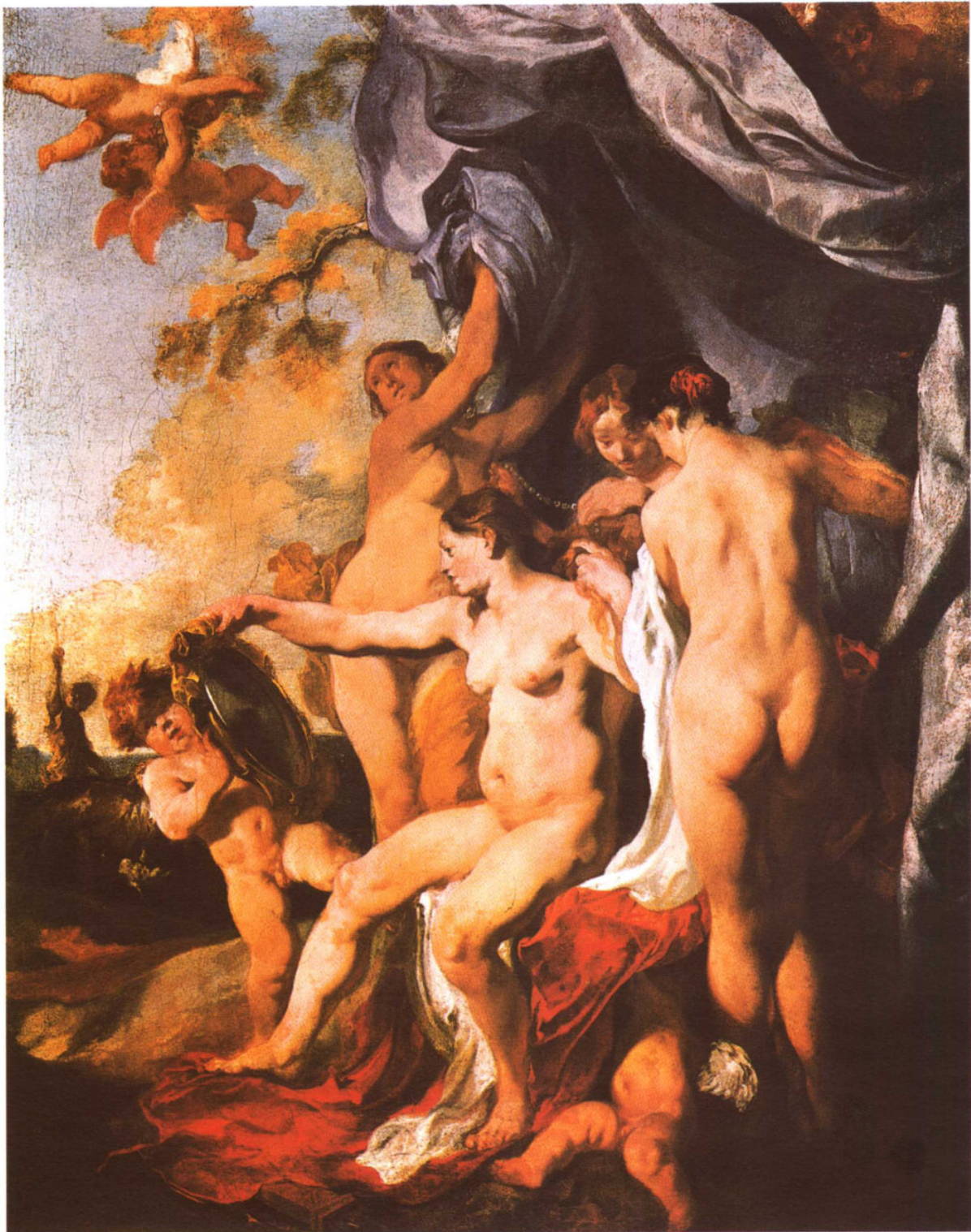
◎ 十八世纪 巴洛克 人体名画