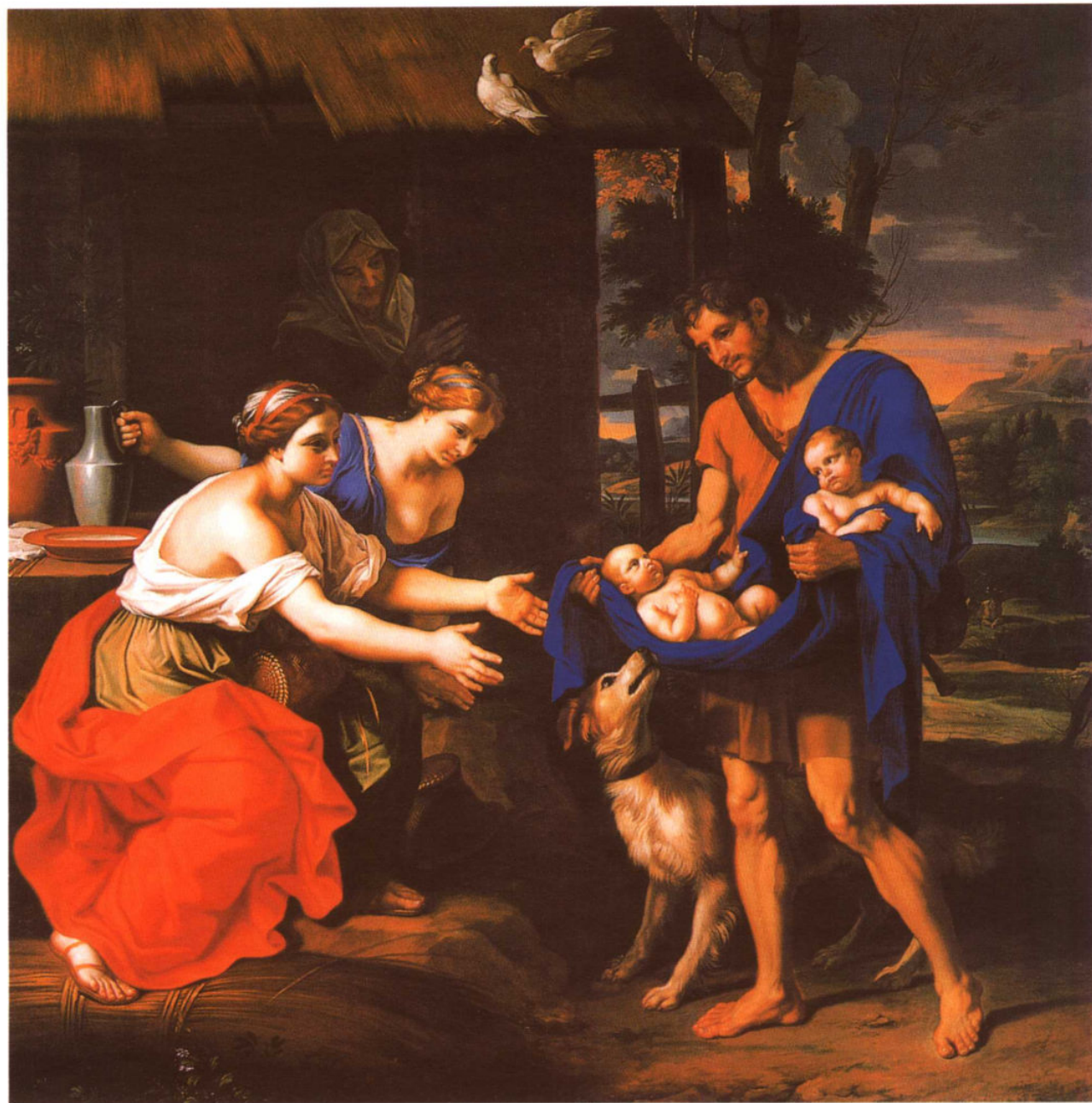
◎ 十八世纪 巴洛克人体名画