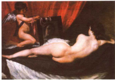
镜前的维纳斯 / 卡拉瓦乔