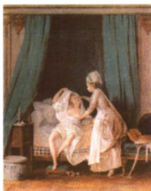
贵妇人的清晨 / 杜芙莲森