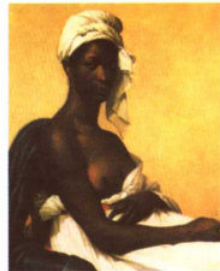
黑人妇女像 / 贝诺瓦