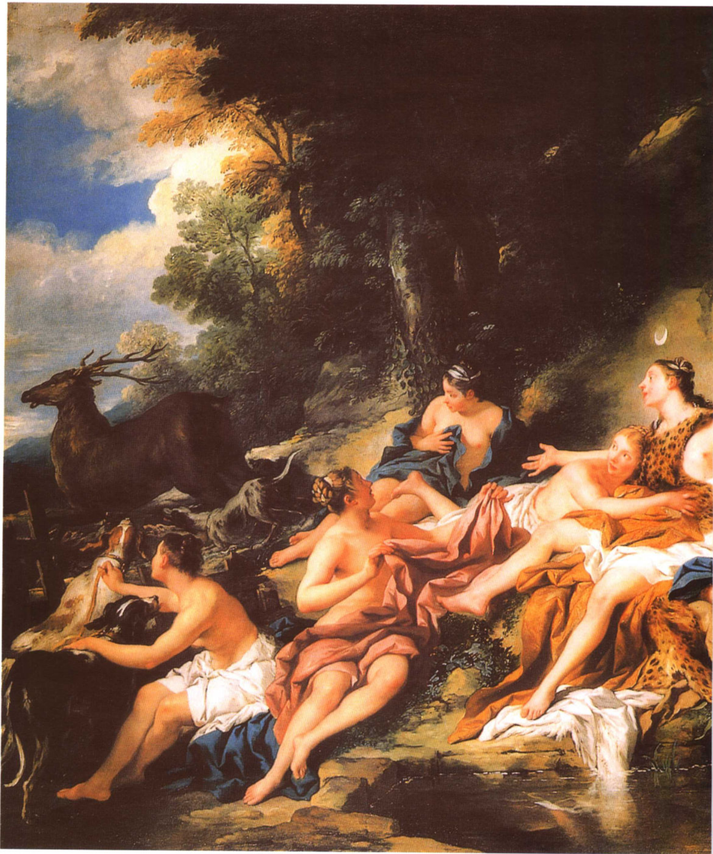
阿克列翁突然出在狄安娜面前