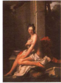
沐浴中的苏珊娜 / 卡拉瓦乔