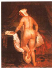
意大利式的就寝 / 凡·诺