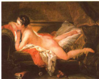
躺在沙发上的奥莫尔菲小姐 / 布歇