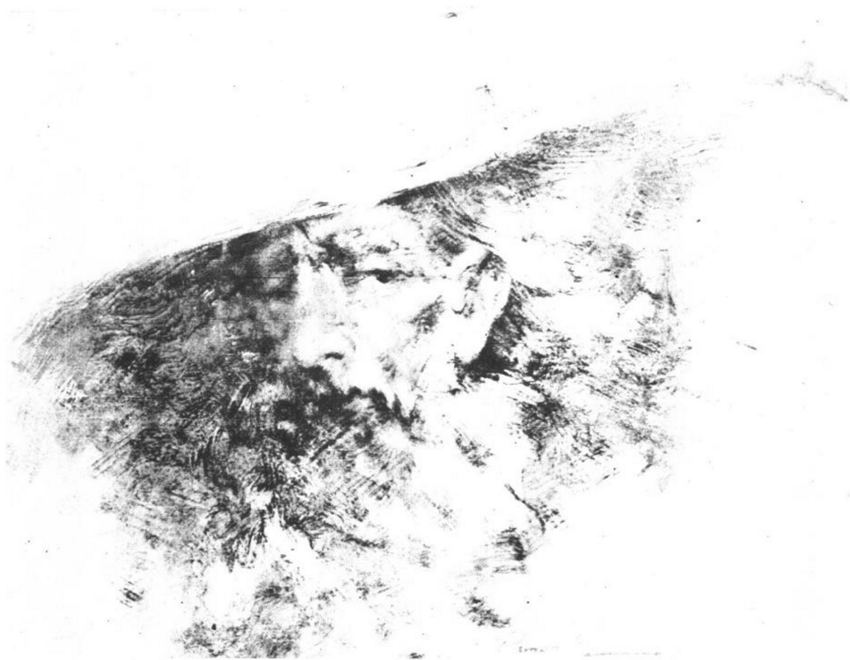
《戴宽沿帽的墨西哥老人》（油画、板上）

凯利也以一个粉笔画家闻名，从1975年始，美国粉笔画协会成立，他成为第一批成员。他的粉笔画别具一格，用水彩配合使用，画面效果既浑厚又丰富，兼得粉笔和水彩的优点。他画油画和丙烯画笔法潇洒，同样保持了绘画性。他还搞版画、用铜塑过肖像，他虽然四十多岁，但对各种绘画手段已很娴熟了。