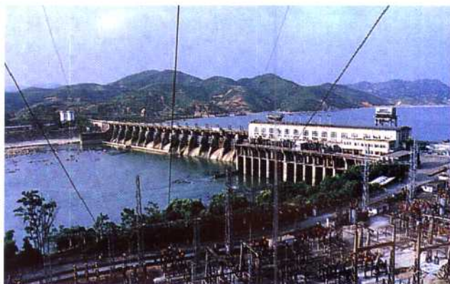
▲西津水电站全貌。该电站于1958年开工,1964年1号机组投产,1979年4台机组全部建成,总装机23.44万千瓦。