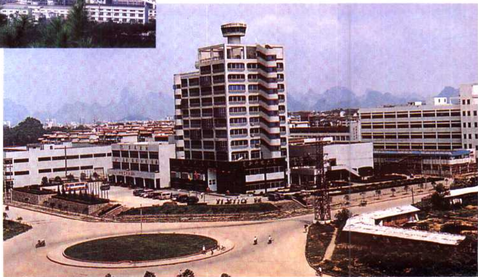
▶桂林国家高新技术开发区。