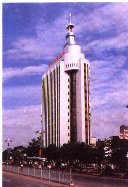
◀南宁电信大楼建筑面积16247平方米，高79.7米，1988年11月建设，1991年8月投入使用。