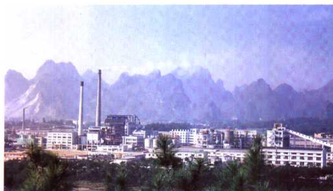
◀贺县纸浆厂。该厂“七五”计划期间进行前期工作，1991年9月开始建设，1994年建成，设计能力为5万吨。