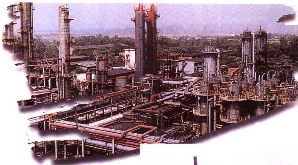
◀柳州化肥厂厂区一角。该厂于1967年建成，初期年生产能力为合成氨4.5万吨。经改造、扩建，现生产规模为年产合成氨18万吨，硝酸铵12.5万吨，尿素15万吨，纯碱、氯化铵、碳酸氢铵各4万吨。