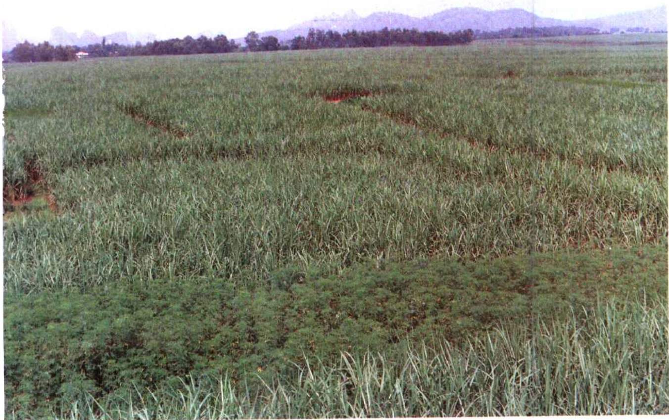
▲崇左县左州乡甘蔗林。崇左县是广西糖业生产基地之一，1990年甘蔗种植面积23.8万亩，人均产蔗2.76吨，名列全自治区之首。