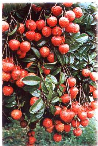
◀北流市盛产的桂味荔枝。