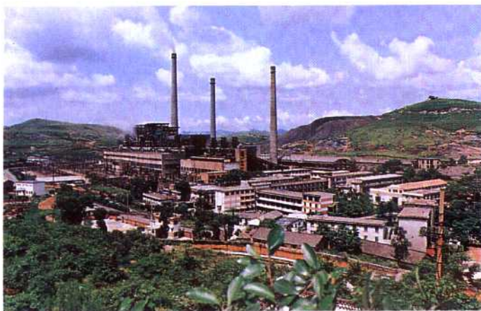
◀合山火电厂全貌。该厂于1967年开工,其后经3次扩建,至1986年共建成装机52.5万千瓦。