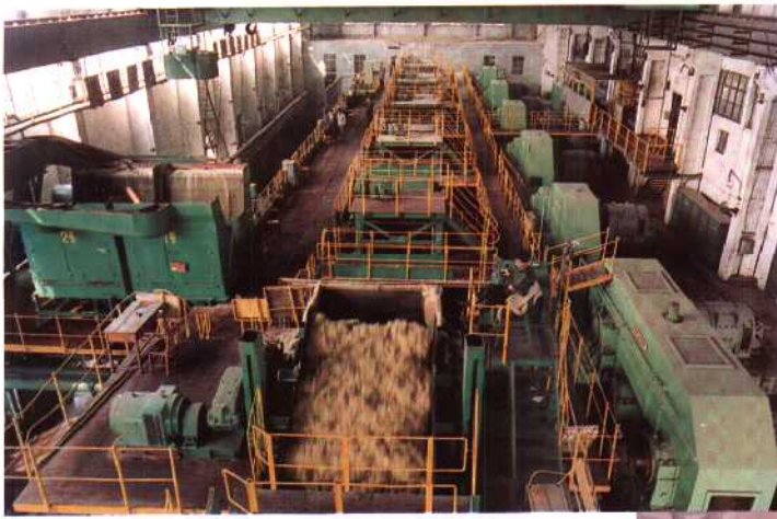
◀广西贵糖(集团)股份有限公司制糖厂压榨车间一角。该公司前身为贵县糖厂,于1954年开工,1956年投产,日榨甘蔗1500吨。改革开放后经连续改造,至90年代,已成为日榨万吨的大厂。