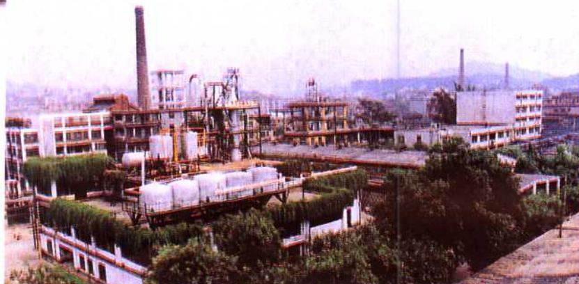
▶梧州松脂厂。该厂在1949年的小厂基础上逐步改、扩建，已形成年产松香5万吨的规模。