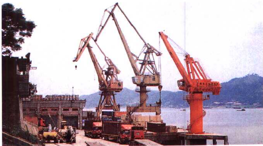
▶梧州西江码头是广西客货轮直通香港、澳门的内河港口。年吞吐能力700万吨。