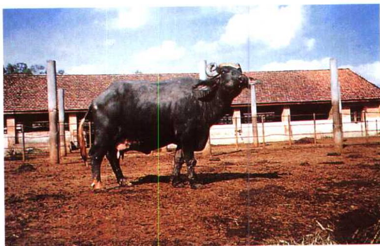
▲广西畜牧研究所奶用水牛。