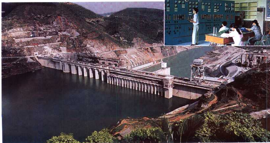
红水河是中国水力资源的“三大富矿”之一,规划建设10个梯级电站,总装机1200余万千瓦。图为已建成的岩滩水电站(红水河第五梯级)。该电站第一期装机121万千瓦,于1985年开工,1992年1号机组发电,1995年4台机组全部投产。