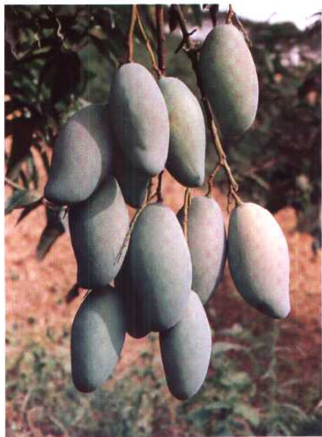
▶百色地区右江沿岸百色、田东、田阳三县，以其独特的气象资源，近年大量发展芒果种植。