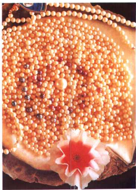
▲合浦珍珠。合浦为世界闻名的南珠主要产地。