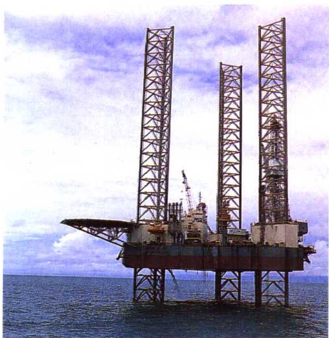
◀北部湾石油钻井平台。