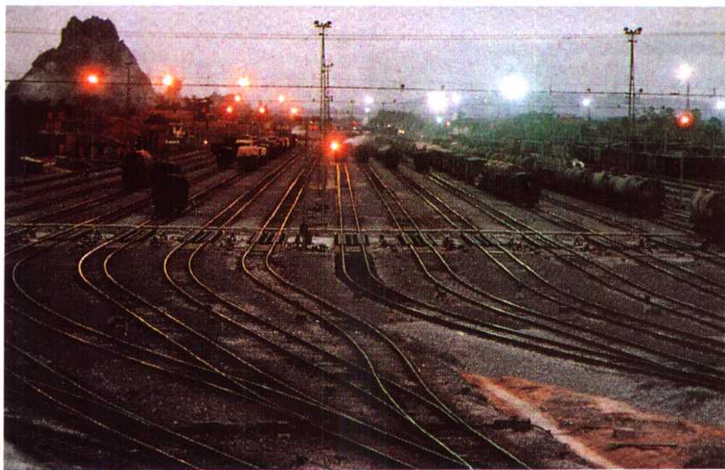
▲柳州铁路编组站扩建工程于1990年6月3日全部建成投产，使列车编解能力由原来每日4200辆增加到6200辆。