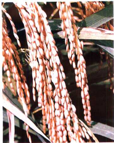
▲北流市种植的特优63号品种。