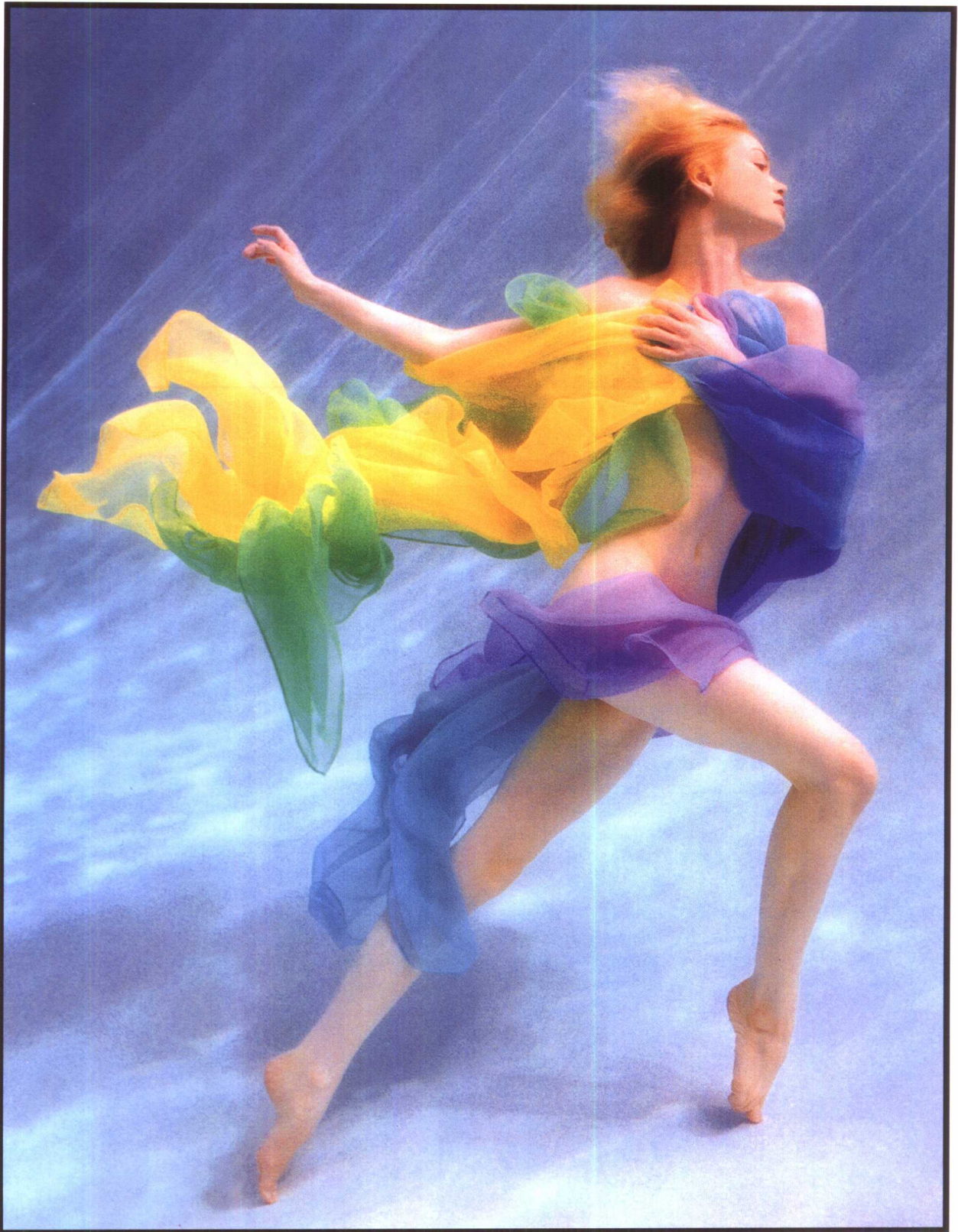
水下人体 霍华德·沙茨(美)

霍华德·沙茨(Howard Schatz)跟他的夫人和助手贝弗里·奥恩斯坦(Beverly Ornstein)工作和生活在纽约。沙茨是一位天才而勤奋的摄影家,从不间断地进行新的探求、新的尝试。从1993年开始,已经连续出版了十余本不同题材、不同风格的影集画册。这里选的水下舞蹈照片,是沙茨夫妇的新作。