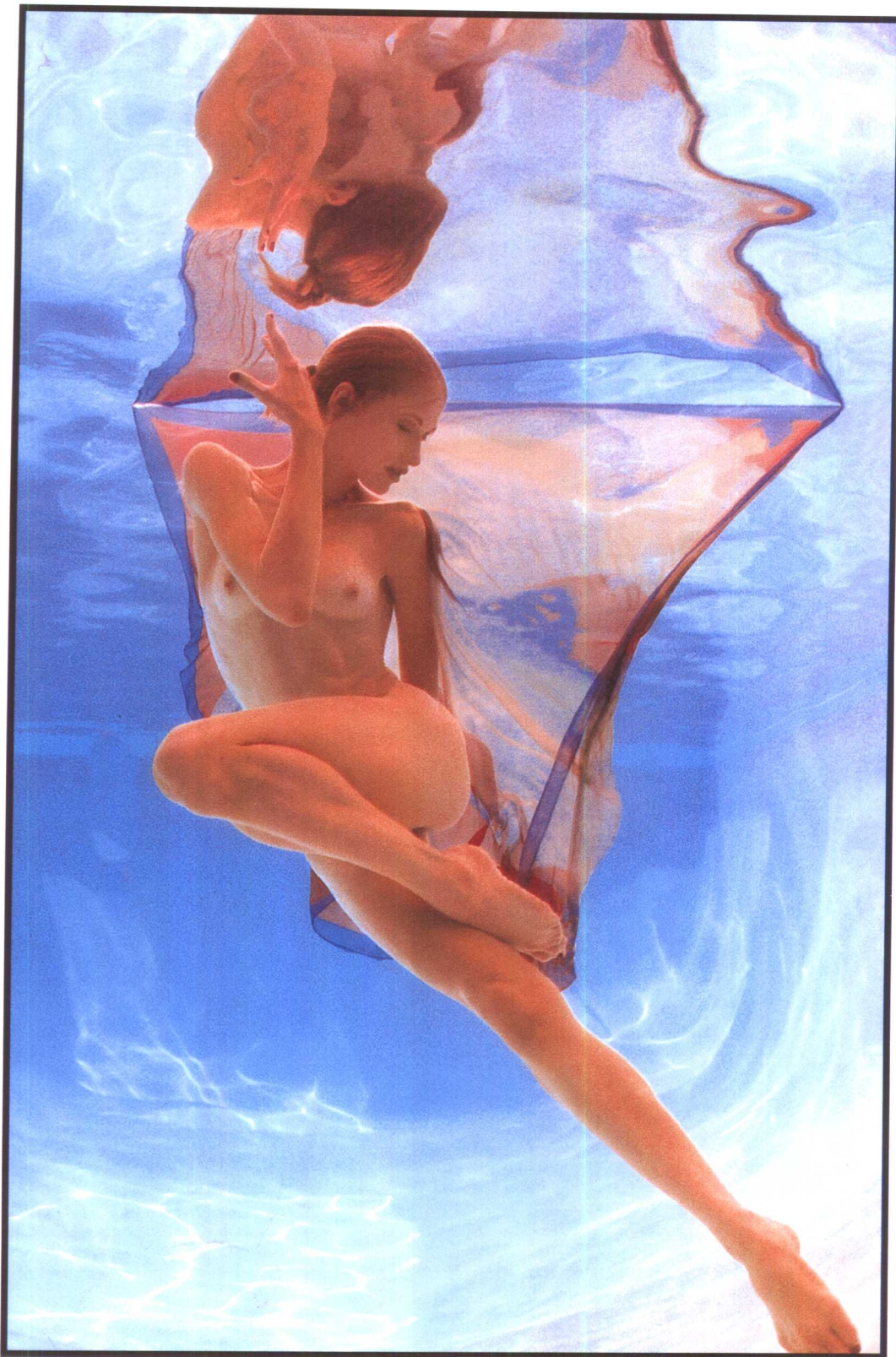
舞蹈天使 霍华德·沙茨(美)

这些水下舞蹈照片，都是霍华德·沙茨在他朋友家游泳池的深水区拍得的。舞蹈演员下水前都要练一下舞姿，还要学会屏住呼吸30秒钟，并能在水下把双眼睁开……作为摄影师来说，在水下则要保持身体的相对稳定，为此他必须在腰间套上沉重的铁腰带。为了使双眼能看清水下的景物，还要戴上一副防水眼镜。