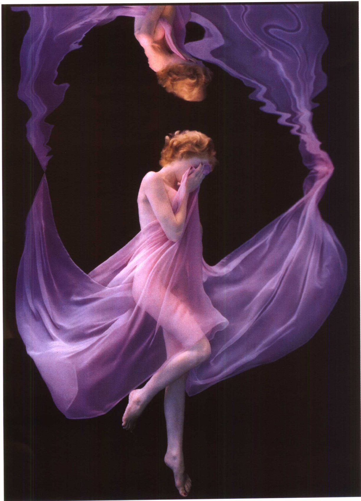
紫罗兰的梦 霍华德·沙茨(美)

摄影师沙茨在水下摄影时,采用专门的防水相机,上面装置有防水闪光灯。摄影师与演员在水上对镜头、动作、表演全都商定后,双方一齐深深吸一口气,沉到水下,由演员做舞蹈动作,进行拍摄。