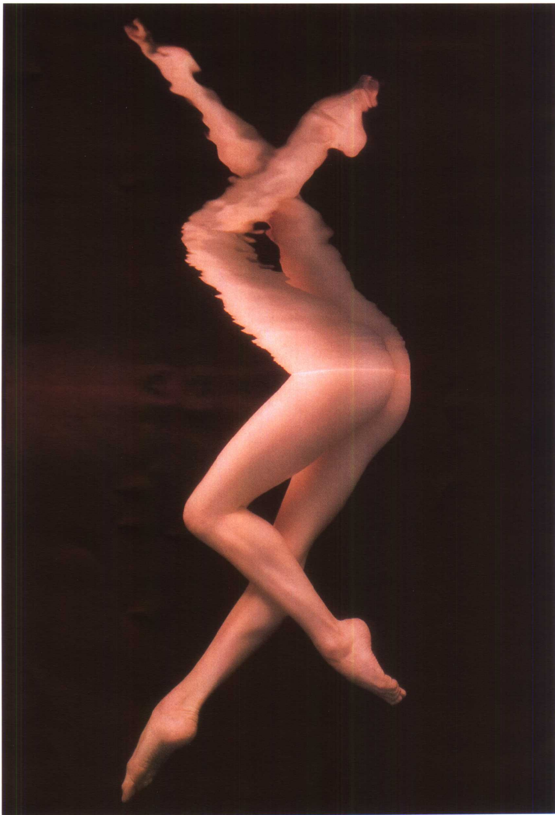
腿的造型 霍华德·沙茨(美)

美国摄影家霍华德·沙茨花费了好几年的时间，跟纽约、旧金山等地的芭蕾舞团、舞蹈学院的演员们和学生们密切合作，经过双方艰苦的努力，拍摄出了许多前所未有的优美镜头。这幅作品由于水面上有光，而水面之下没有任何灯光，那么水面上的双腿就会在水中呈现出清晰的倒影。请把这个画面倒过来看，就能看出一点拍摄时的奥妙。作品发表时，就是倒影朝上，这就产生奇异的感觉。