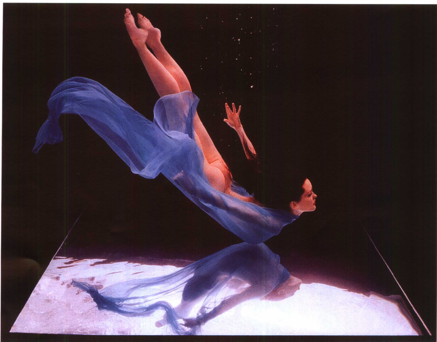
倒影 霍华德·沙茨(美)

舞蹈教练们经常要求演员们的舞姿要柔美、轻盈得像一根羽毛。这位女演员，沉入水中，静静浮起，似乎已失去重量。纱衣在水中随着水的波动轻轻摇曳，呈现仙女下凡之感，水底的明镜，给现场拍摄提出了复杂的技术要求。