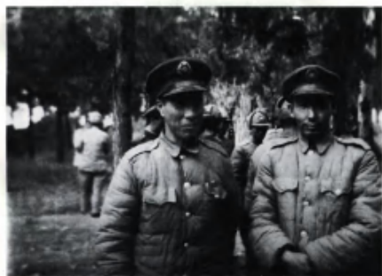
率部起义的何基沣（左）、张克侠将军。