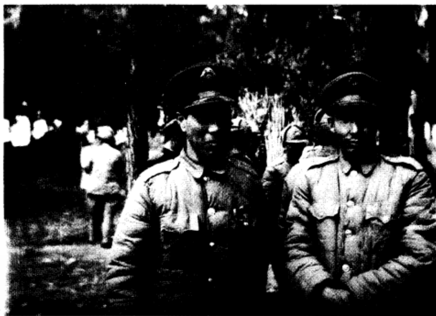
率部起义的何基沣（左）、张克侠将军。