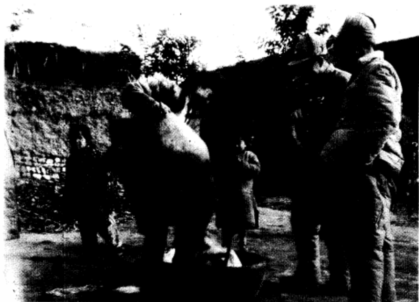
解放区群众欢迎、慰问第3绥靖区起义部队。