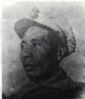
双堆集起义主要领导人、原 国民党军第110师师长廖运周。