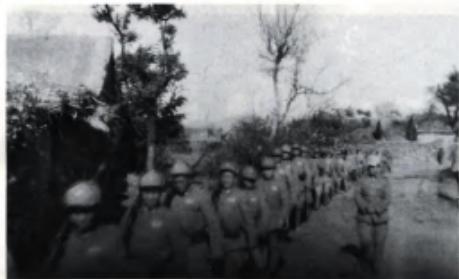
1948年11月8日，何基沣、张克侠率国民党军第3绥靖区2个半师2.3万余人在江苏徐州东北的贾汪地区起义。图为起义部队开赴解放区。