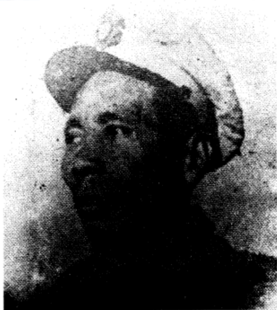
双堆集起义主要领导人、原 国民党军第110师师长廖运周。