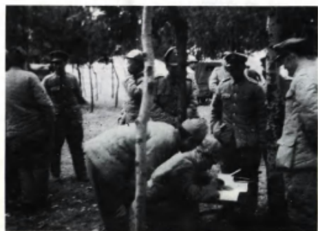
国民党军第3绥靖区起义部队领导人签署起义通电。