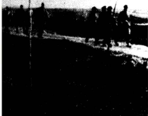
率国民党军第110师5000余人在 义。图为起义部队开赴解放区。