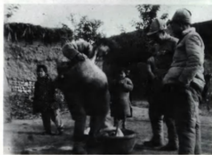
解放区群众欢迎、慰问第3绥靖区起义部队。