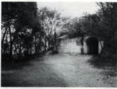
江阴要塞起义指挥部——黄山炮台掩蔽部。