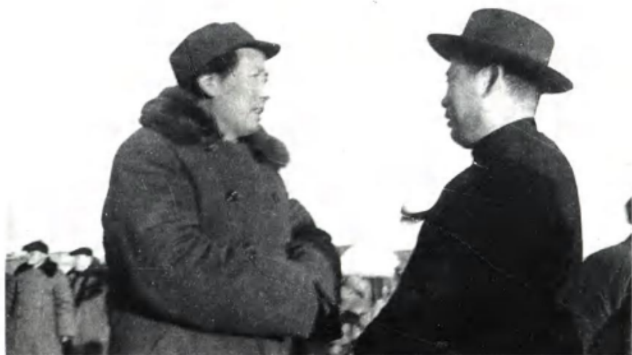
1949年3月25日，中共中央主席毛泽东同率部起义的原国民党军华北“剿总”总司令傅作义（左2）在北平西苑机场交谈。