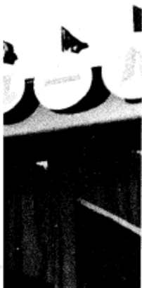
1949年9月19日，国民党政府绥远省主席兼华北“剿总”驻绥远部队指挥官董其武，率绥远国民党军政人员6万余人起义。图为董其武在庆祝绥远“九一九”起义一周年大会上讲话。