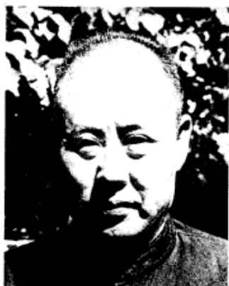
1949年1月率部在北平接受和平改编的原国民党军华北“剿总”总司令傅作义。