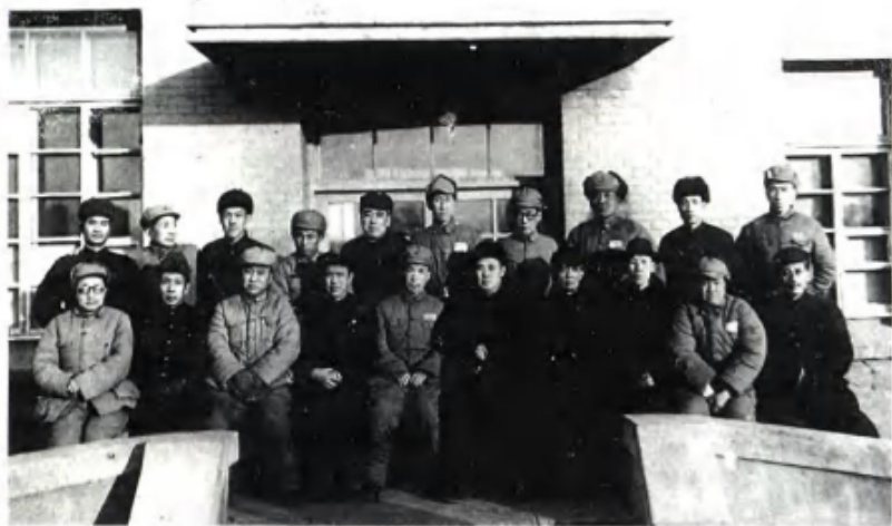
1949年12月，绥远军政委员会主席傅作义（左6），副主席高克林（左5）、乌兰夫（左4）、董其武（左3）、孙兰峰（左7）同全体委员就职时合影。