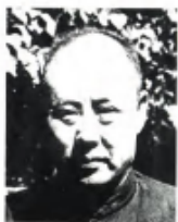
1949年1月率部在北平接受和平改编的原国民党军华北“剿总”总司令傅作义。