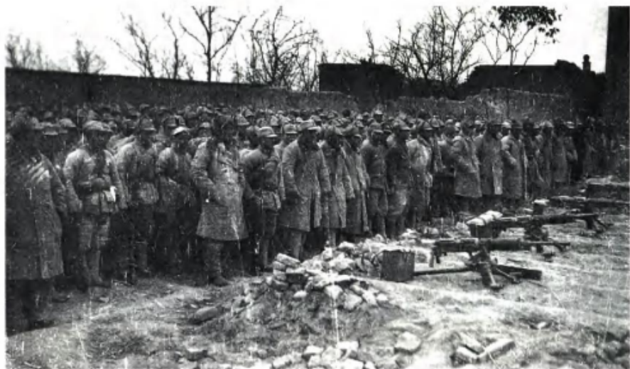
在太原前线起义的原国民党军阎锡山部队第8总队部分官兵。