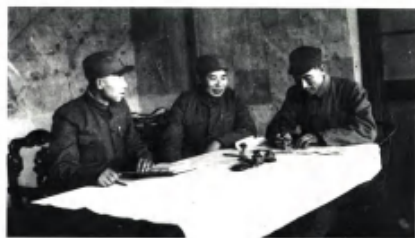
杨得志（左2）、耿飏（左1）欢迎起义的原国民党军第9兵团副司令葛晏春任人民解放军第19兵团（原华北第2兵团）副司令员。