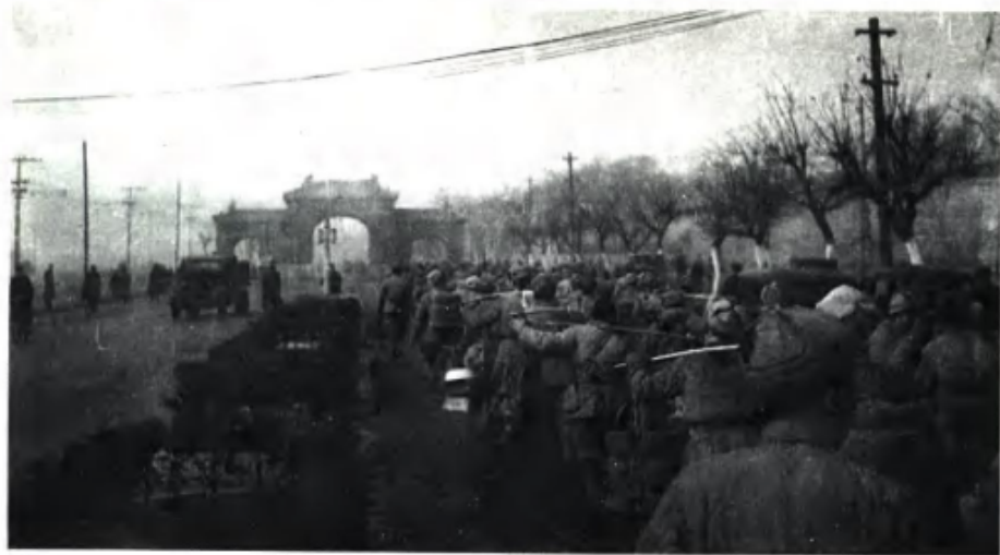
从1949年1月26日起，接受和平改编的北平城内的20余万国民党军官兵，以师为单位开赴指定地点听候改编，到31日即全部开出城外。图为国民党军开出北平城的情景。