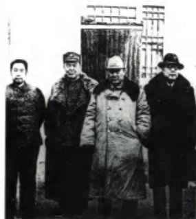
1949年2月23日，周恩来同傅作义（左3）、邓宝珊（左2）、颜连卿（左4）在西柏坡合影。