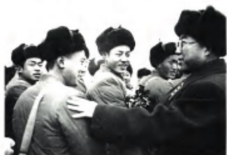
董其武起义后，曾任人民解放军第23兵团司令员，中央军委授予上将军衔。图为董其武欢迎新战士入伍。