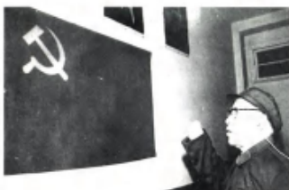
1982年12月，董其武加入了中国共产党。图为他在党旗下宣誓。