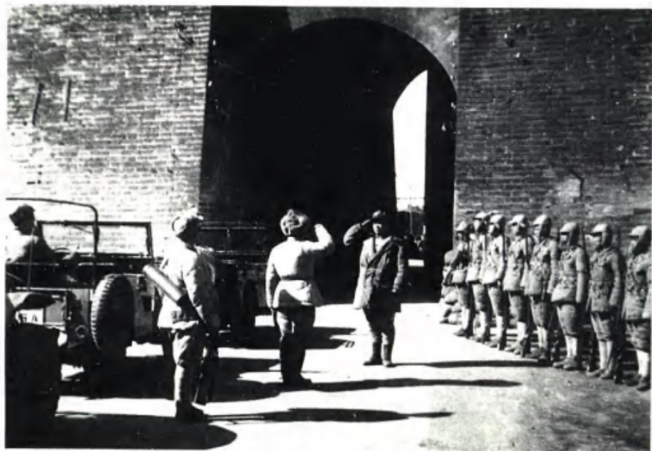
1949年1月31日，人民解放军开进北平朝阳门，傅作义部队正列队移交城防。