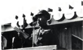
1949年9月19日，国民党政府绥远省主席兼华北“剿总”驻绥远部队指挥官董其武，率绥远国民党军政人员6万余人起义。图为董其武在庆祝绥远“九一九”起义一周年大会上讲话。