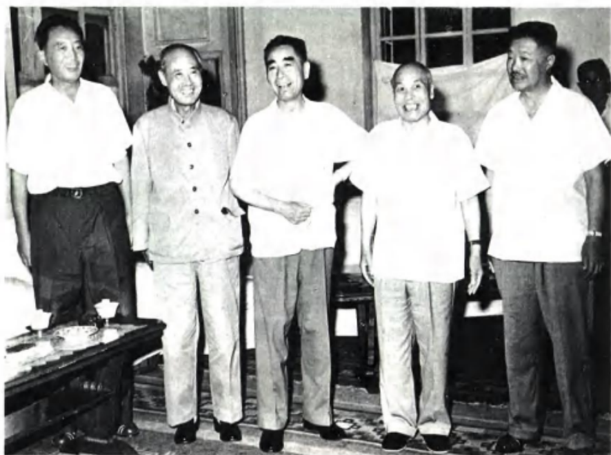
1965年8月17日，周恩来同贺龙（左5）、罗瑞卿（左1）、傅作义（左2）会见从海外归来的原国民党政府代总统李宗仁（左4）。