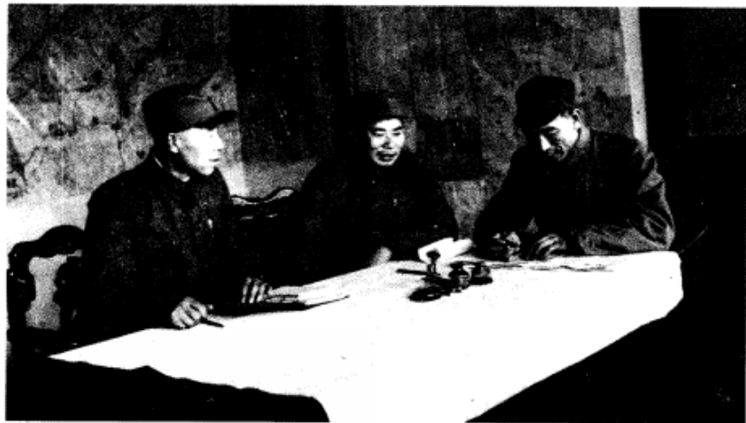
杨得志（左2）、耿飏（左1）欢迎起义的原国民党军第9兵团副司令葛晏春任人民解放军第19兵团（原华北第2兵团）副司令员。