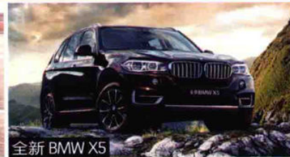
全新 BMW X5