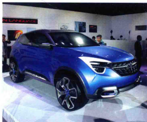
大灯采用立体式设计