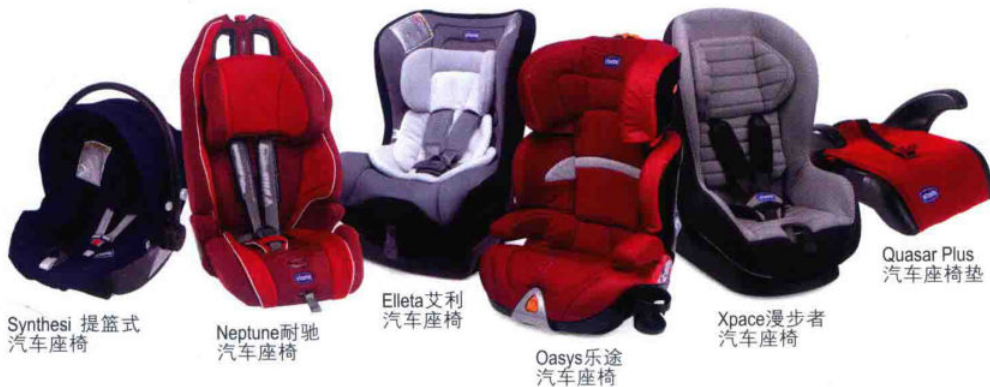
Synthesi 提篮式 汽车座椅

严格符合安全标准和测试，所有chicco儿童安全座椅均符合欧盟ECE R44/04标准，锁扣和安全带的耐磨性、抗腐蚀性试验、撞击试验。智高车椅产品的测试在权威的荷兰认证机构，(Dutch Certification Institute) TNO (荷兰应用科学研究组织)完成。