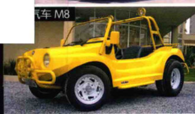
路虎 汽车 M8