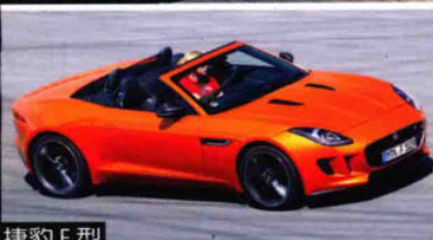
捷豹 F 型