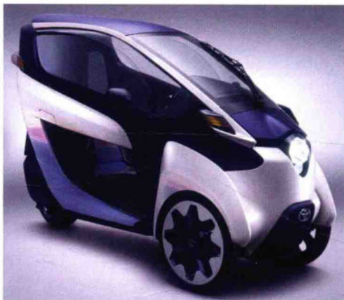
有客舱的双座摩托车 i-Road

丰田在日内瓦国际车展上推出的三轮 i-Road 是摩托车和汽车的混合体。乘客一前一后坐在长 2.35 米、宽度只有 85 厘米的车厢中，有玻璃车顶可遮风挡雨。由于转弯直径只有 3 米，它在城市中行驶操控很灵便。两只前轮上功率均为 2 千瓦的轮边电动机负责驱动。在一块锂离子蓄电池的配合下，电动续航里程约 50 千米。