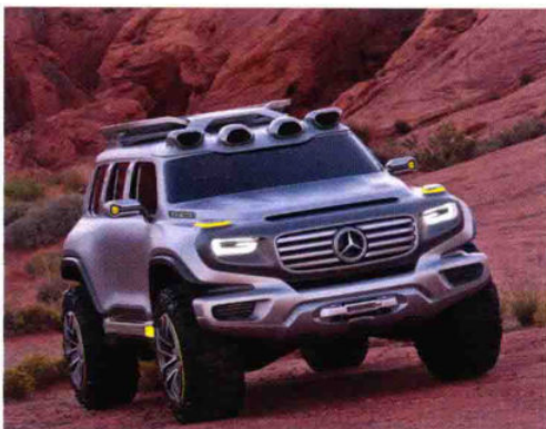
粗犷的外观：梅赛德斯—奔驰样品车