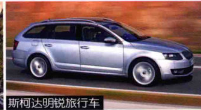
斯柯达明锐旅行车