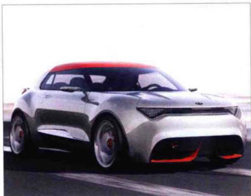
具动感外形的小型概念车普罗沃

在日内瓦国际车展推出的普罗沃 (Provo) 极具动感。这款长 3.88 米、宽 1.77 米的车型拥有设计感很强的车轮, 前护板上有粗大的进气孔和很窄的 LED 带状前照灯。这款双门车的挡风玻璃绕过 A 柱天衣无缝地延续到侧窗中。起亚在这款车上也采用了混合动力方案。一台 1.6 升涡轮增压发动机 (204 马力) 同后桥上的一台 33 千瓦电动机协作。负责传动的是一台七挡双离合变速器。