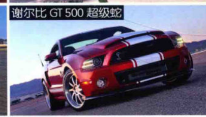
谢尔比 GT 500 超级蛇