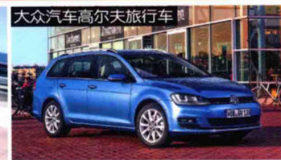
大众汽车高尔夫旅行车