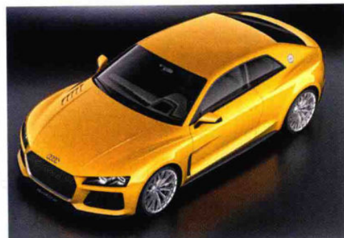
奥迪 Sport quattro 一览

为纪念 Sport quattro 诞生 30 周年, 奥迪在法兰克福国际车展上推出了它的法定后继车型。这款长 4.60 米的轿跑车高 1.39 米, 车身异常低平, 以奥迪 A6 平台为基础设计。短的前后悬、和谐的比例和巨大的 21 英寸车轮传达的是动力方案所强调的动感印象: 800 牛·米的插电式混合动力系统由一台 4.0 升 V8 双涡轮增压发动机 (560 马力) 和一台 110 千瓦电动机组成, 系统总功率达 680 马力。纯电动续航里程约 50 千米。