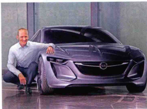
欧宝总裁诺伊曼在蒙扎旁边