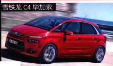
雪铁龙 C4 毕加索