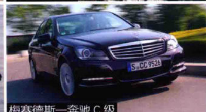
梅赛德斯-奔驰 C 级