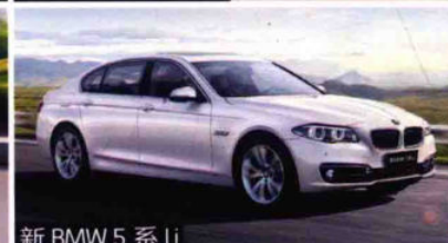
新 BMW 5 系 Li