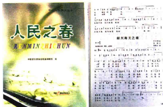
由陈钢作词的《绍兴海关之歌》由中国广播电视出版社公开发行