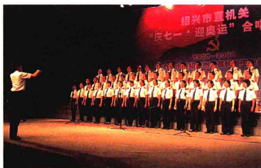
获绍兴市直机关“庆七一、迎奥运”合唱比赛二等奖