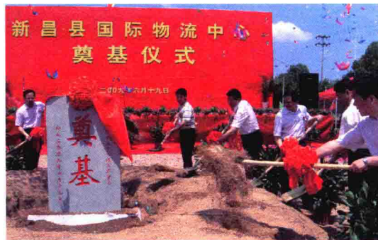
2010年6月，新昌县国际物流中心海关监管点奠基仪式