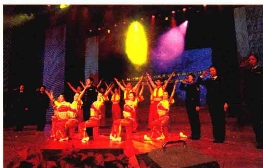
《绍兴海关绍兴情》在关区新春联欢会上精彩演出