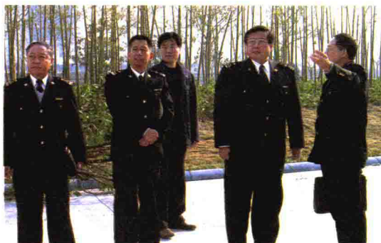
2005年12月，杭州海关原关长张志南（右二）到绍兴海关指导工作