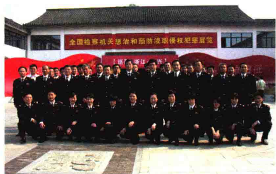
参观惩治和预防渎职侵权犯罪展览