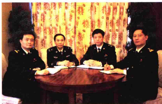
绍兴海关党组班子