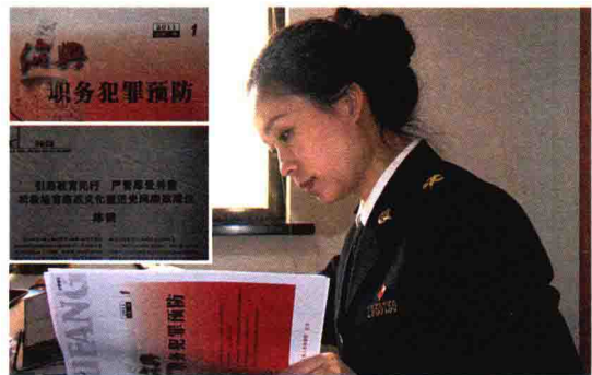
廉政建设经验介绍文章被《绍兴预防职务犯罪》刊载