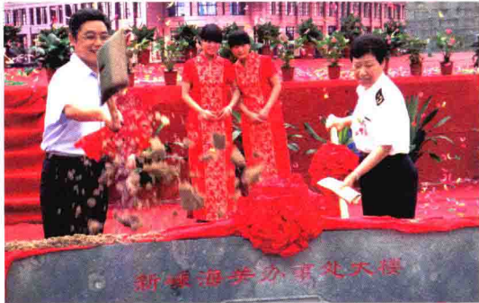
2010年6月，新嵊办事处（筹）大楼奠基仪式