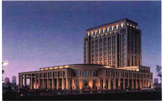
绍兴海关驻新嵊办事处（筹）大楼效果图