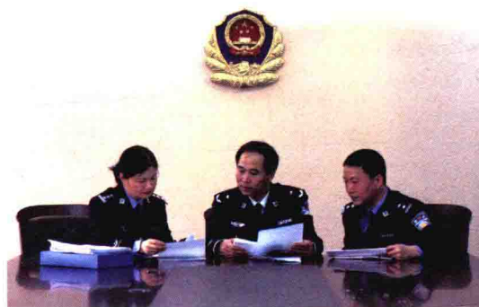
分局领导研究工作