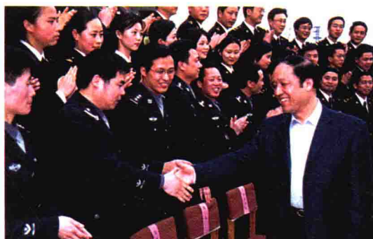
2003年4月，海关总署原署长牟新生视察绍兴海关