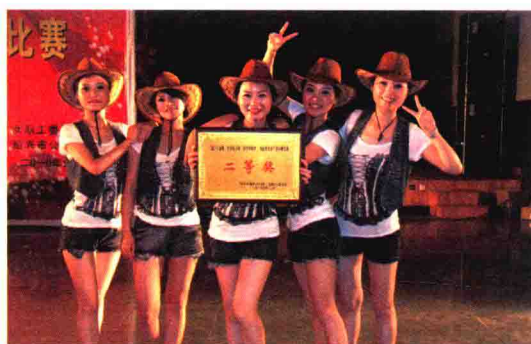
获绍兴市直机关女职工排舞比赛二等奖