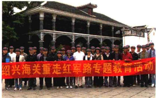
革命传统主题教育