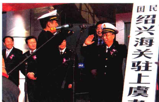
2005年11月，上虞办事处开关仪式