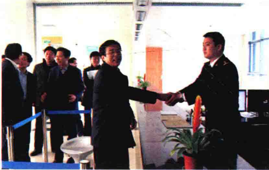
2011年3月，绍兴市委书记张金如看望海关关员