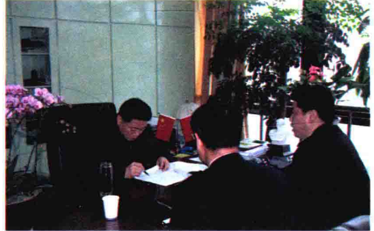
2009年3月，绍兴市市长钱建民听取绍兴海关工作汇报