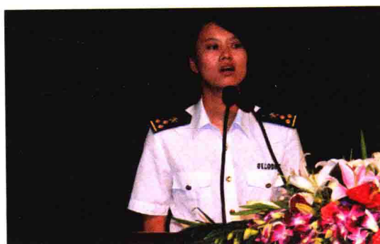
开展“说身边的人，讲身边的事”演讲比赛