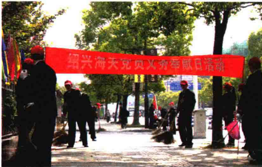
党员义务奉献日活动