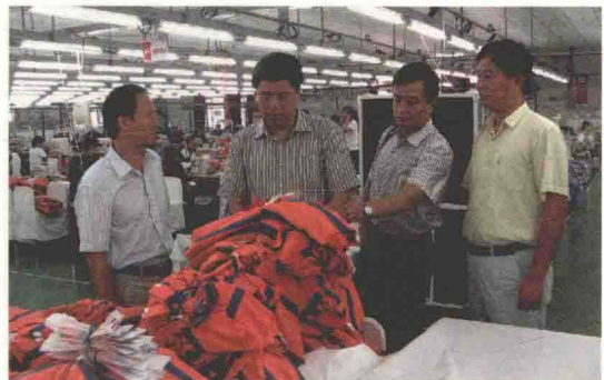
关领导走访调研辖区进出口企业