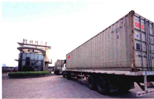
绍兴国际物流中心海关监管点