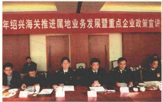
开展推进属地业务发展暨重点企业政策宣讲会