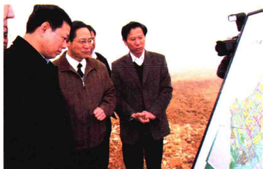
2008年12月，海关总署副署长鲁培军（左一）视察绍兴海关