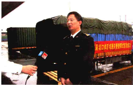
关区首票与深圳海关“区域通关”货物顺利放行