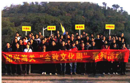
开展“金秋文化周”系列活动