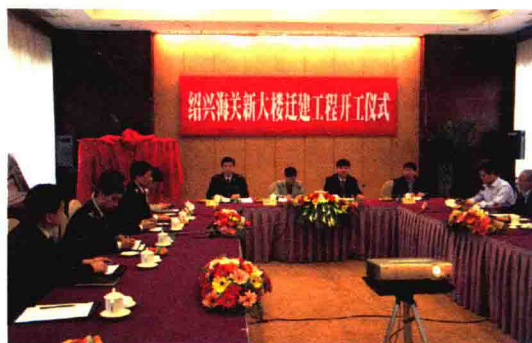
2011年4月，绍兴海关新大楼迁建工程开工仪式