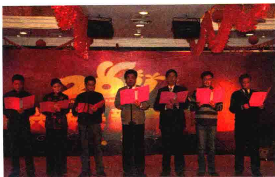
关局领导表演诗朗诵