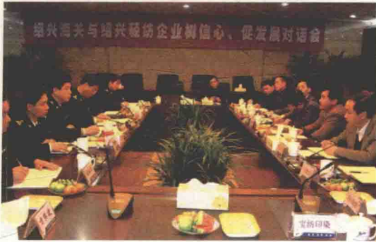
召开与绍兴轻纺企业“树信心、促发展”对话会