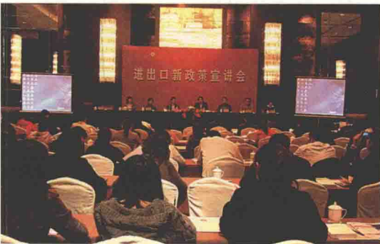
举办海关业务培训