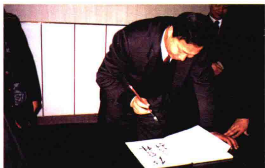
1994年1月，海关总署原署长钱冠林视察绍兴海关时为绍兴海关题词