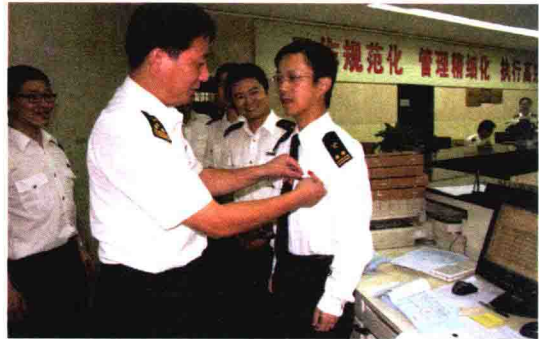
统一佩戴党徽上岗