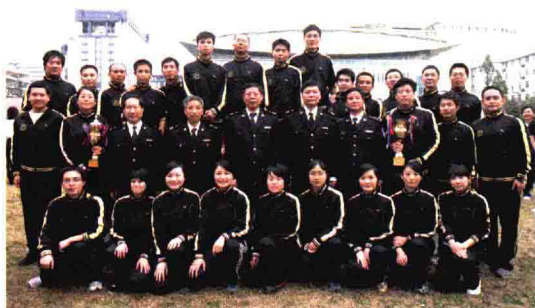
勇夺杭州海关建关30周年运动会团体第二名