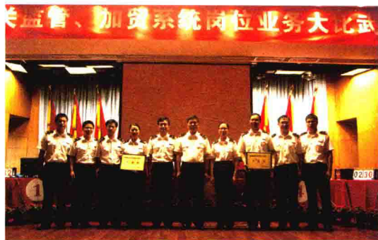
在关区监管、加贸岗位业务大比武中双双获奖