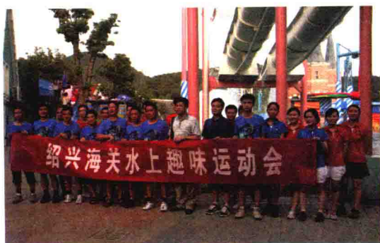
开展水上趣味运动会