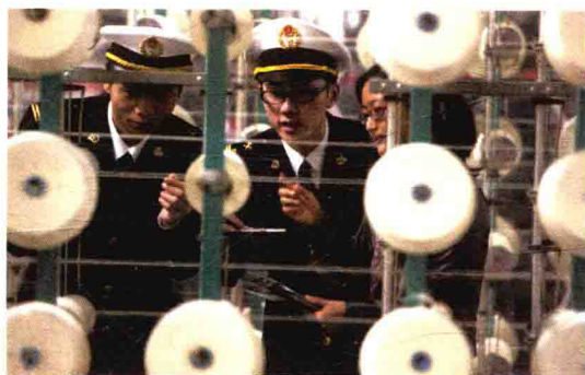
认真查验一丝不苟