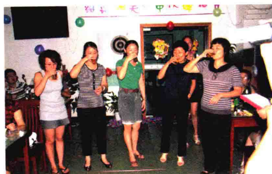
举办“迎中秋“啤酒节”