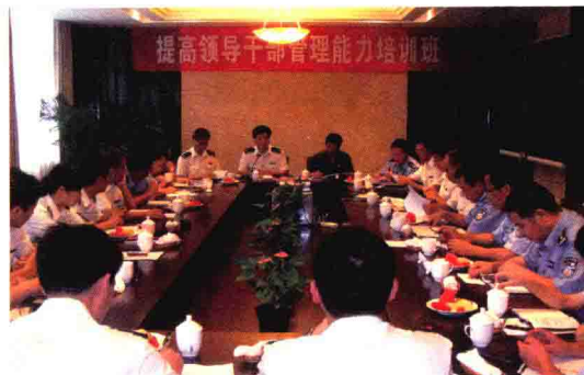
举办提高领导干部管理能力培训班