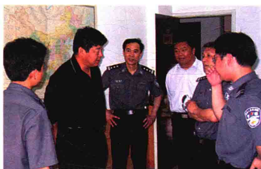
2004年5月，海关总署副署长吕滨（左二）视察绍兴海关缉私分局