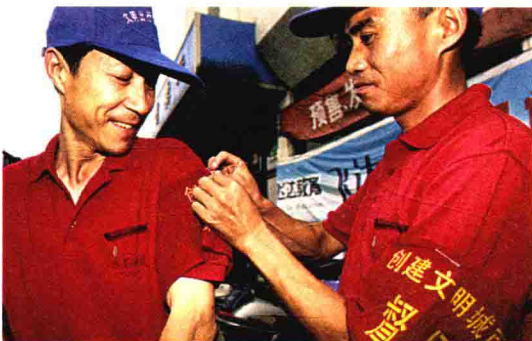
党员参加创建文明城市义务督导活动