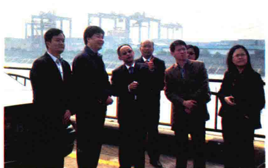
2010年11月，绍兴市副市长何中伟考察绍兴海关通关物流工作