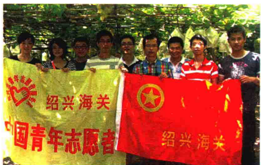
绍兴海关青年志愿者在行动