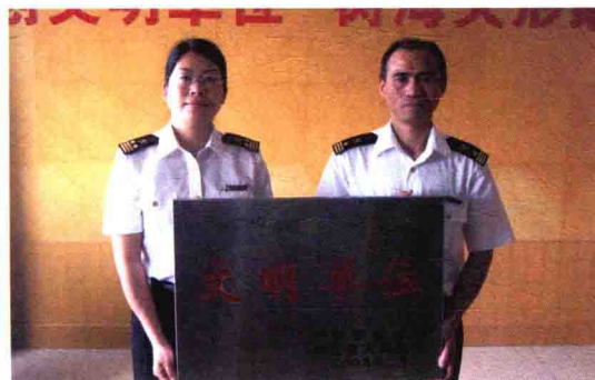
2009年，绍兴海关被评为省级文明单位