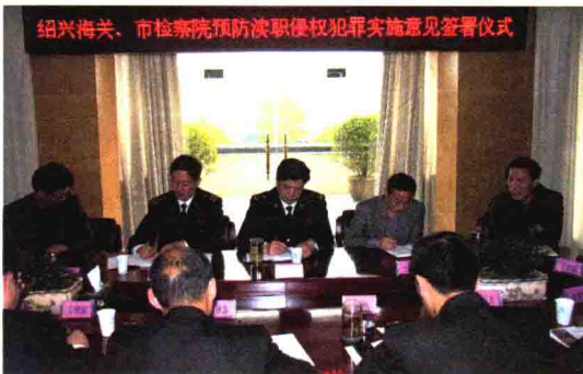
与绍兴市人民检察院签署《关于共同加强预防渎职侵权犯罪工作的实施意见》