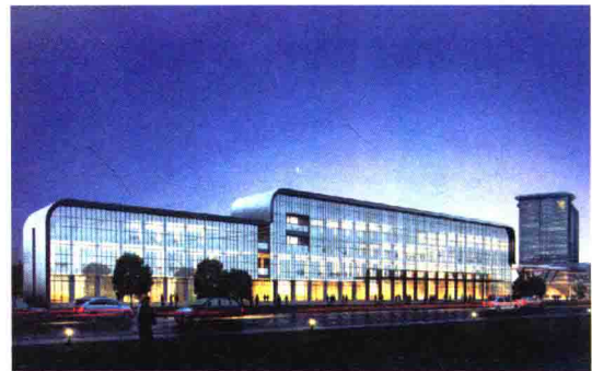
新昌县国际物流中心海关监管点效果图