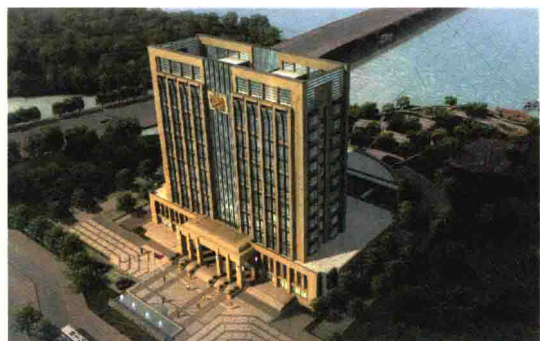
绍兴海关新大楼效果图