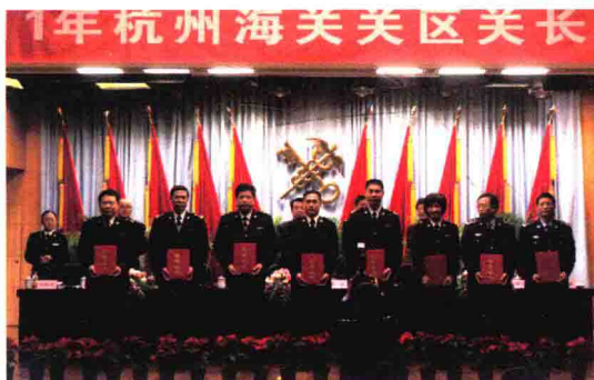
绍兴海关党组被评为2010年度优秀领导班子