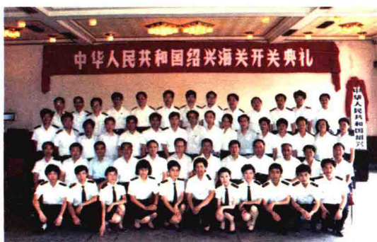
1991年6月26日，绍兴海关开关典礼