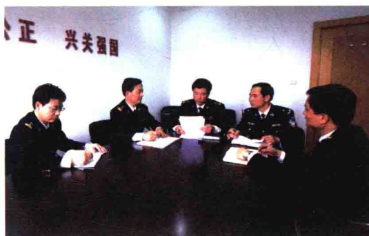
党组中心组学习贯彻两级关长会议精神