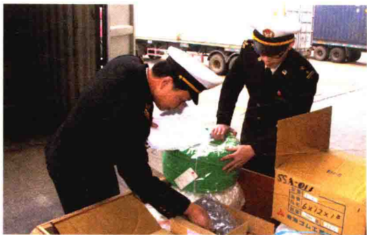
深入企业生产车间调研帮扶