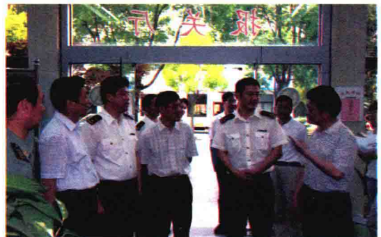
2009年5月，绍兴市人大代表视察绍兴海关