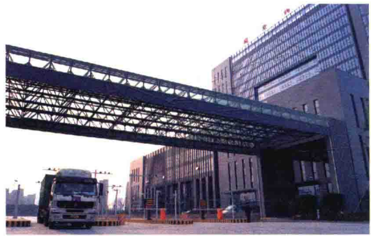
绍兴县中国轻纺城仓储物流中心海关监管点