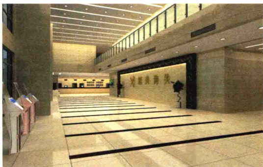
新大楼报关厅效果图