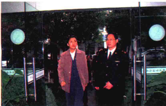
2007年11月，绍兴市纪委书记王文序到绍兴海关指导工作