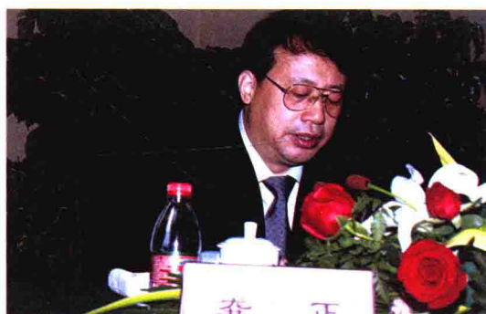
2010年1月，浙江省副省长龚正在绍兴参加杭州海关关区关长会议