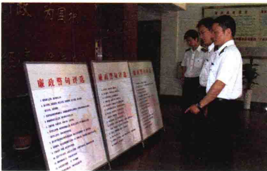
开展廉政警句评选