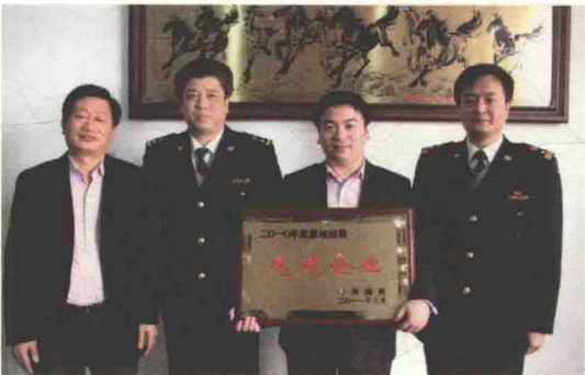
表彰属地纳税先进企业