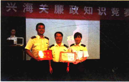
举办廉政知识竞赛