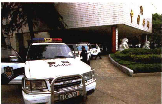
打击走私守卫国门