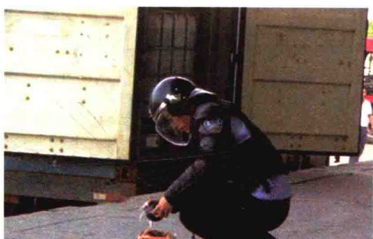
开展奥运安保突发事件应急处置实战演练