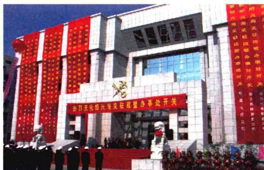
2005年11月，诸暨办事处开关仪式