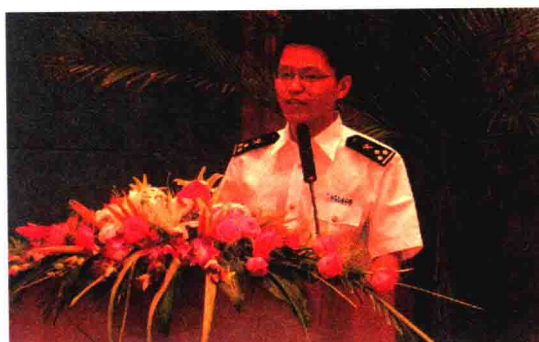
参加关区英语演讲比赛