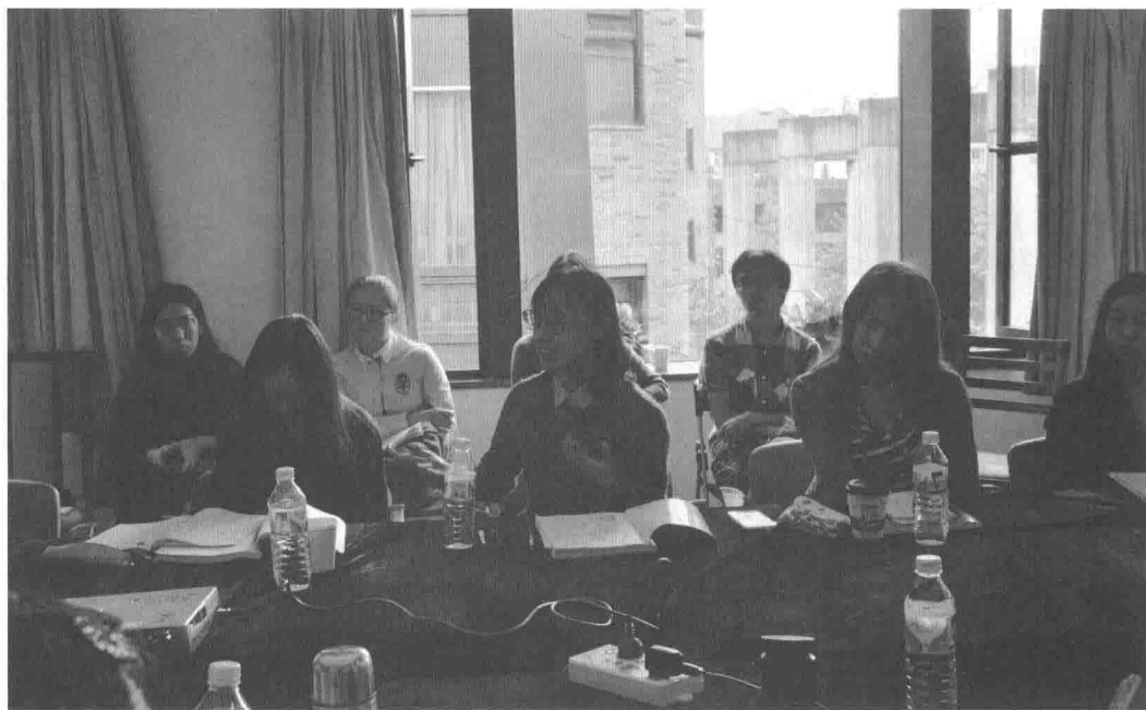
图3 2014年10月杭州秋季研讨班的讨论

话题。在晚期资本主义时代，媒介决定了艺术家类型，而诸如“挪用”（Appropriation）之类的表达方式，成了当代艺术家的重要创作手段，他们创造性地让大众媒介形象重获“文化相关性”（referenced again），同时，又实现了对体制和权力的批判。杰夫·昆斯（Jeff Koons）的目标是控制市场，而不是反对市场。此外，他也提到，60年代以后，美国西海岸，特别是洛杉矶地区的当代艺术变得越来越重要。