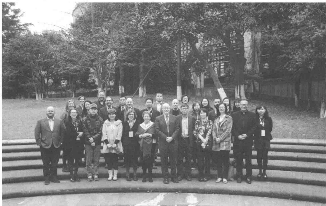
图1 2016年3月杭州国际学术研讨会合影

名度的现当代艺术家，在这个过程中，美国对于中国现当代艺术的发展产生了重要影响，尽管对这种影响的评估在国内学界存在着某些争议。事实上，中国和美国，都属于现代艺术的后来者，在各自国家现代艺术的早期阶段，都经历了一个接受和回应来自欧洲大陆前卫艺术影响，并确立自身的文化身份的过程，只是在上个世纪40—50年代后，两个国家的现代艺术才走上不同道路。在中国，社会主义现实主义成为主导艺术语言，而在美国，抽象表现主义和波普艺