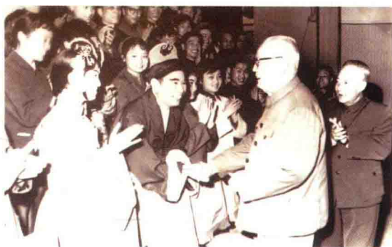
叶剑英同志接见《葛麻》剧组