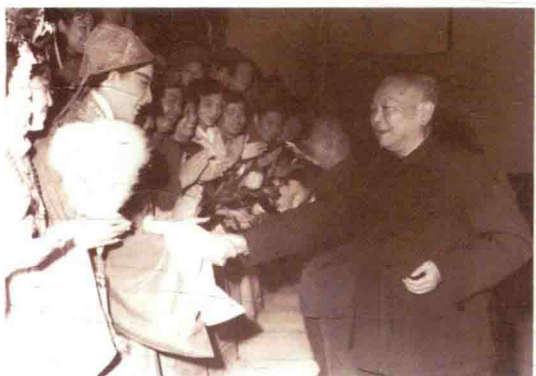
李先念同志接见《站花墙》演员