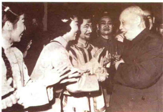
1965年，董必武同志接见《山乡风云》演员