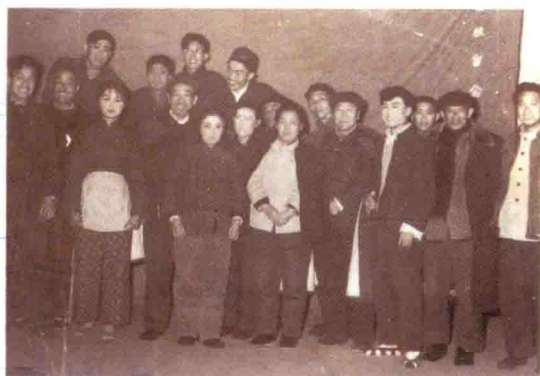
1963年，王任重同志（前排左四）在麻城接见武汉楚剧团深入生活小组