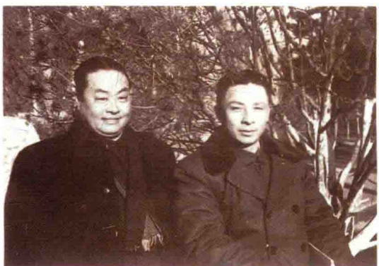
沈云陔（右）与程砚秋合影（1952年）