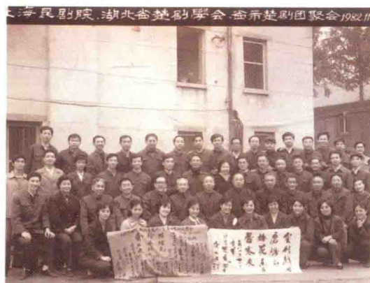
1982年，湖北省楚剧团和武汉市楚剧团部分同志与访汉的上海昆剧团合影