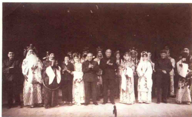
1974年，李先念、陈丕显同志在红安观看红安县楚剧团演出的《唐知县审诰命》后与演员合影