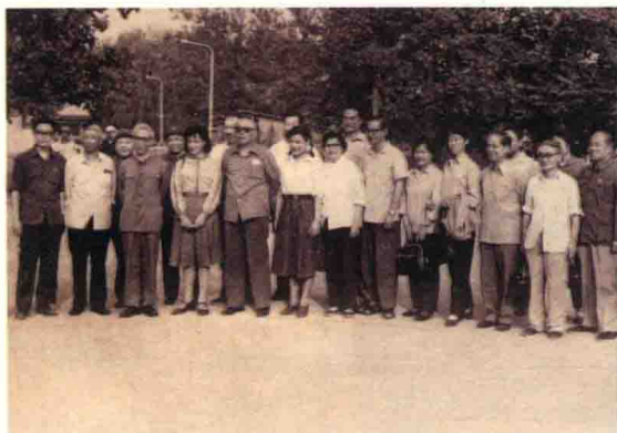
叶永烈（左一）获得第三届电影“百花奖”，与刘晓庆、陈冲等合影