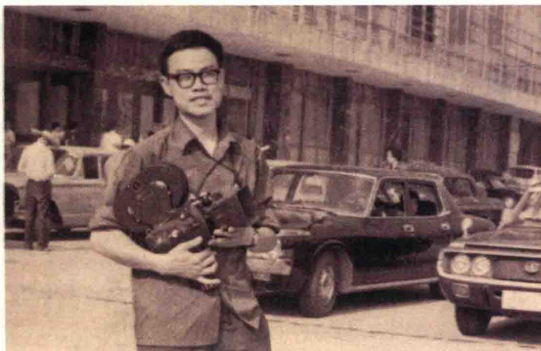
手持电影摄影机的叶永烈在广州