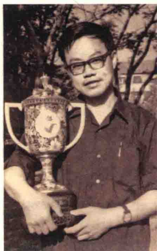
1980年3月，叶永烈导演的《红绿灯下》荣获第三届电影“百花奖”