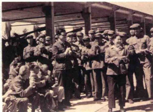
1980年，张瑞芳在北京介绍电影“百花奖”获得者叶永烈