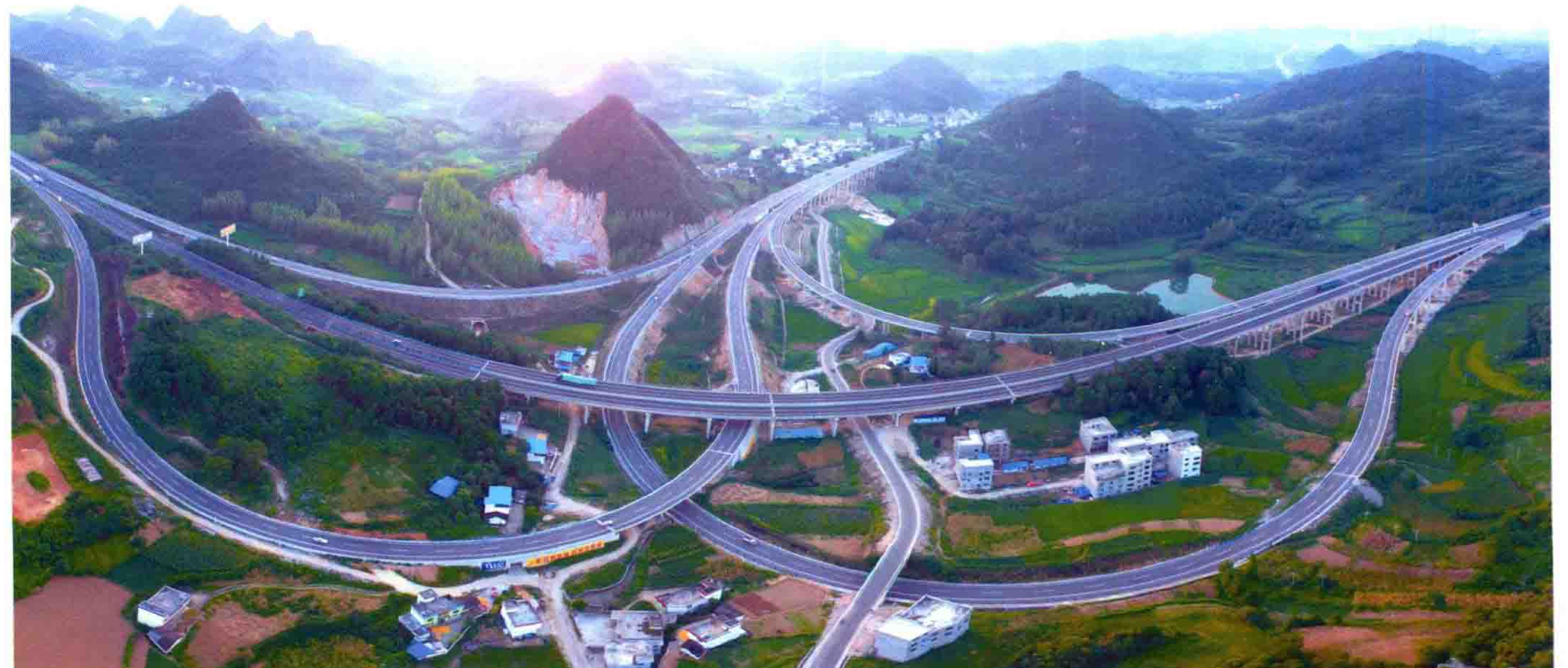
松从高速与杭瑞高速交汇处大兴将军山