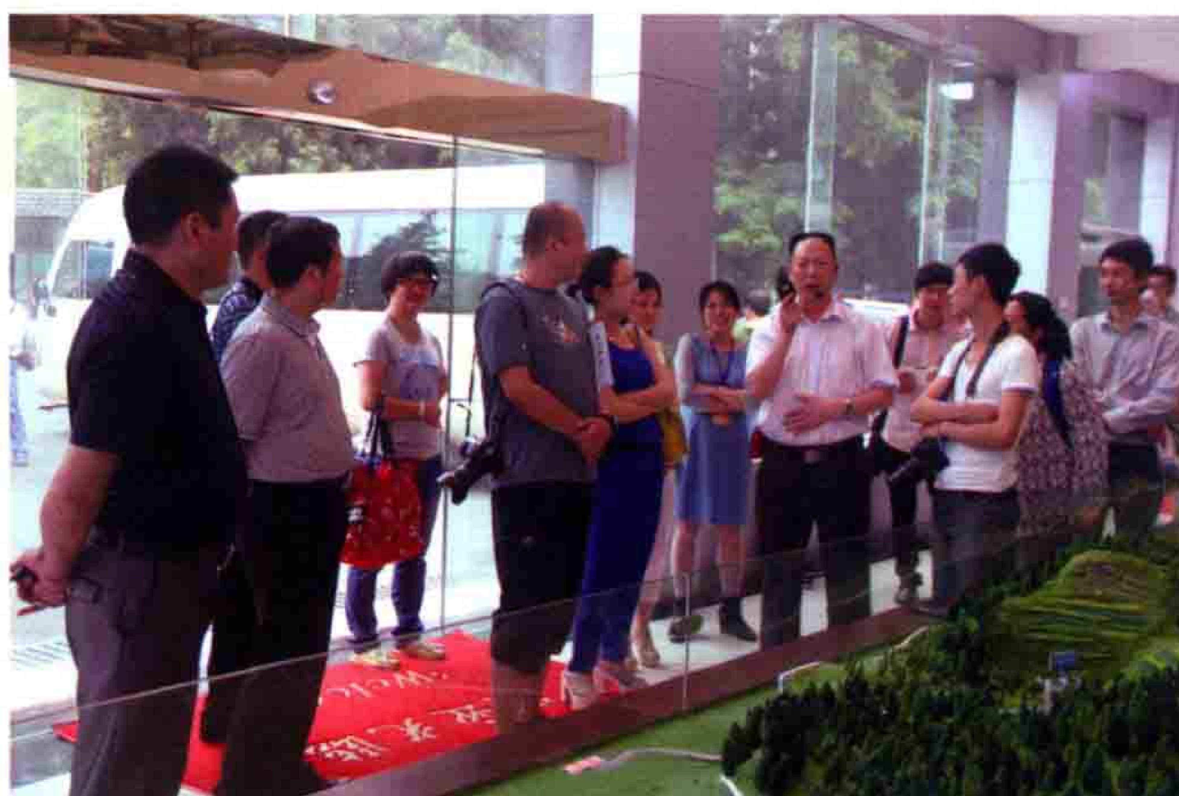
2014年6月8日，《人民日报》报社等17家媒体到盘石园区厅采访