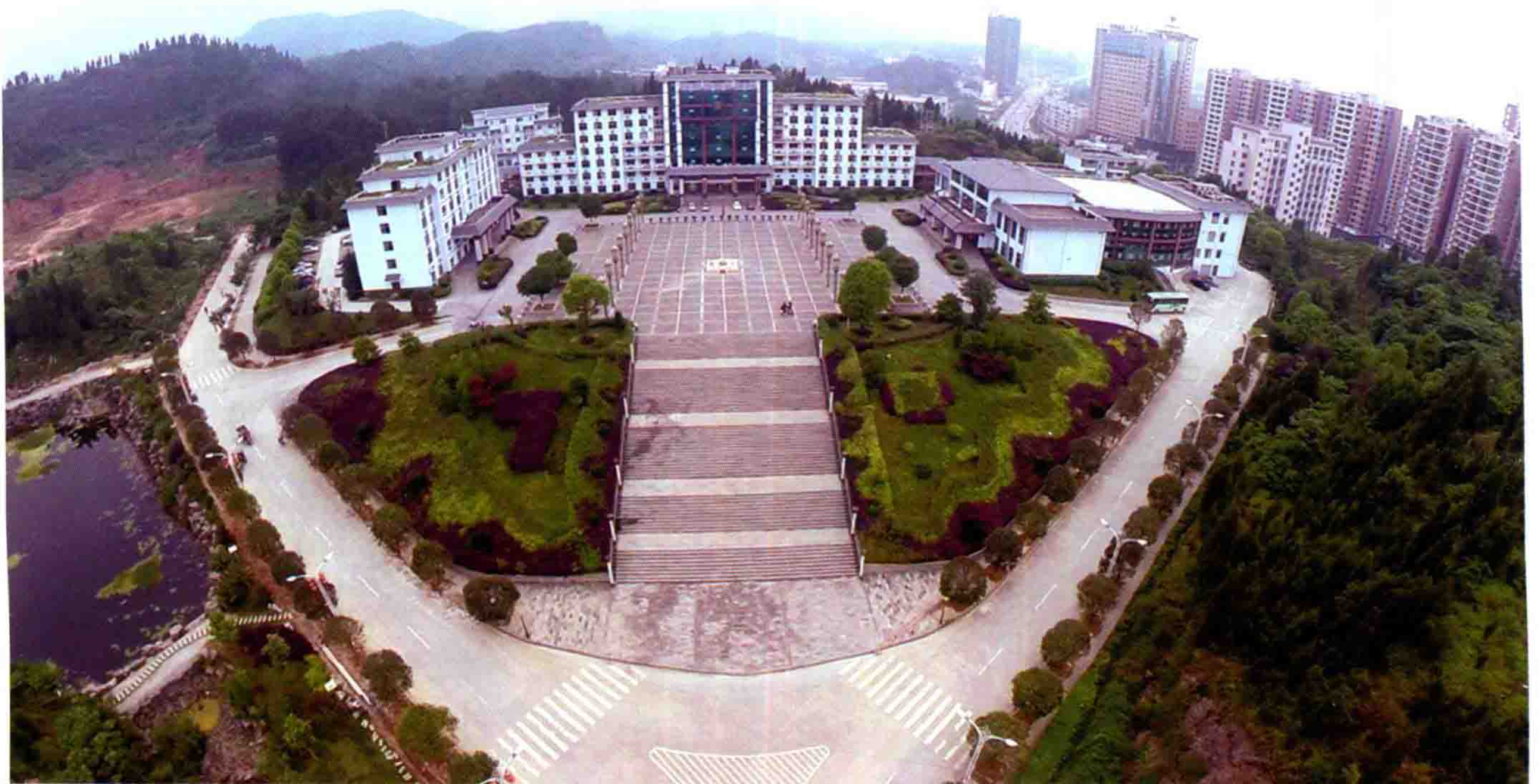
松桃行政中心全貌