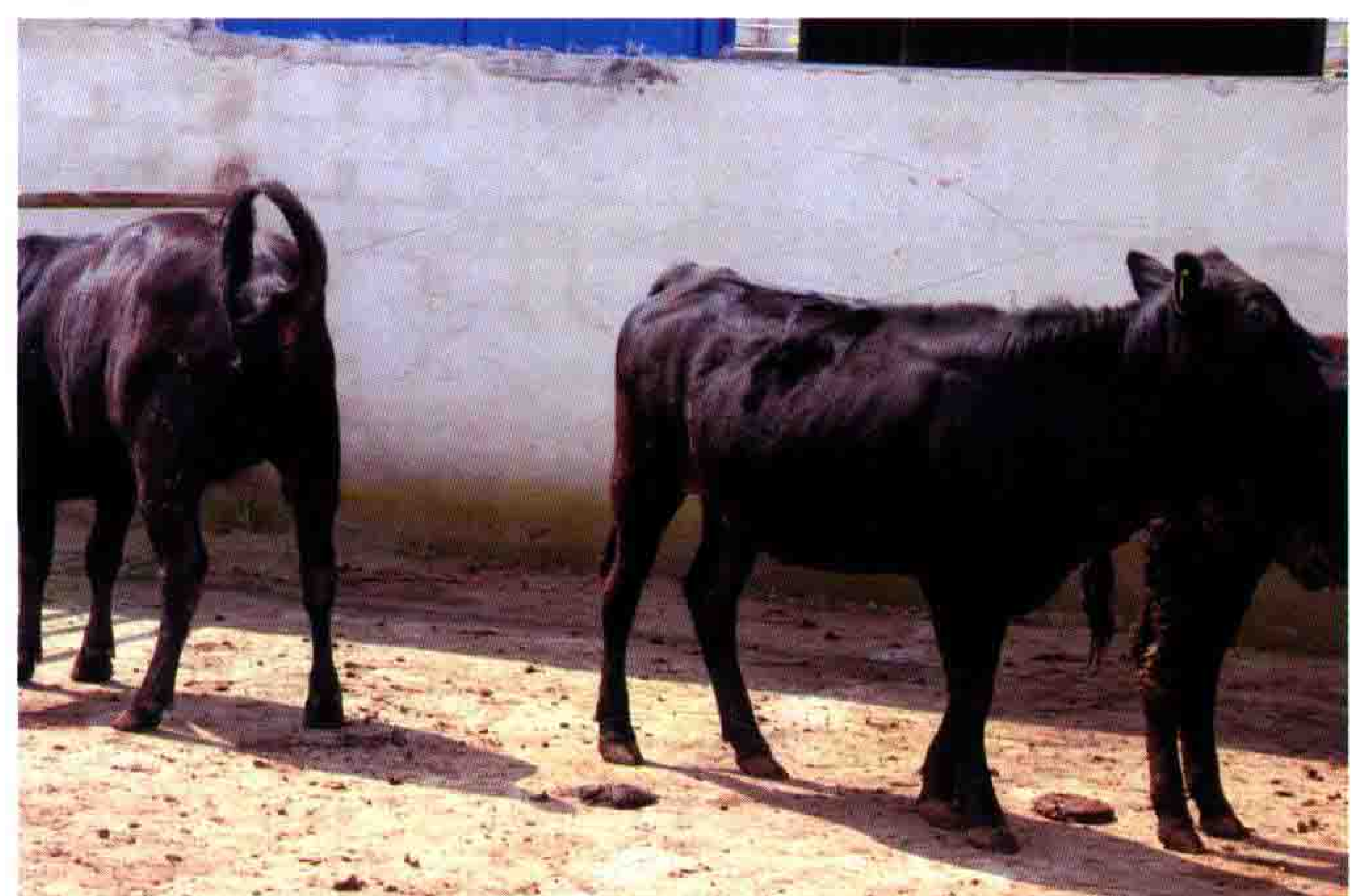
梵净山牧业科技有限公司引进的日本和牛