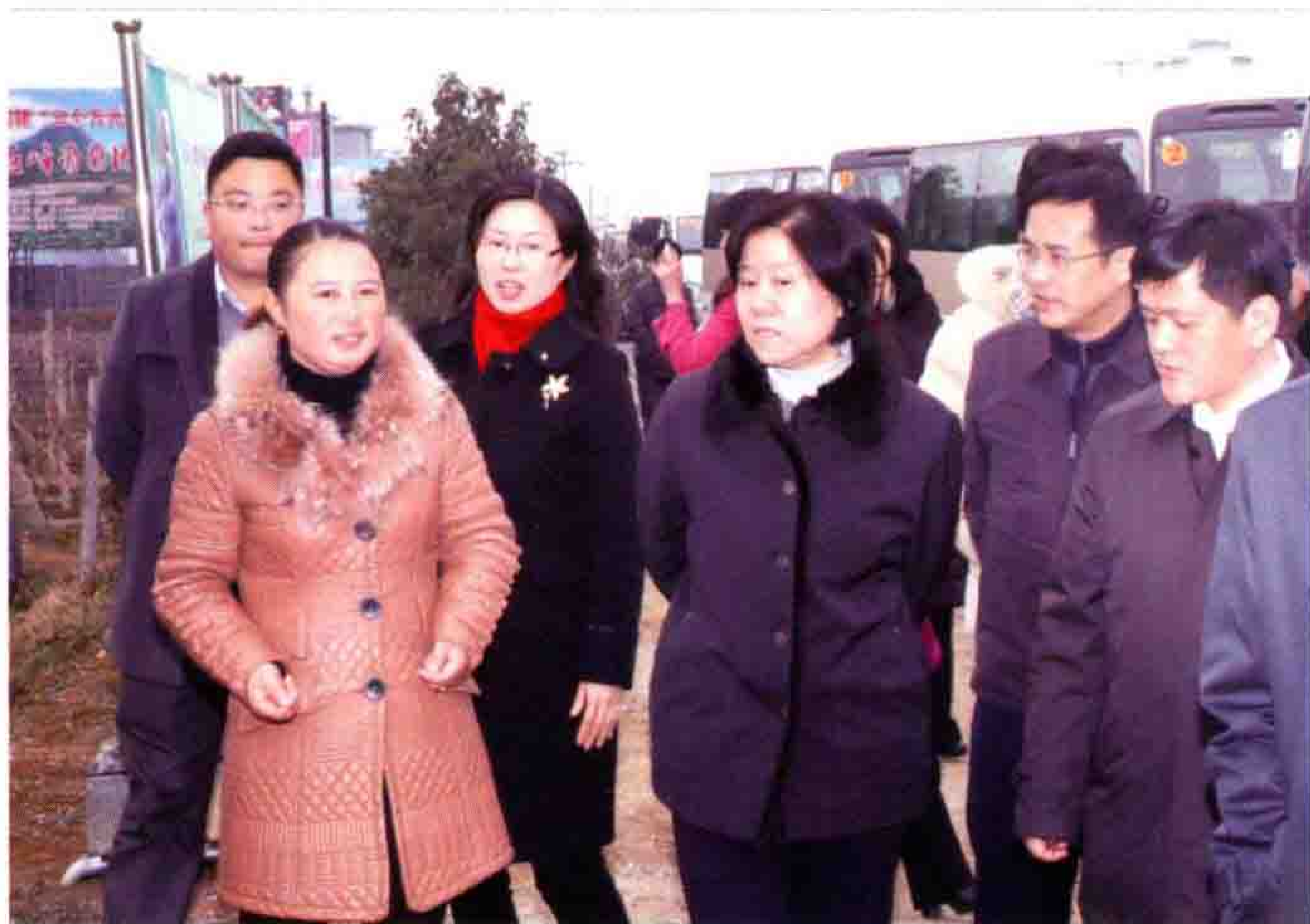
2014年1月8日，全国人大常委会副委员长、全国妇联主席沈跃跃(中)一行赴松桃苗族自治县继梅养殖专业合作社调研

松桃畜牧渔业以全国现代农业示范园区建设以及全省100个现代高效农业示范园区建设为发展机遇，以建成“全国生猪调出大县、贵州努比亚种羊生产基地县、梵净山黑牛生产基地县、松桃黑毛猪繁育基地县”为战略目标，以标准化规模场建设为重点，坚持“因地制宜、突出重点，统筹规划、分类指导”原则，大力发展生猪，突出发展牛羊，积极发展特种及特色水产养殖业。积极培养龙头企业，相继引进全国500强企业华西希望·德康集团、全国100强牧业四川大哥大牧业、省级重点农业龙头企业贵州梵净山牧业、省级重点农业龙头企业康正牧业。