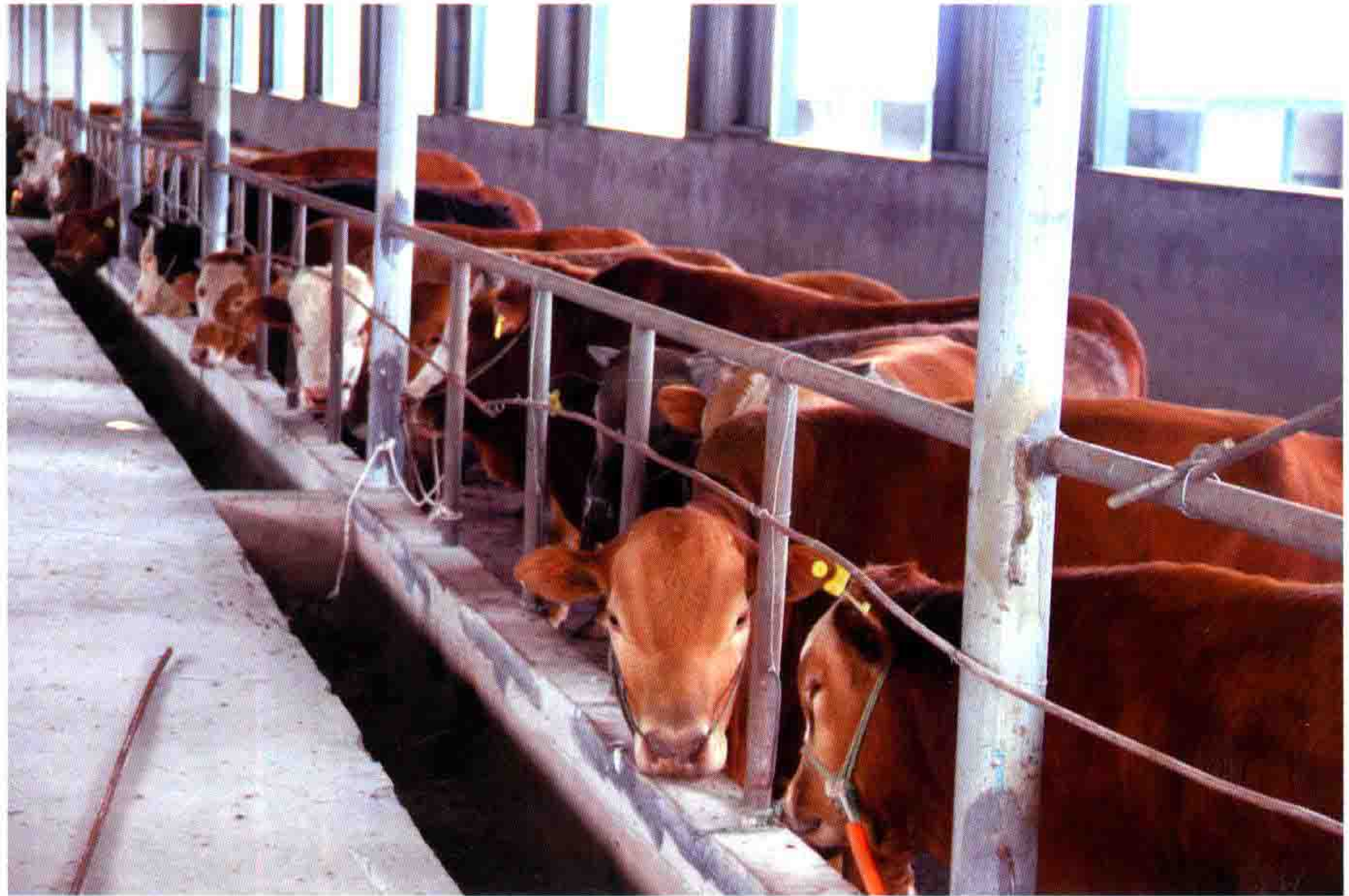
梵净山牧业科技有限公司肉牛养殖场

县畜牧渔业工作获2014年铜仁市首届动物防疫职业技能竞赛团体二等奖；盘石生态畜牧业产业示范园区获2014年全省绩效考评一等奖。