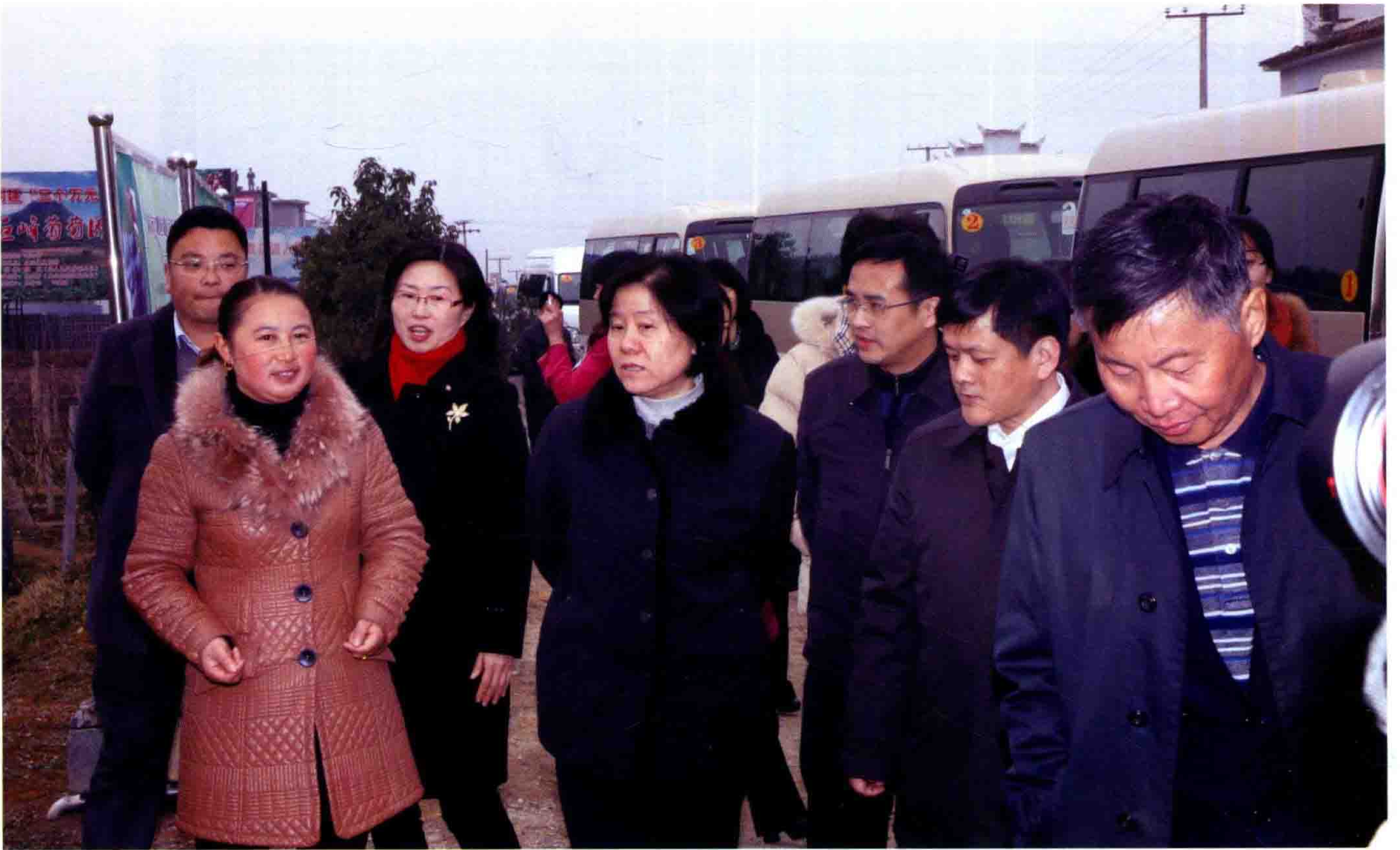
2014年1月8日，全国人大常委会副委员长、全国妇联主席沈跃跃（中）在大兴镇考察“巾帼创业示范基地”