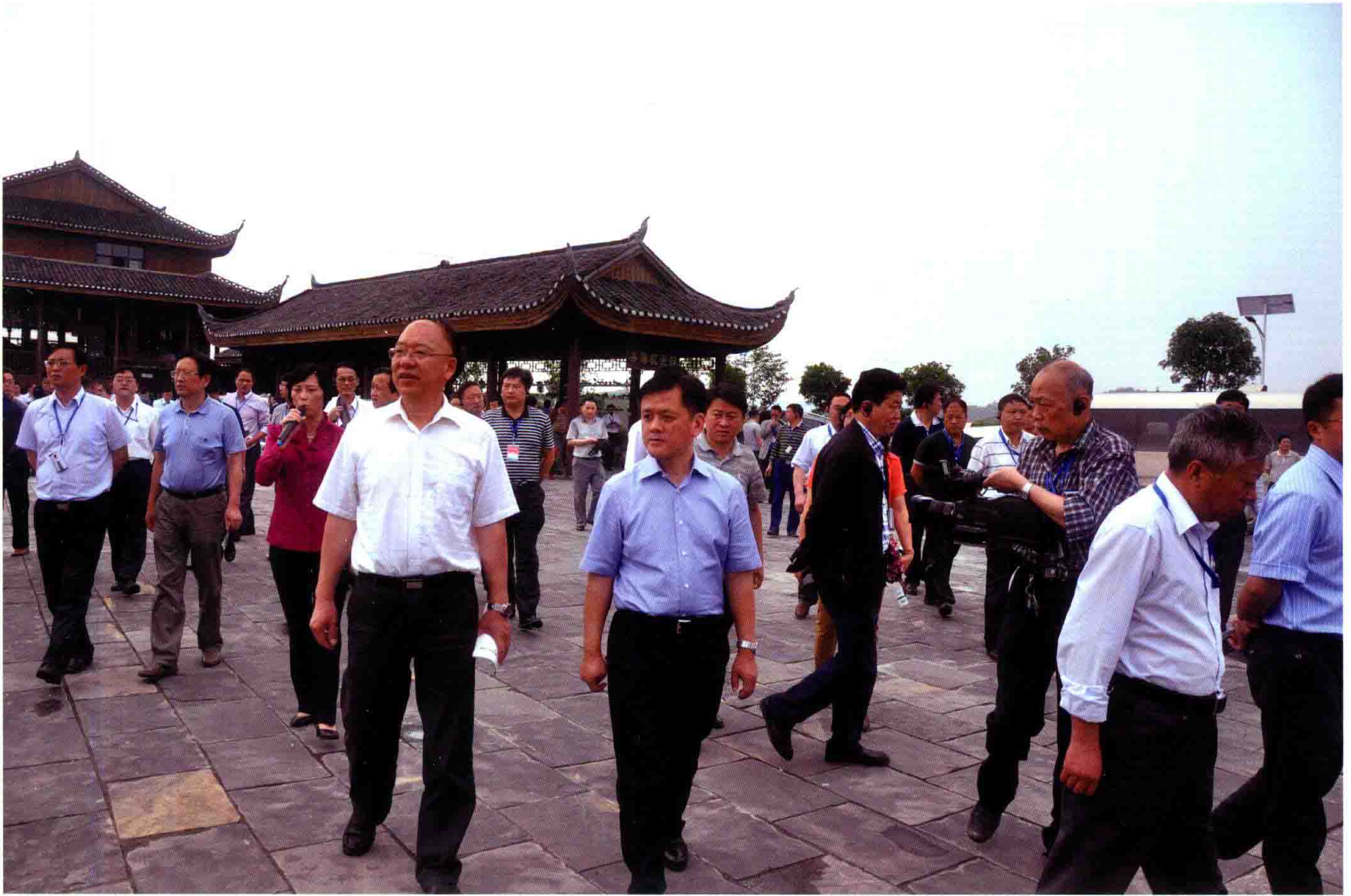
2014年6月11日，省人民政府副省长刘远坤（前左一）、市委书记刘奇凡（前左二）到正大现代农业示范园区指导工作