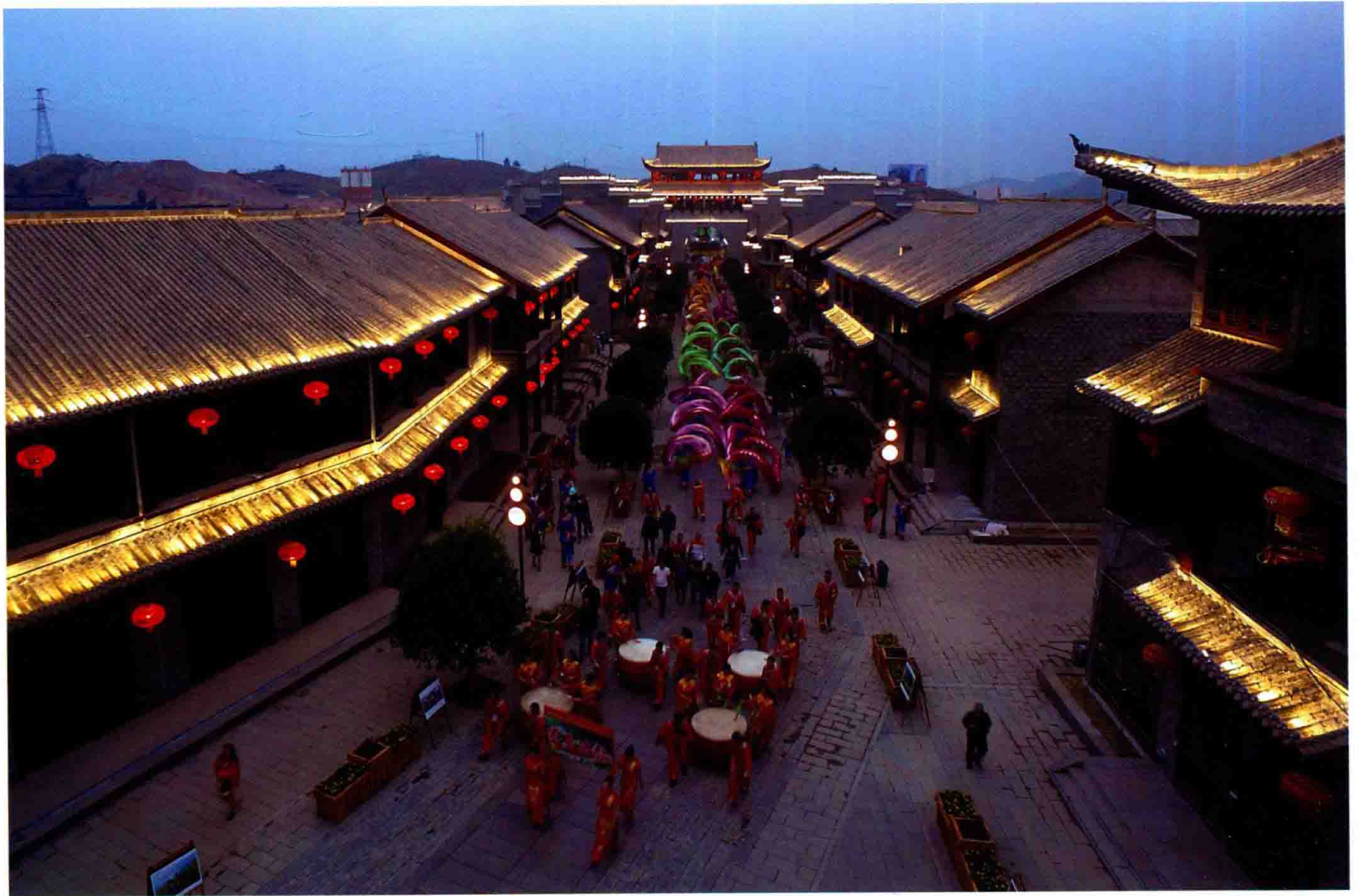
九龙湖苗人古城