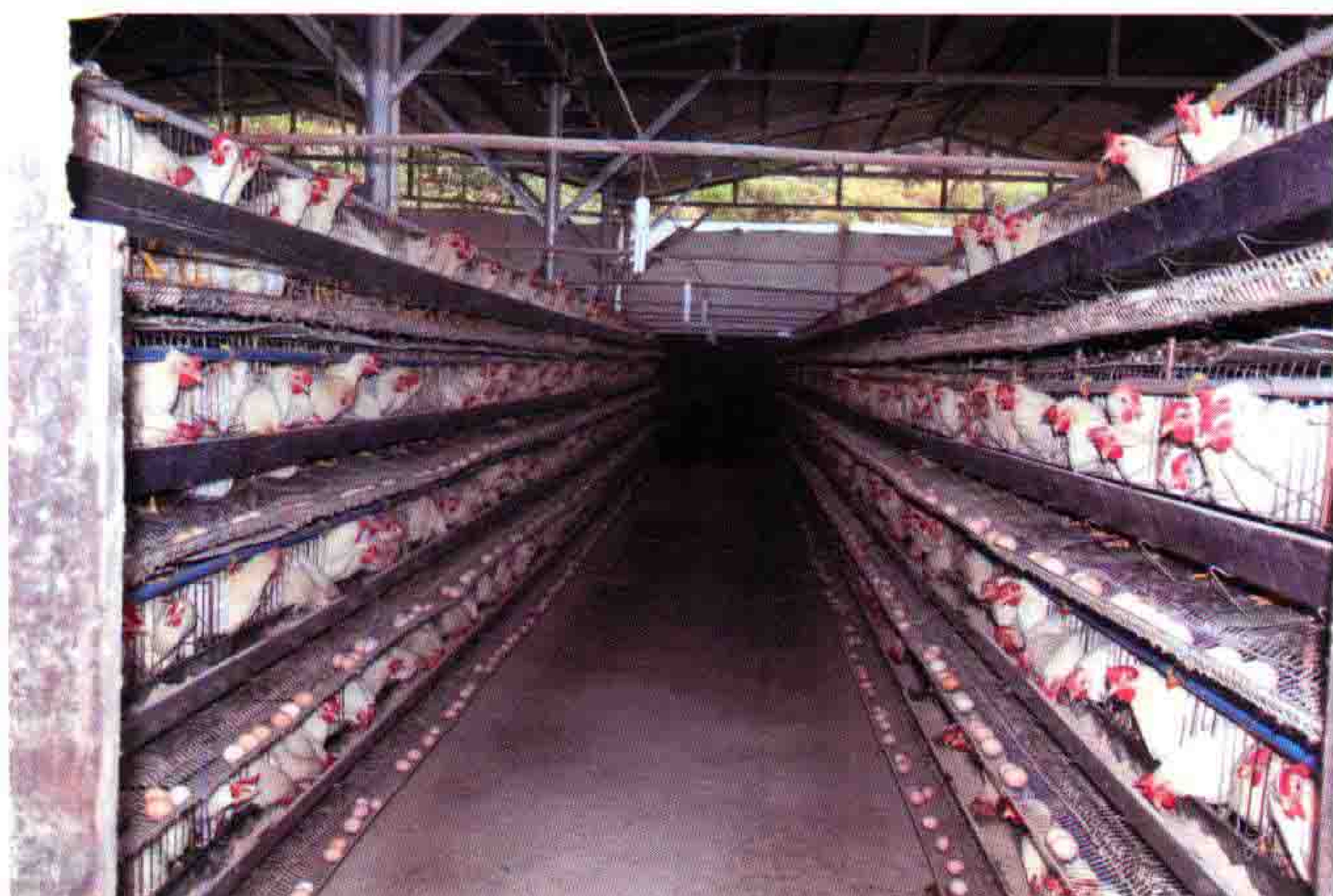
迓驾镇郭卫蛋鸡养殖场