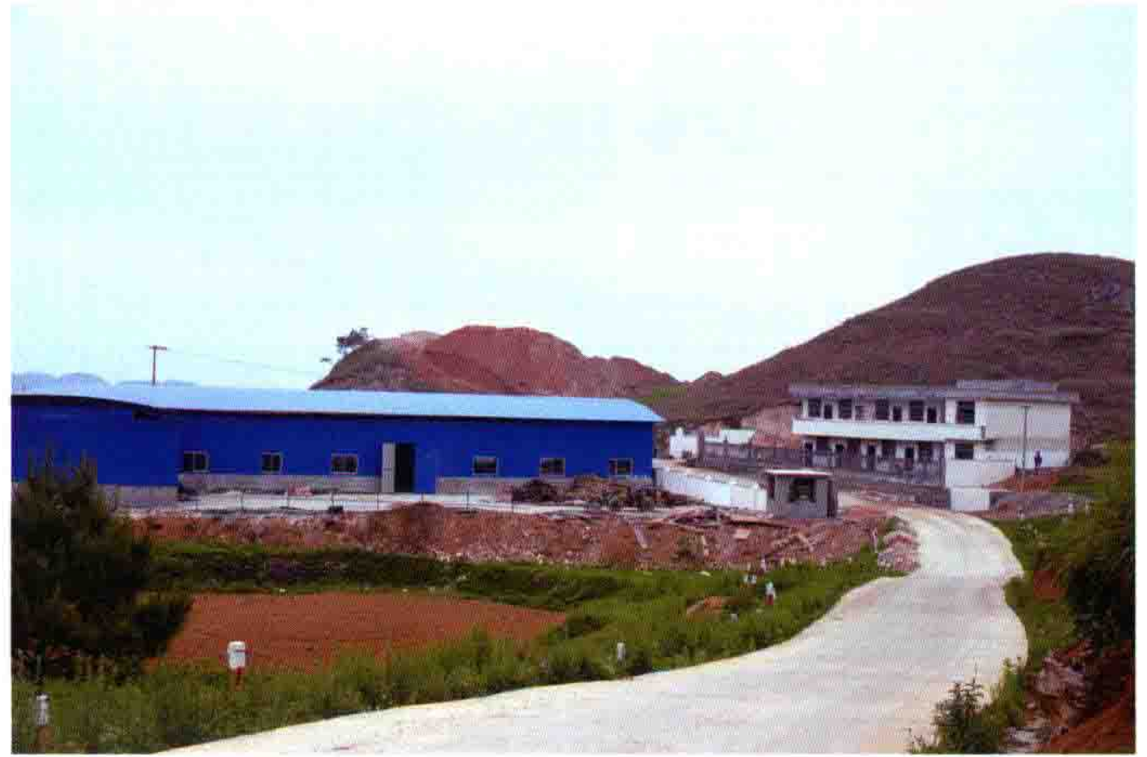
盘石园区在“黔东草海”山脚配套建设5万吨牧草加工厂

完成肉类产量5.26万吨、禽蛋产量4900吨、水产品产量5900吨，分别比上年同期增长12.96%、16.67%、15.69%。畜牧产值达15.77亿元。