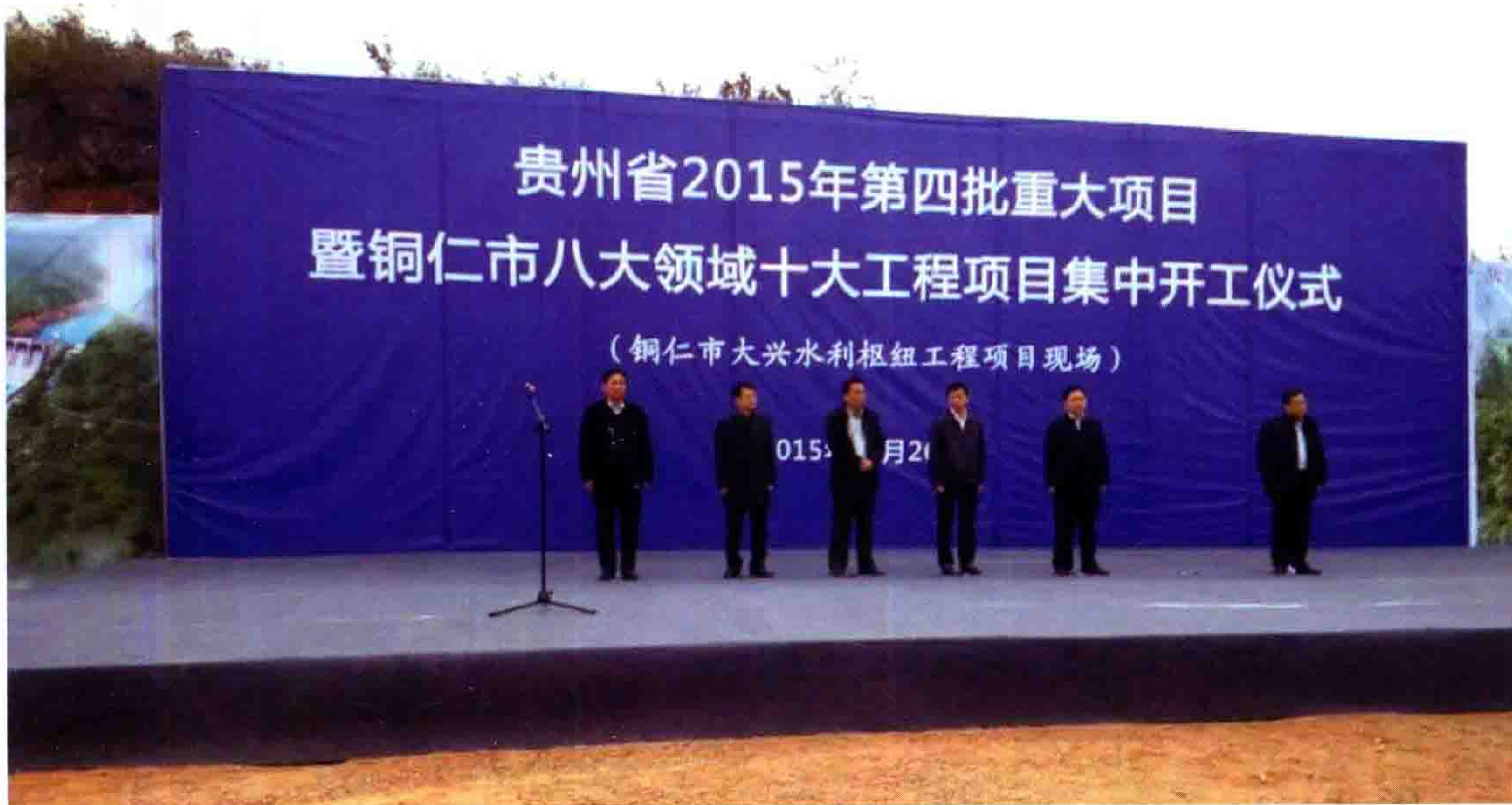
大兴水利枢纽工程开工