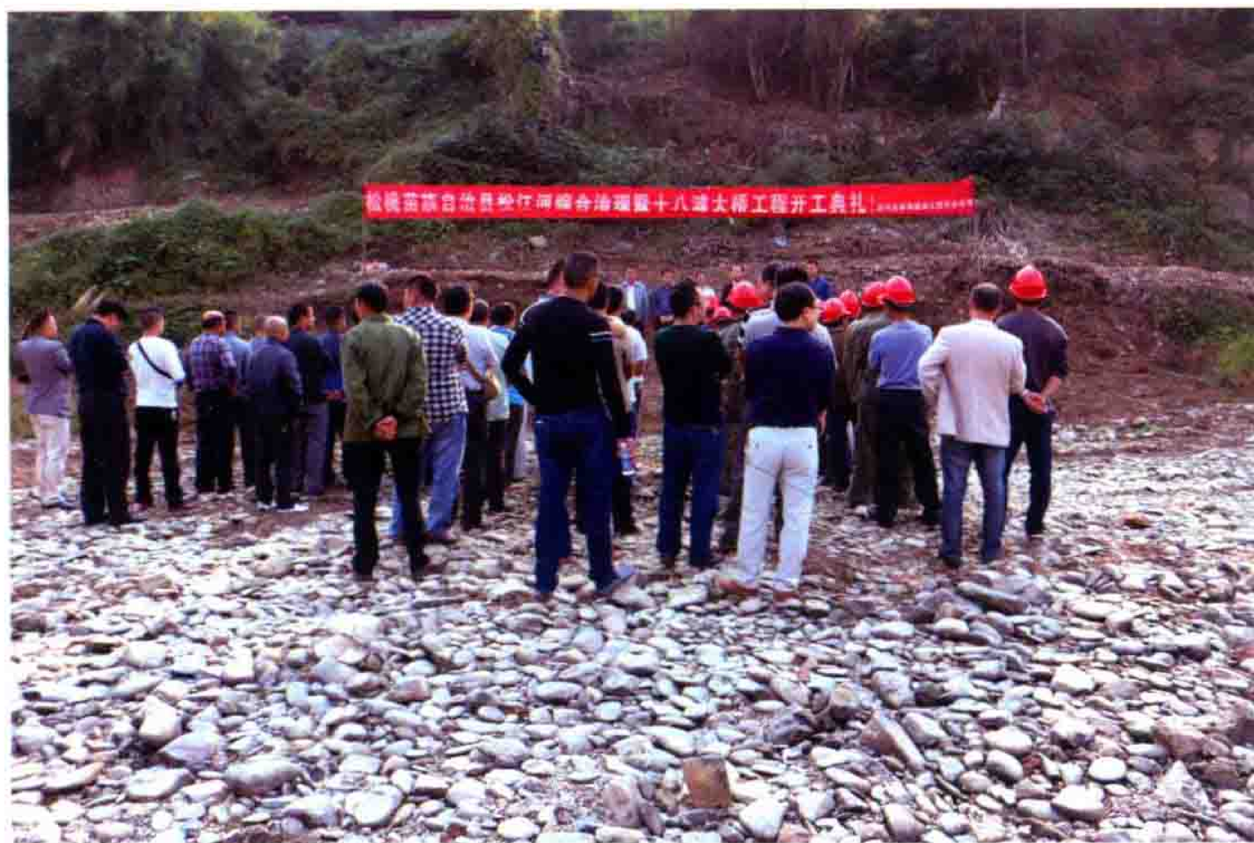
松江河综合治理项目开工