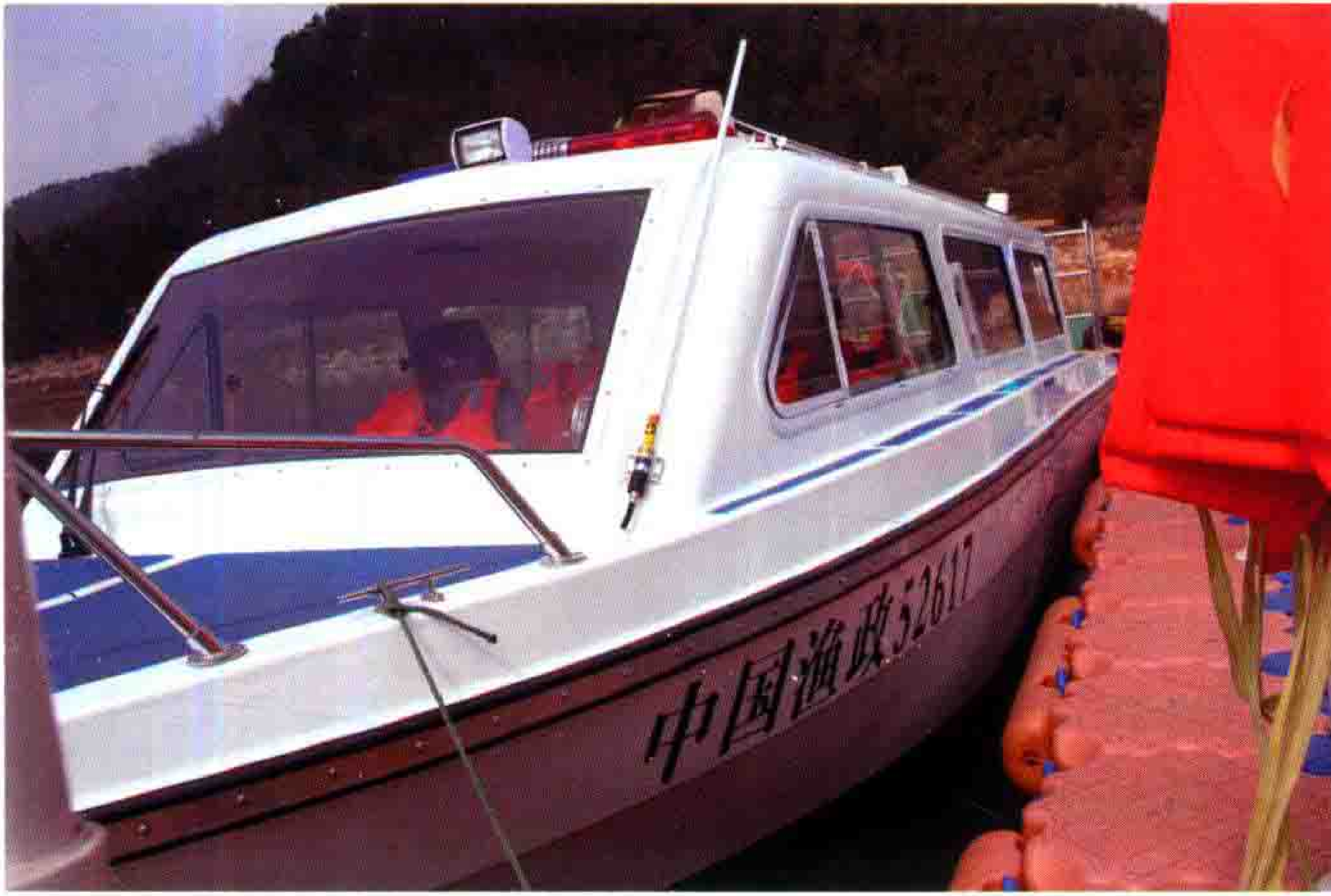
2014年6月12日，县内第一艘农业部配发的中国渔政52617号执法艇在苗王湖正式服役