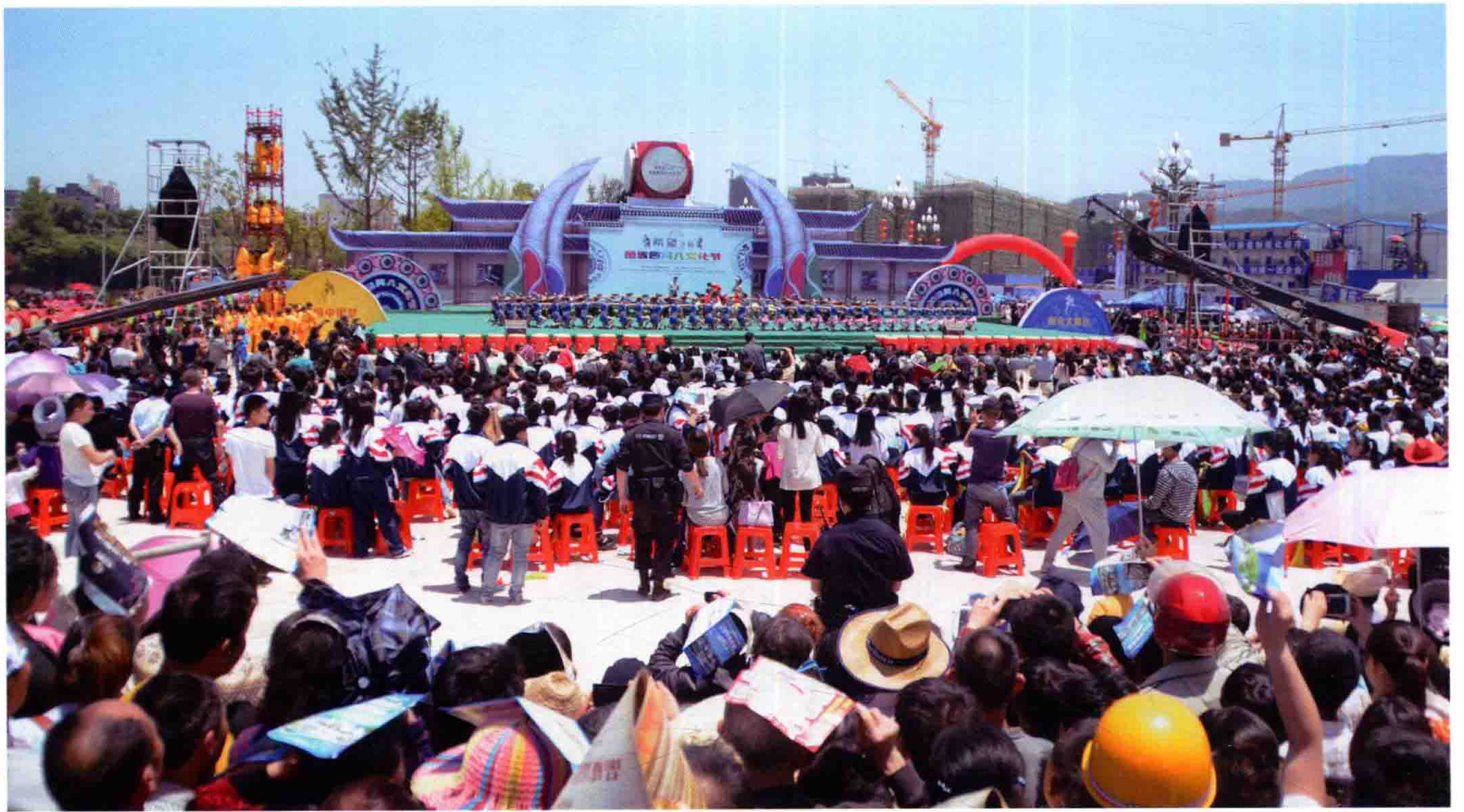
2014年5月6日，在松江希望城举办“希望之城”苗族四月八文化节活动