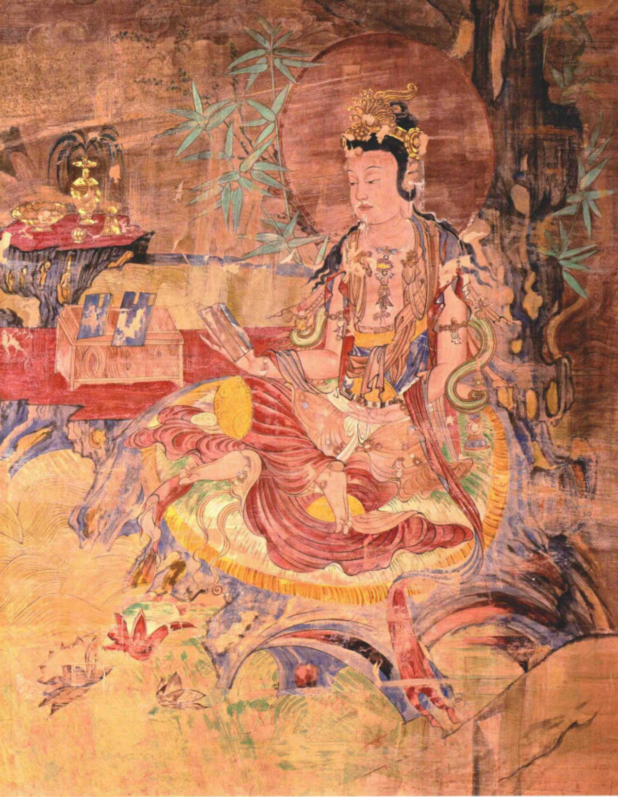
东千佛洞·水月观音·西夏 196cm×121cm