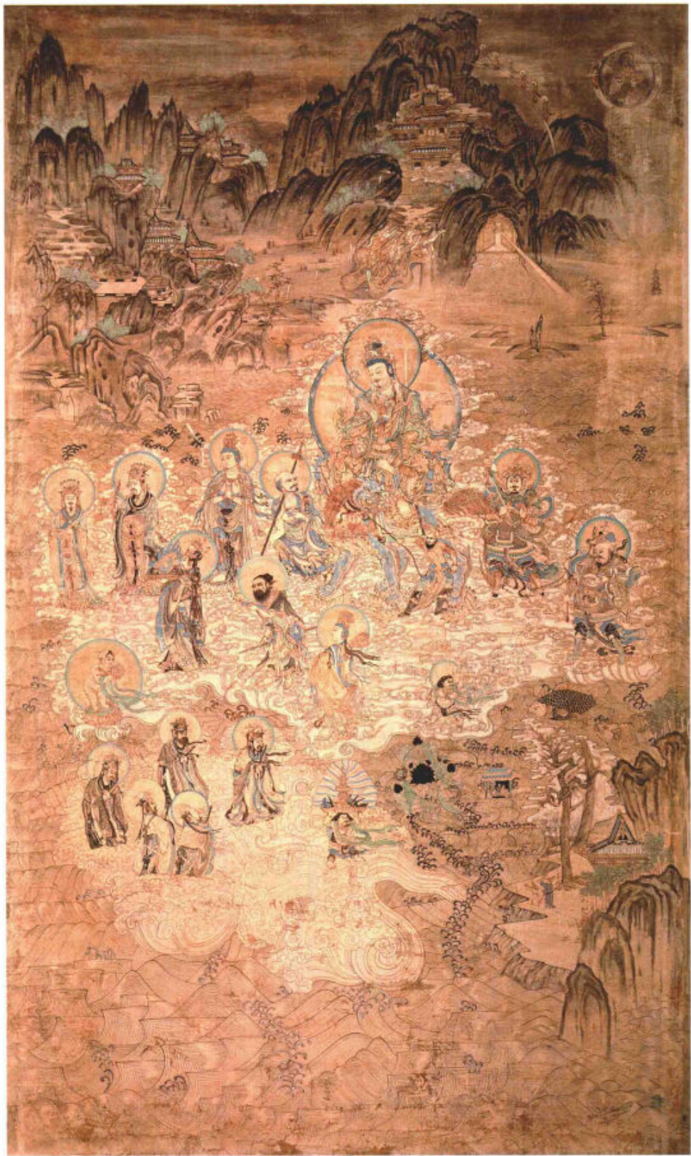
榆林窟·文殊菩萨经变·西夏 266cm × 160cm