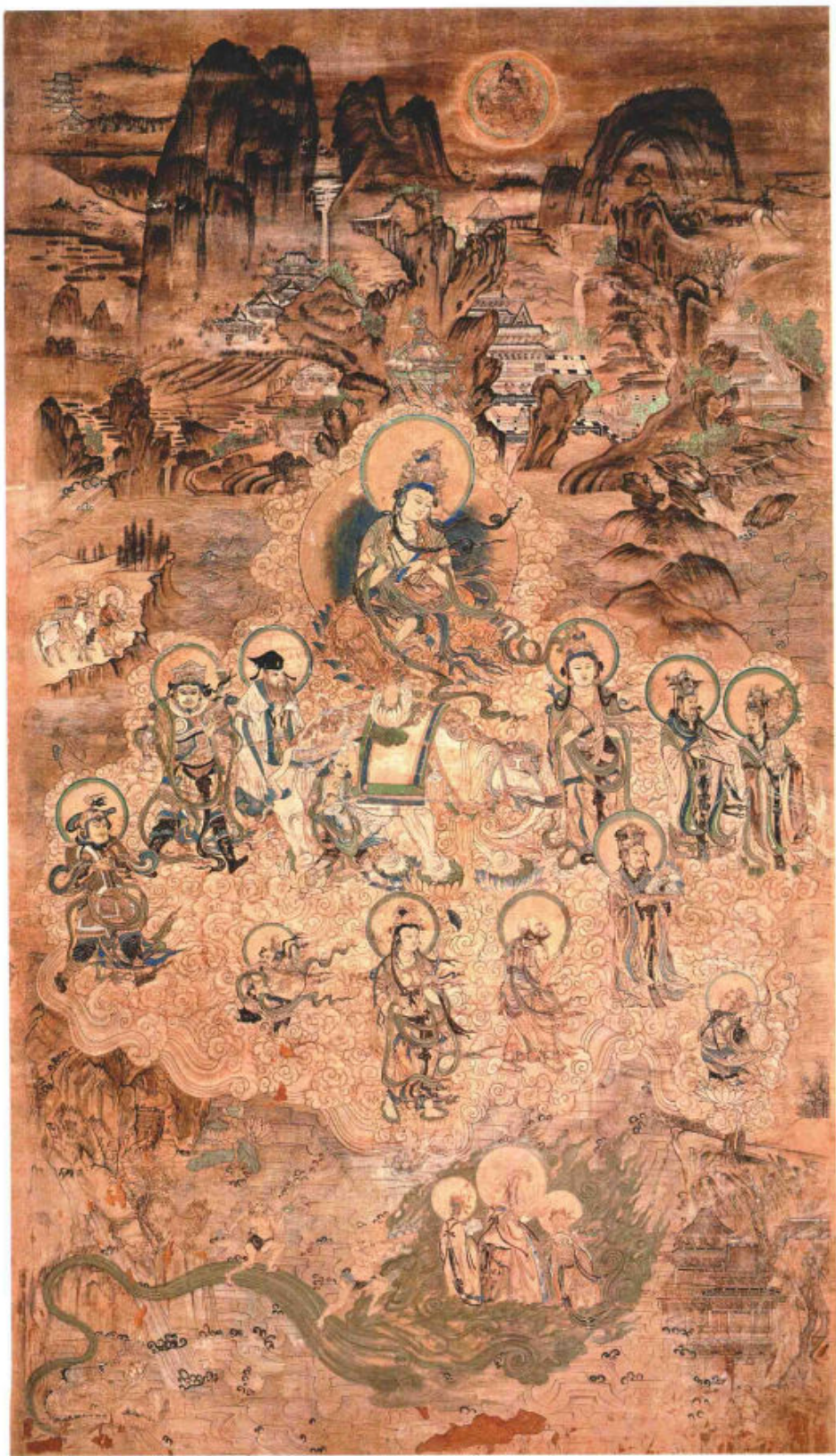
榆林窟·普贤经变·西夏 226cm×160cm