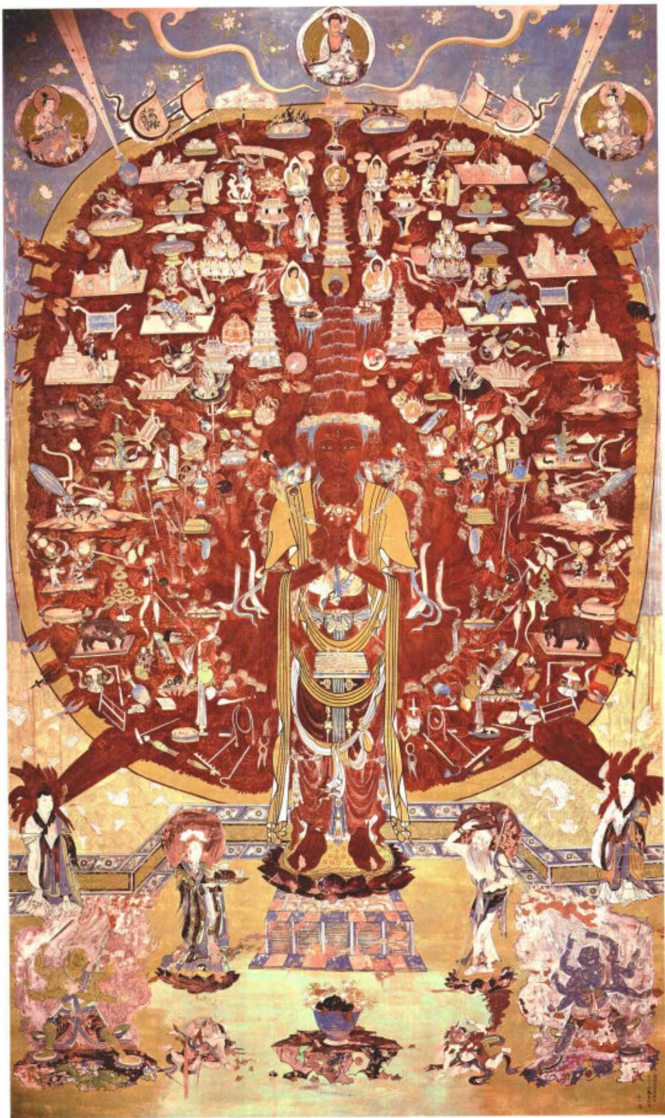
榆林窟·千手观音·西夏 380cm × 223cm