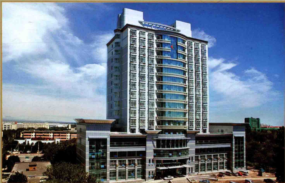
2007年1月29日，兵团六建承建的石河子大学医学院、第一附属医院住院二部工程被国家建设部授予建筑工程最高奖——鲁班奖。