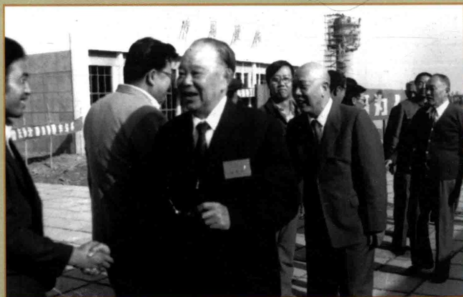
1987年9月25日，全国人大常委会副委员长廖汉生和全国政协副主席王思茂视察工一师北疆铁路六建工地。