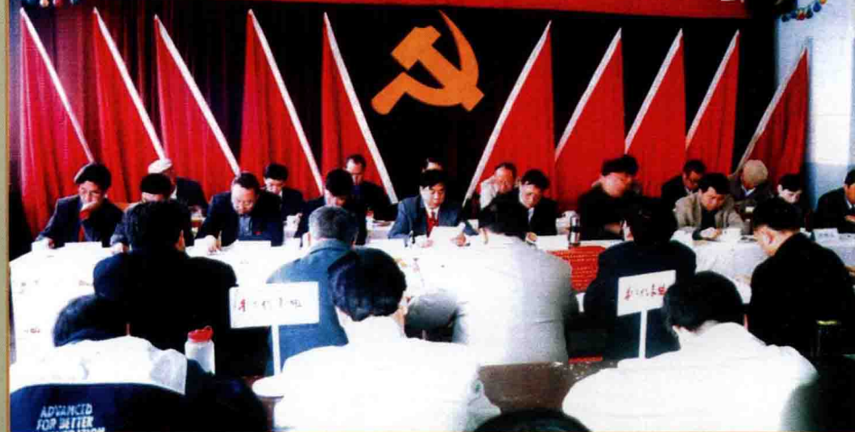
1999年4月22日，中国共产党新疆兵团六建第十一次代表大会召开。