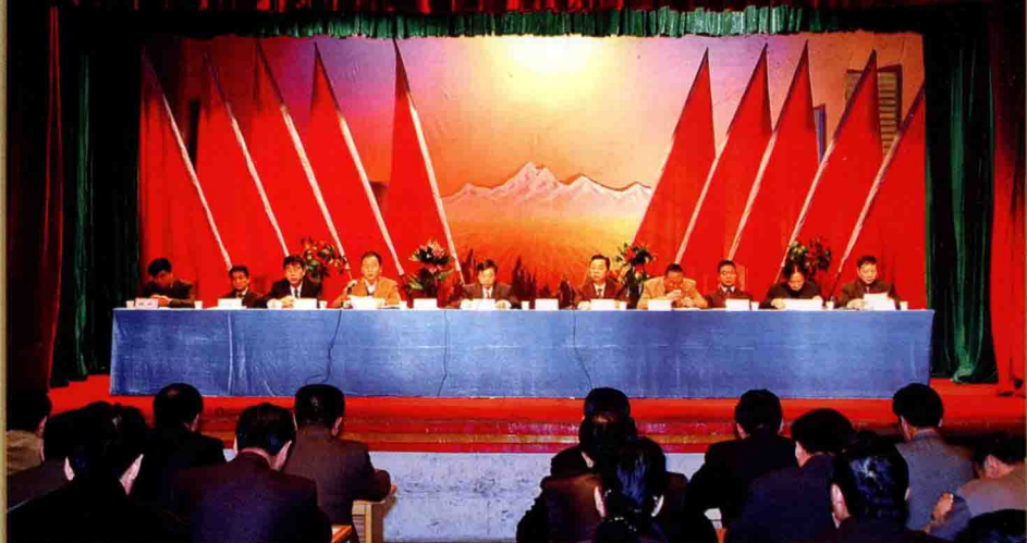
2006年3月，兵团六建召开第六届第十次职工代表大会。