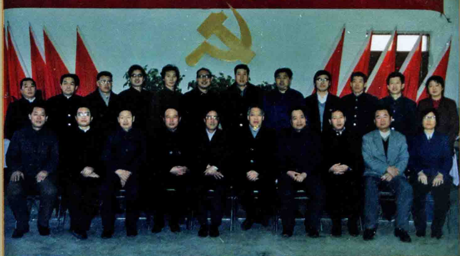
1988年1月20日，中国共产党新疆兵团工一师六团第九次党员代表大会召开。公司领导和党员代表合影。