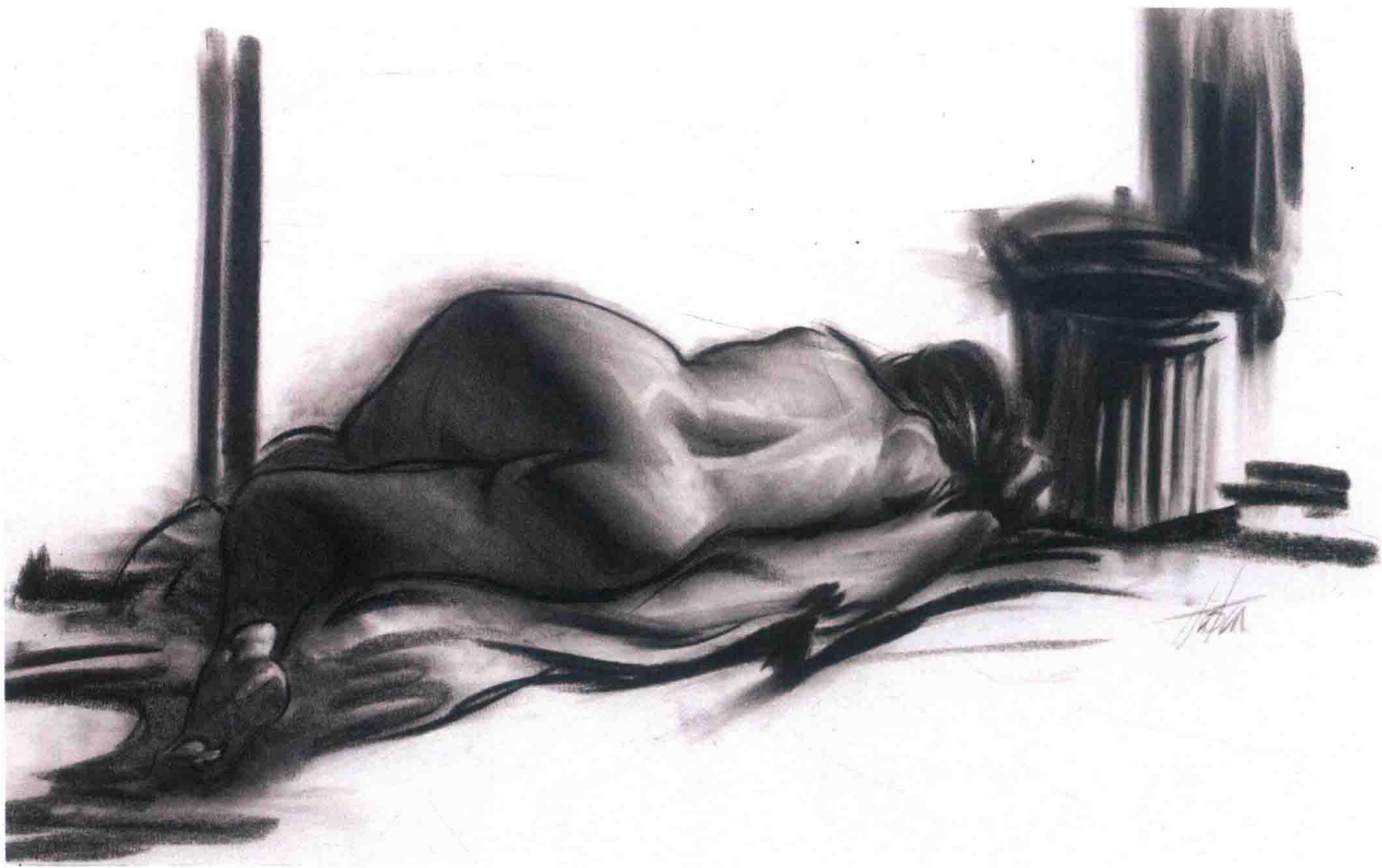
《凯伦》，2001 年左右，史蒂夫·休斯顿。对一位斜倚着的女性的炭笔素描。