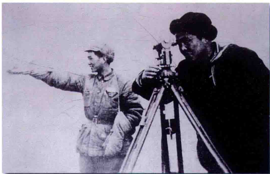
十八团战士同地方水利技术人员共同勘察设计 渠道线路。