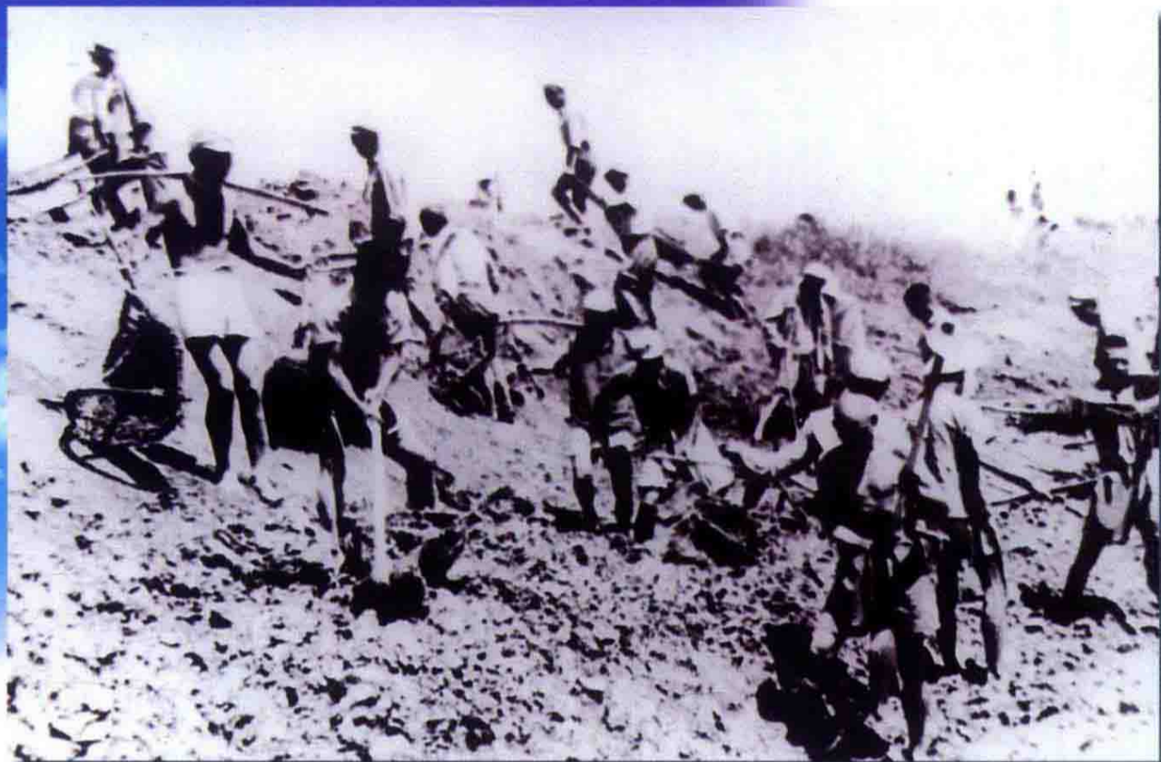
十八团官兵为响应王震将军修建“十八团渠”号召， 全团 1000 余名指战员从 1950 年 9 月破土动工。