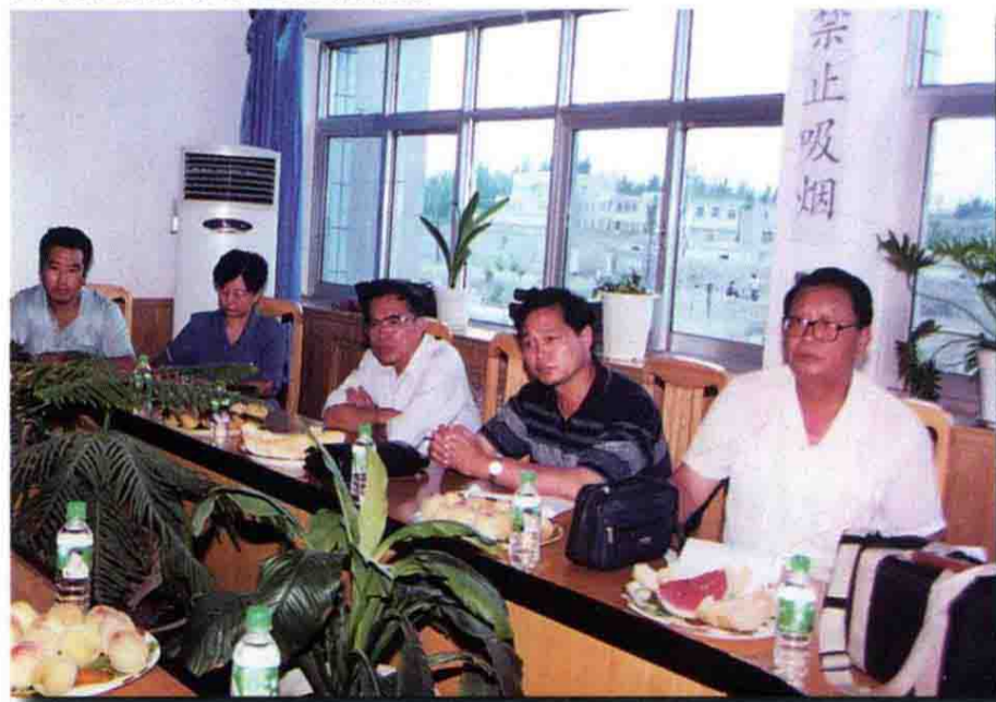
农二师党委书记、政委葛政法(右三)、师长宋建业(右二)陪同兵团民政部长许明杰(右一),来十八团渠管理处指导防洪工作。