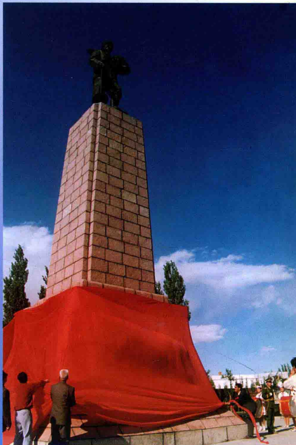
为深切怀念王震将军和十八团官兵“屯垦戍边、艰苦创业”的丰功伟绩。于1992年7月5日修建十八团渠纪念碑。1994年9月7日竣工剪彩。