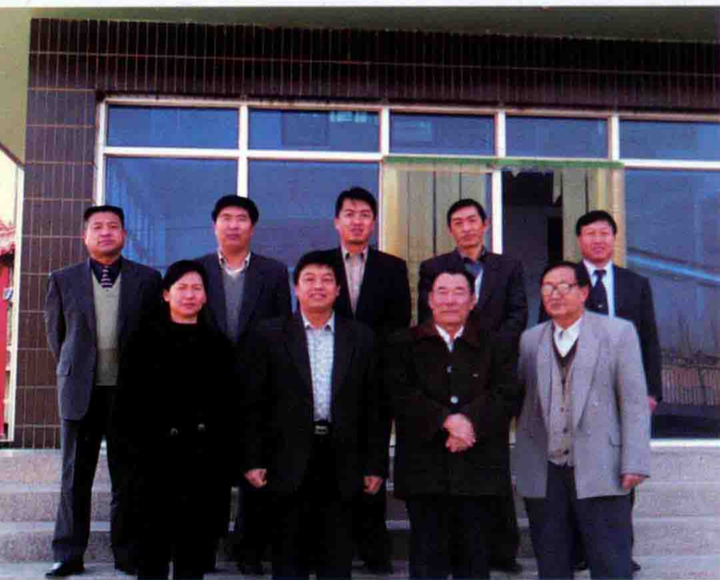
处机关科室、副科以上干部合影。