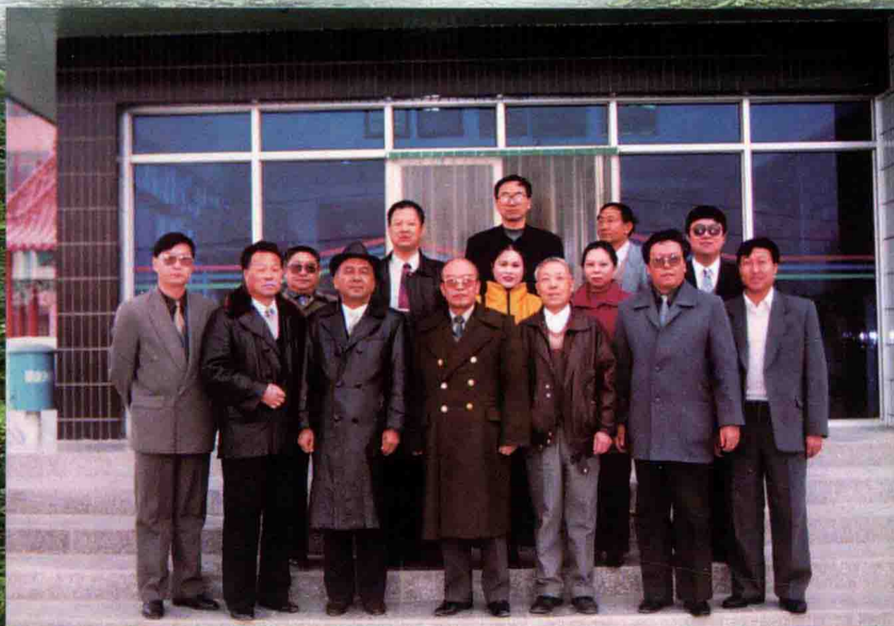
2000年11月,兵团水利部副司长、新疆水利厅厅长一行在师领导陪同下,来我处检查“安全文明”小城镇建设。