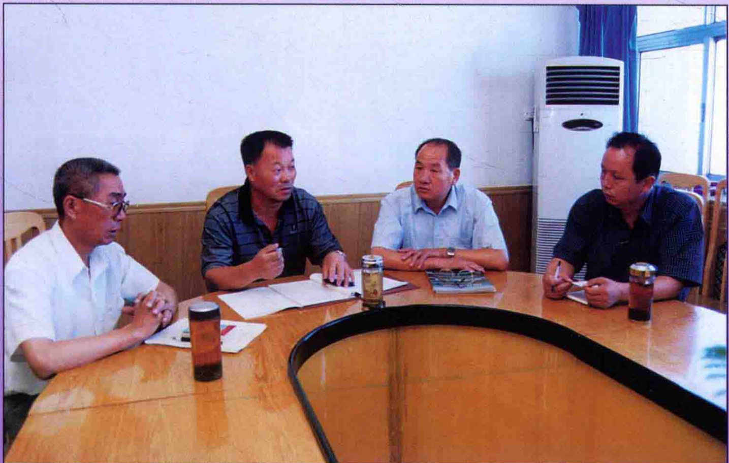
处领导集体在一起研究工作。