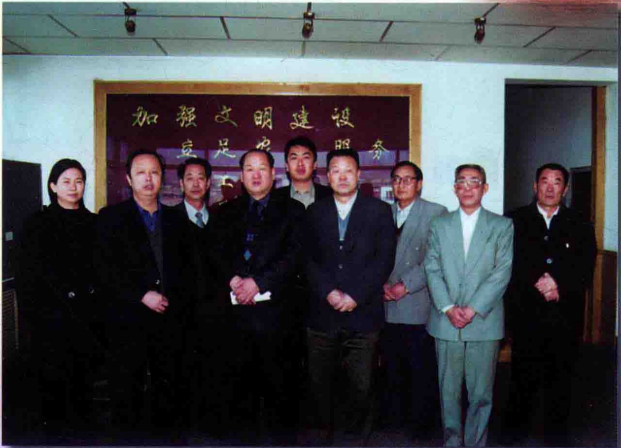
处党总支部委员会成员