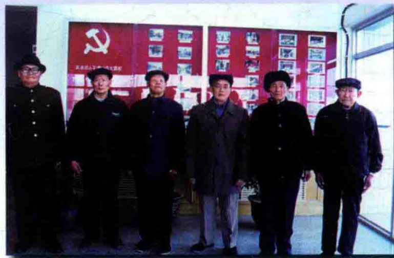
50年来,一直奋斗在十八团渠水利战线(原参加过渠工程修建)老战士合影。