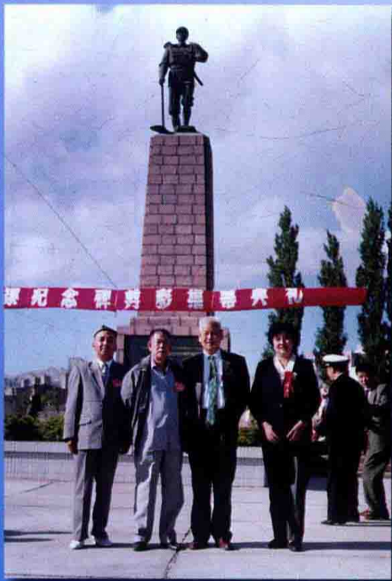
原兵团司令员刘双全(右二)等领导在纪念碑前合影留念。