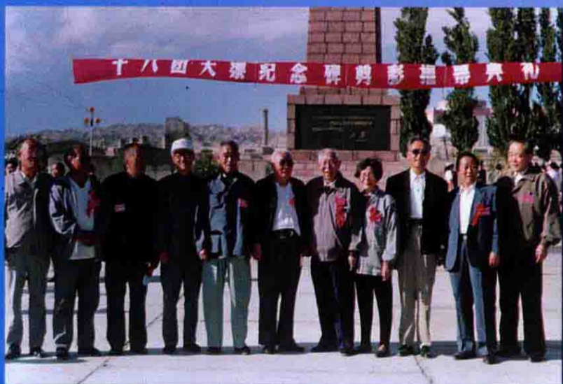
原农二师老领导们参加纪念碑剪彩后合影留念。