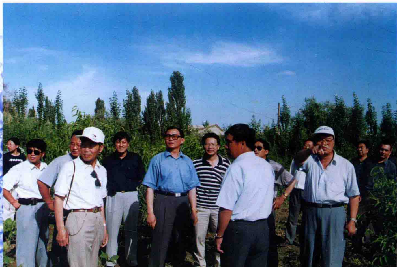
兵团灌区水利管理现场会与代表观摩十八团渠管理处水利经济建设情况。