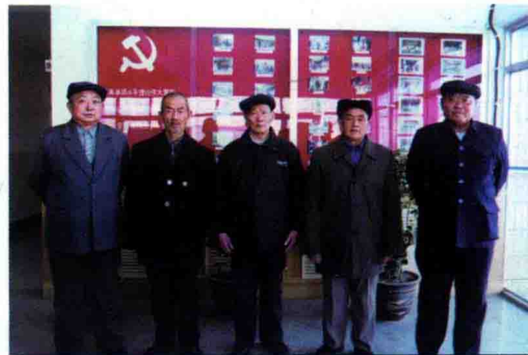
十八团渠管理处离休老干部合影。