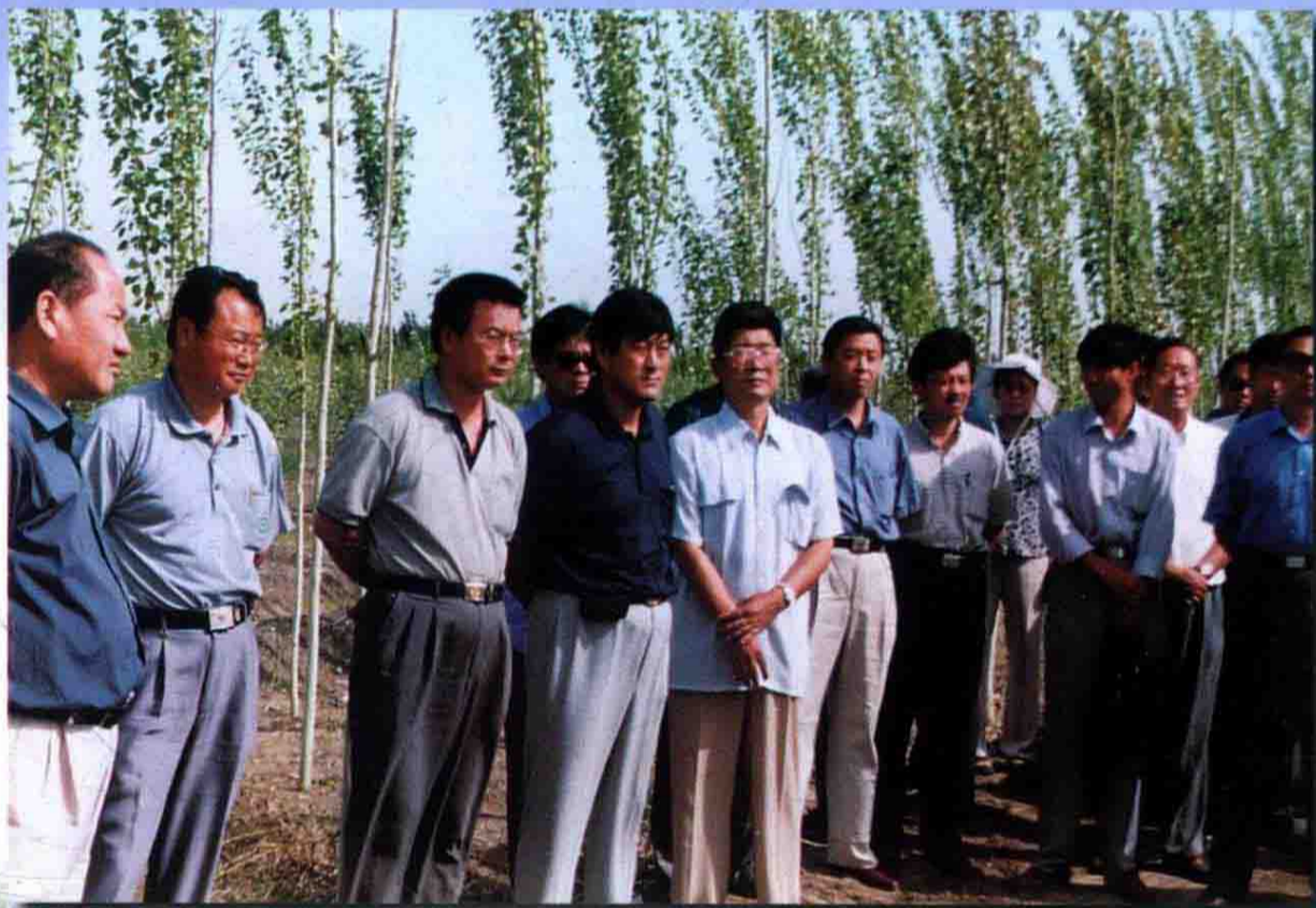
兵团灌区水利管理现场会于2000年7月在十八团渠管理处举行。图为与会代表参观处水利经济发展情况。