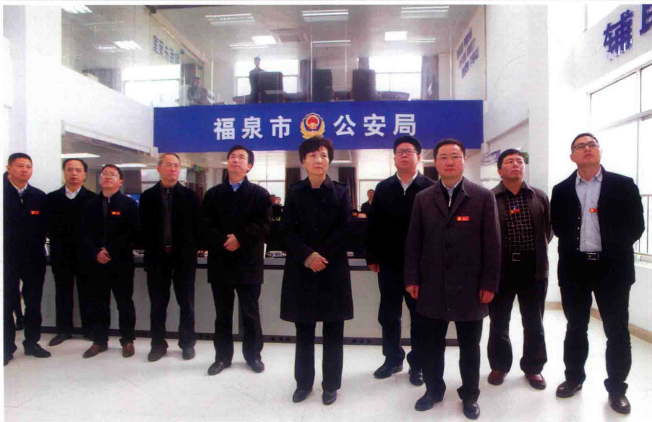
2016年3月15日，省委副书记、省委政法委书记谌贻琴（女）到福泉调研指导矛盾纠纷多元化解“福泉112”模式。