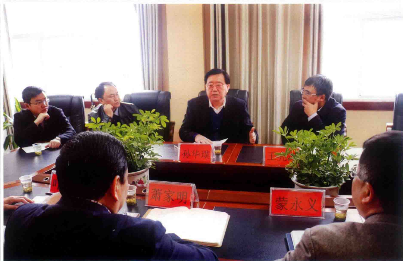
2016年11月8日，最高人民法院党组成员孙华璞（右三）到福泉市人民法院调研司法改革工作。