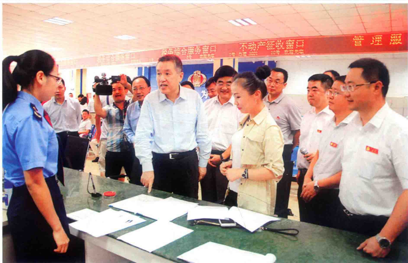
2016年9月25日，国务院赴贵州督查组组长、国家工商总局局长张茅（前排右三）率领督查组到福泉市督促检查中央经济工作会议和《政府工作报告》贯彻落实情况。慕德贵、罗桂荣、黄伟、杨华祥等省州市领导陪同。