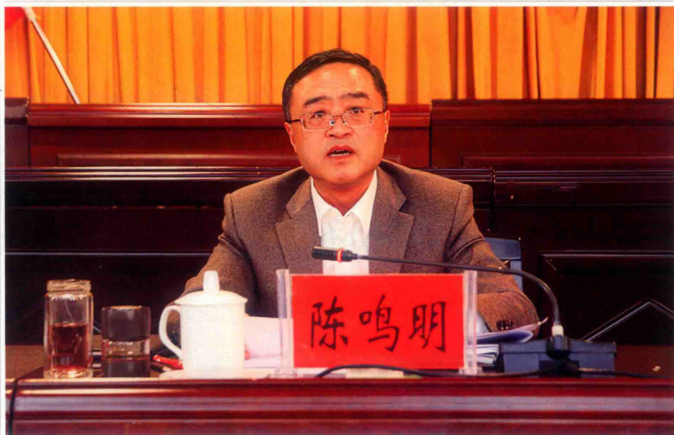
2016年12月29日，2016年全省推进“互联网+政务服务”暨政务服务中心标准化建设现场会在福泉市召开，副省长陈鸣明出席会议并作讲话。