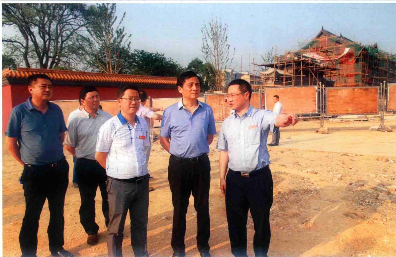
2016年5月6日，副省长黄家培（前排右二）到福泉调研循环经济、新型工业化发展等工作。