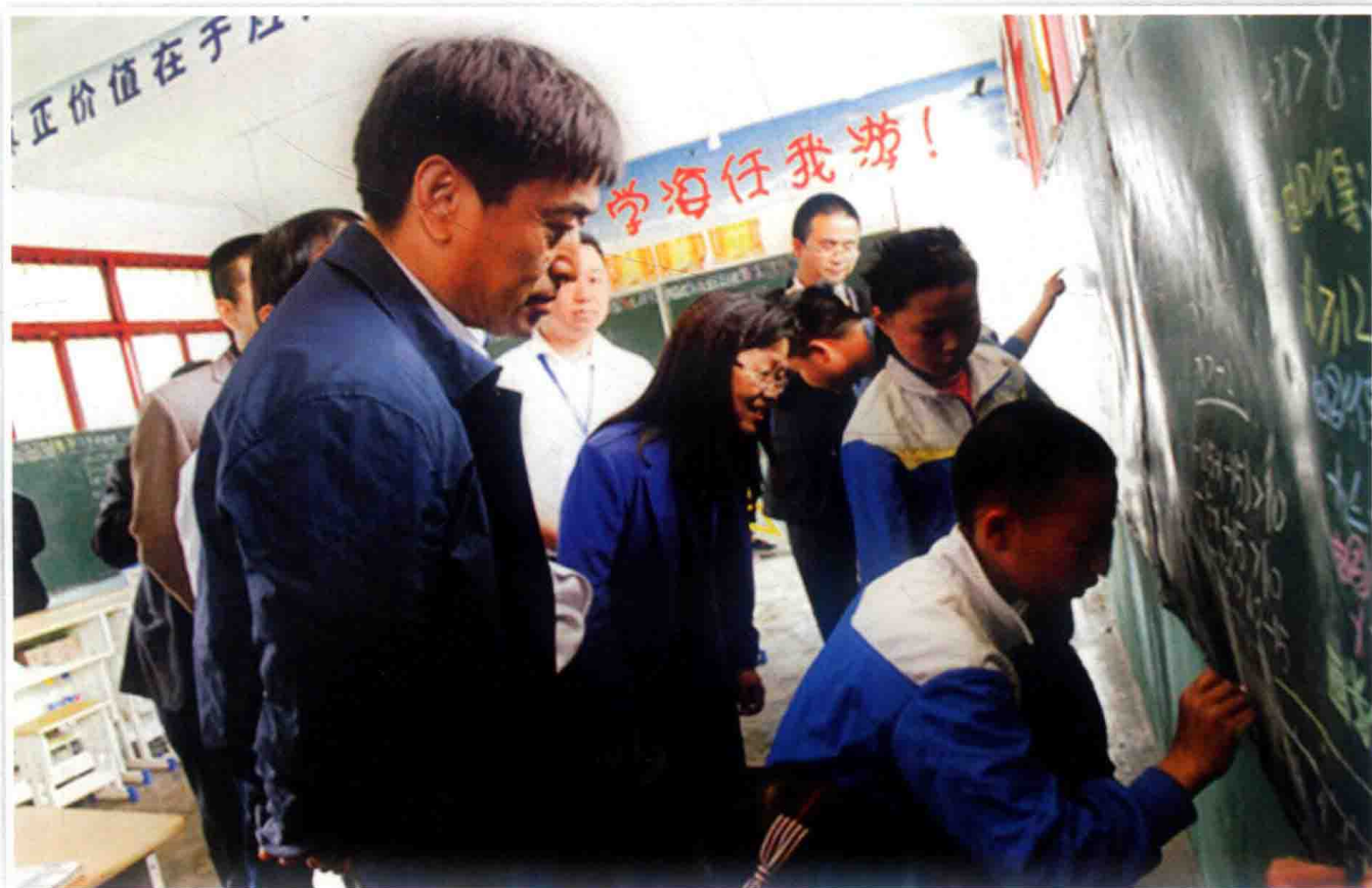
2016年5月27日，国家教育部基础教育一司司长吕玉刚（左一）在福泉调研留守儿童教育工作。