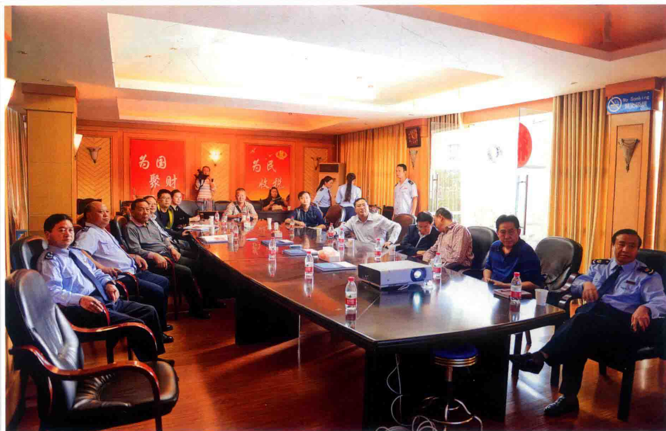
2016年10月25日，国家税务总局政策法规司副司长靳万军（左三）在法规司法制处处长丁作提（右四）及省、州国税局地税局相关领导的陪同下到福泉市指导全国法治税务示范基地创建工作。