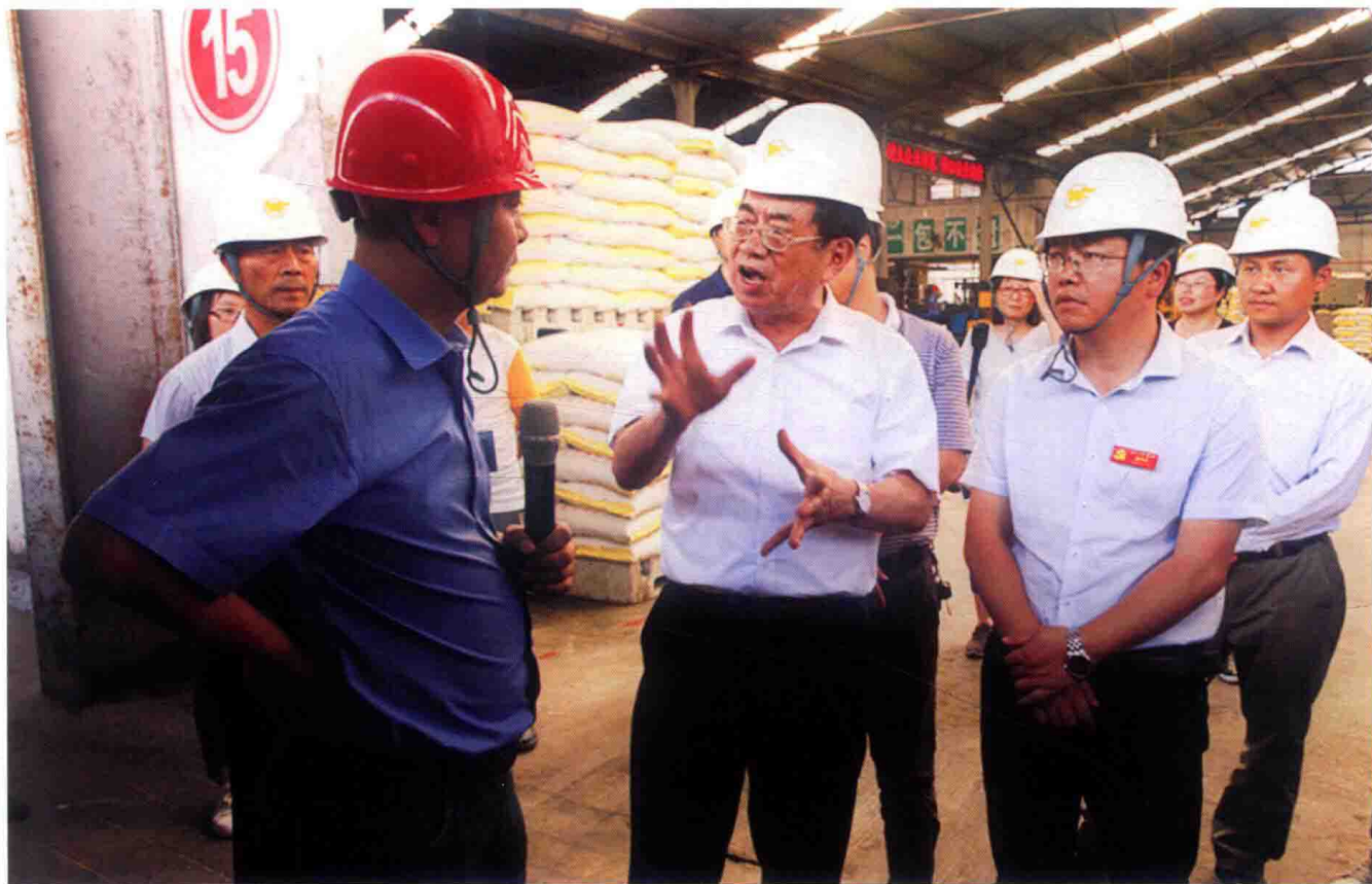
2016年6月21日，由国务院参事、农业部农村经济研究中心研究员刘志仁（前排中）率队的国务院参事调研组到福泉调研指导化肥业去产能及新型肥料扶持政策实施情况。