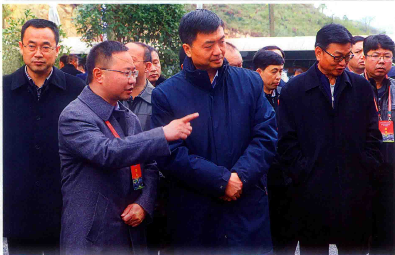
2016年11月23日，贵州省委常委、贵阳市委书记陈刚（前排中）率全省第三次项目建设暨易地扶贫搬迁现场观摩团走进福泉牛场镇观摩。