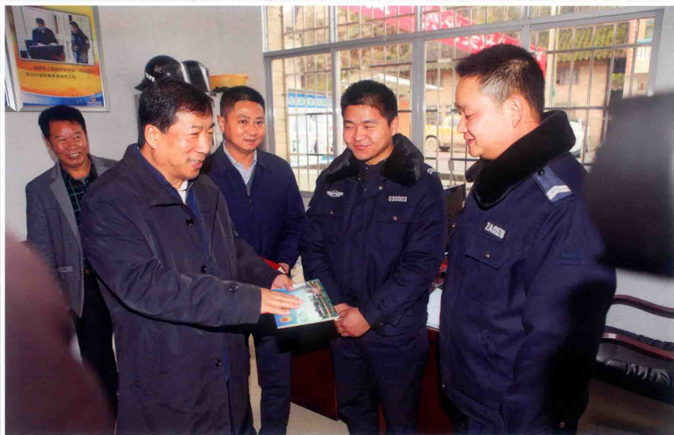
2016年1月10日，副省长、省公安厅党委书记、厅长孙立成（前排左一）到福泉市公安局黄丝鱼酉警务室调研，并慰问驻村警务助理唐水清。