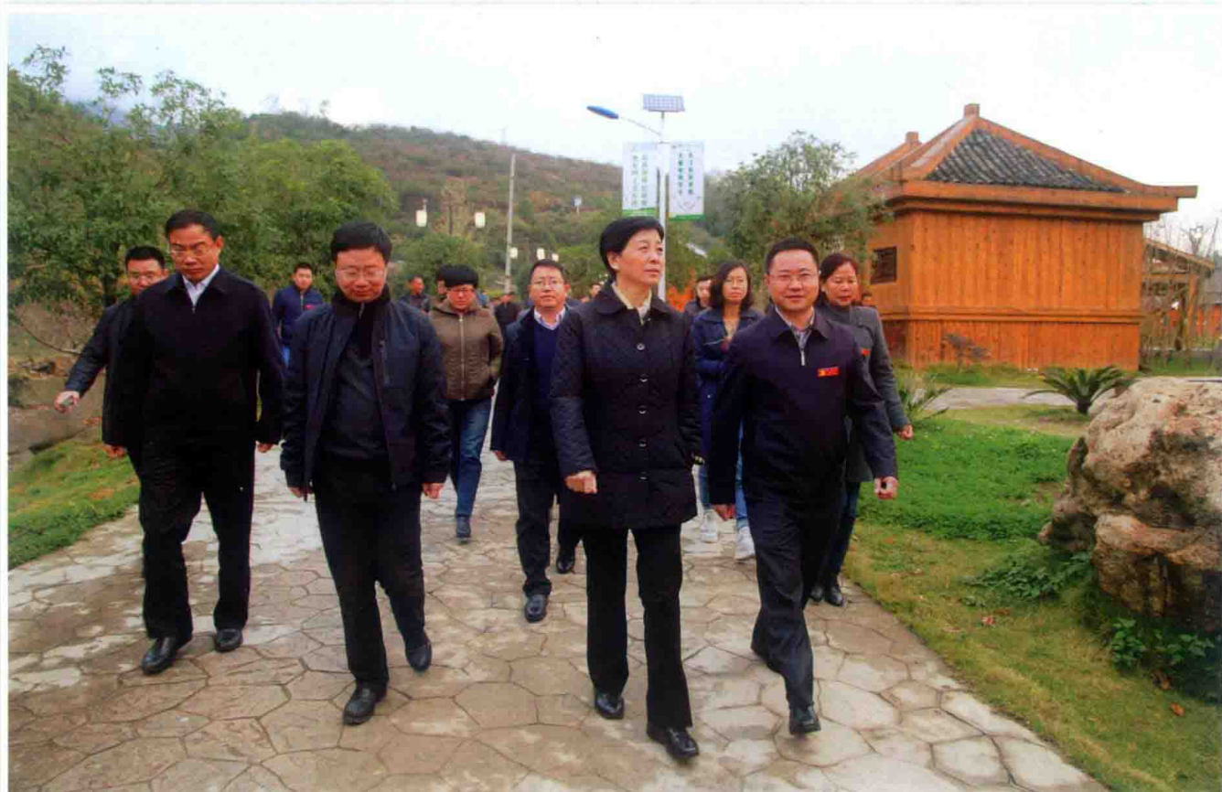
2016年11月9日，中华全国供销合作总社党组书记、理事会主任王侠（前排右二）在福泉调研“三位一体”+“贵农网”供销合作经济组织体系建设。