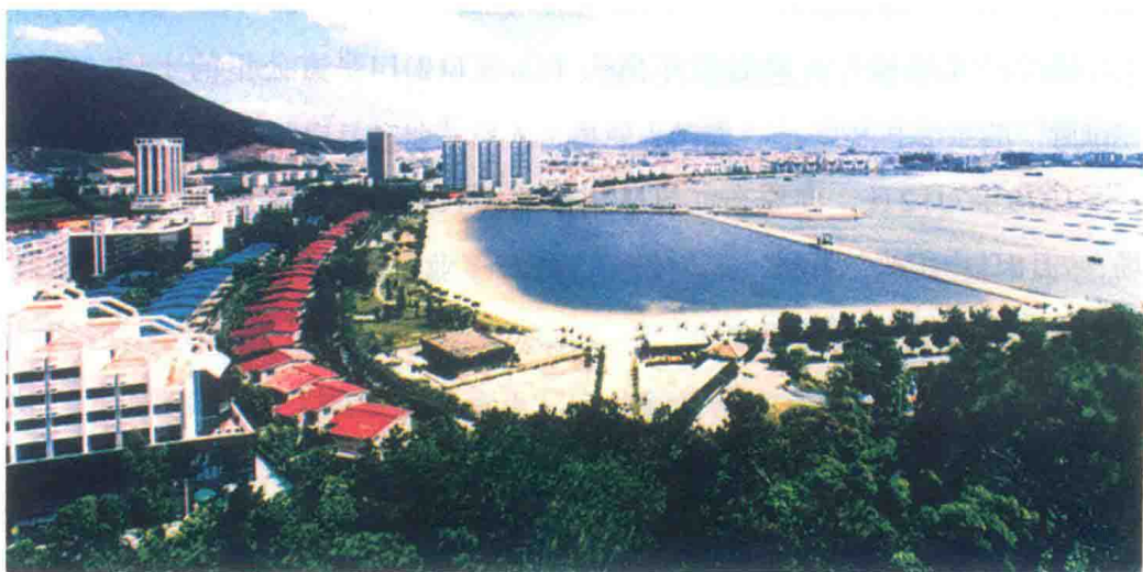
20世纪80年代末的蛇口，明华轮已靠岸，海滨浴场、女娲雕像已落成

蛇口工业区的实践，有力地验证了“实践是检验真理的唯一标准”这一科学论断。邓小平南方谈话中特别肯定道：“深圳的建设速度相当快，深圳的蛇口工业区更快，原因是给了他们一点权力，500万美元以下的开支可以自