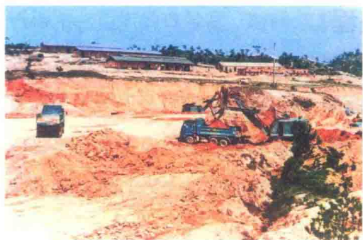
当年的蛇口建设场面