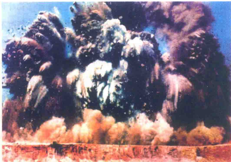
1979年7月8日，招商局蛇口工业区基础工程正式破土动工

1949年，袁庚率两广纵队炮兵团解放了包括三门岛、大铲岛、蛇口等周边地区在内的珠江口沿海岛屿。1978年，如果按部就班，正是这位昔日的炮兵团长“船到码头车到站”，“思谋着回乡养老”，过过清闲日子的时候。