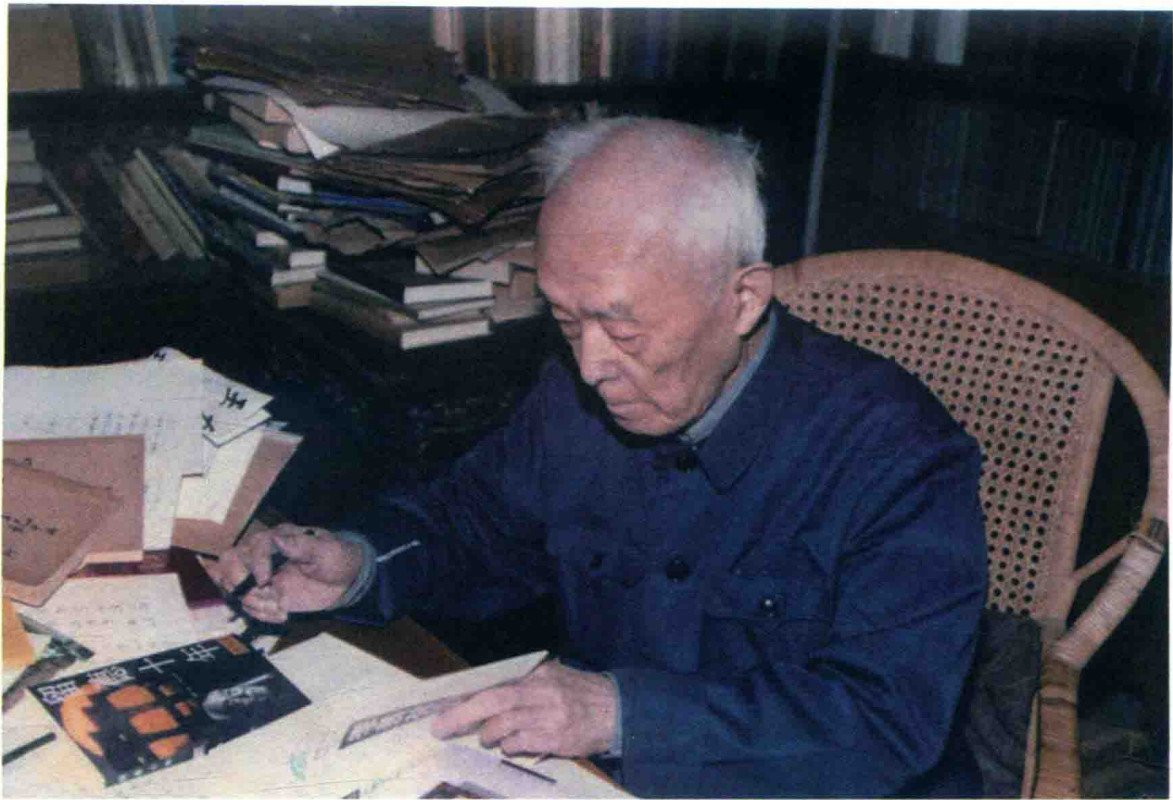
季羨林先生在写作。