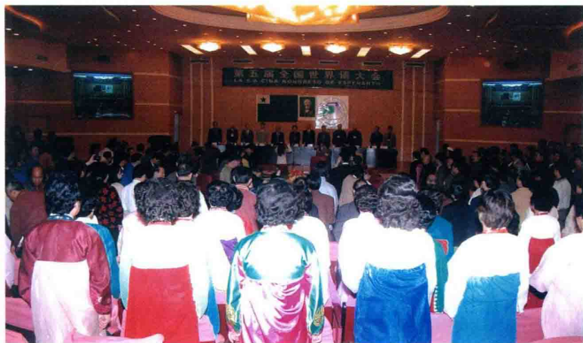
La Kvina Ĉina Kongreso de Esperanto en Yanji, 2003