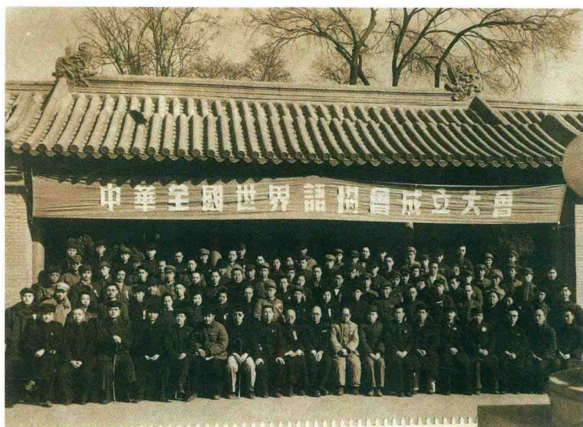
Fondkunveno de la Ĉina Esperanto-Ligo, marte de 1951