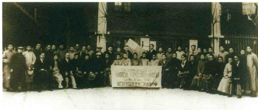
Membro-kongreso de la Hankou-a E-Asocio, 1930