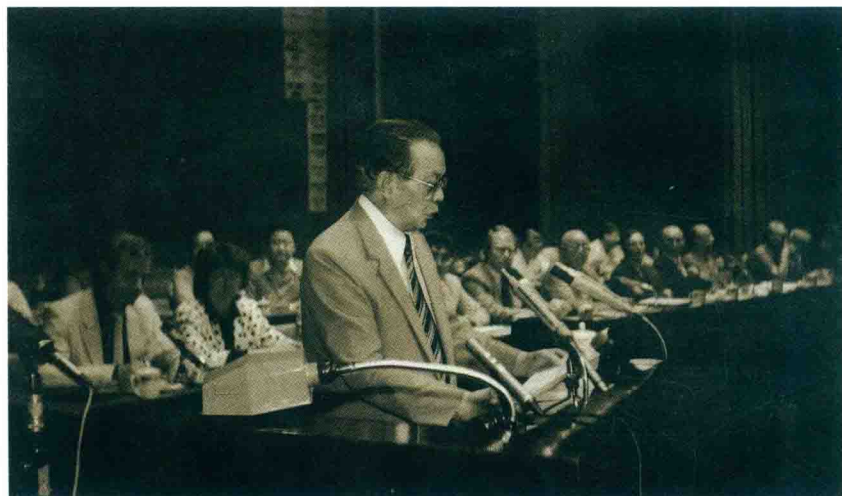
Huang Hua faras paroladon en la inaŭguro de la 71-a UK.