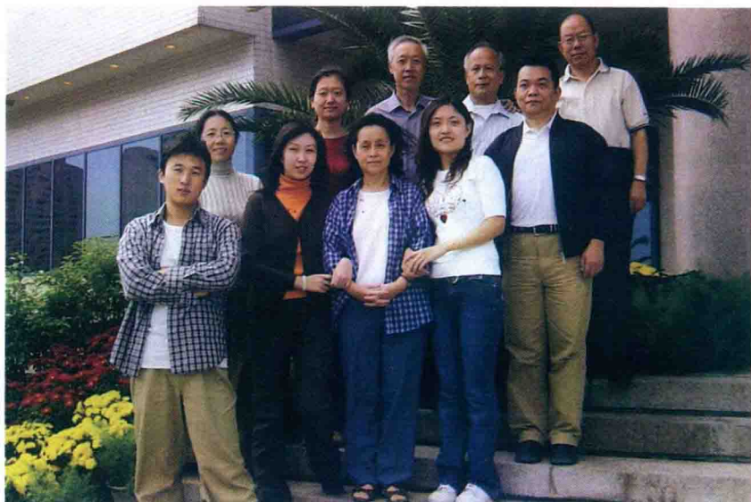
Laborantoj de la E-redakcio de la Ĉina Radio Internacia