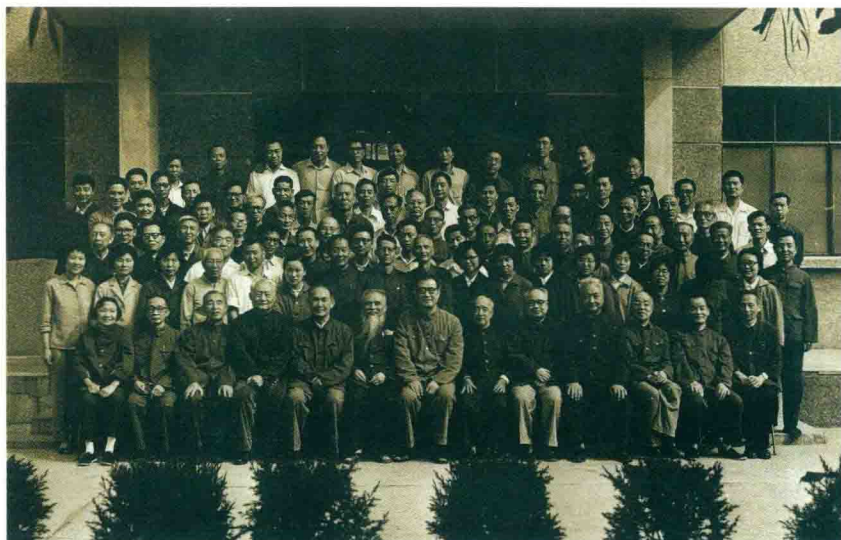
Reprezentantoj de la 2-a Ĉina Esperanto-laborkunsido, 1979