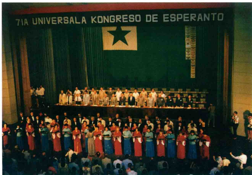
Solena inaŭguro de la 71-a UK en Pekino, 1986