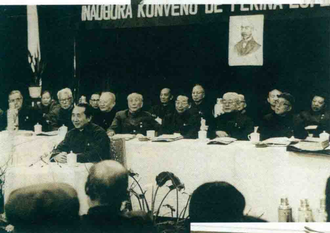
Fondkunveno de la Pekina E-Asocio, 1981