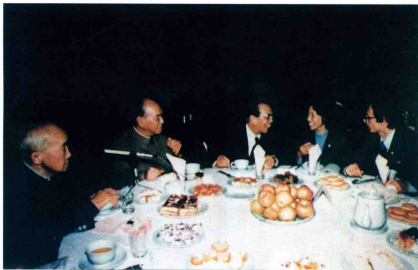
De maldekstre: Hujucz, Yao Yilin kaj Huang Hua en la kunveno por festi la 35-an datrevenon de EPC