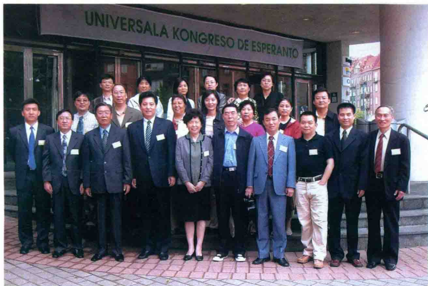
Ĉina E-Delegacio en la 88-a UK, 2003