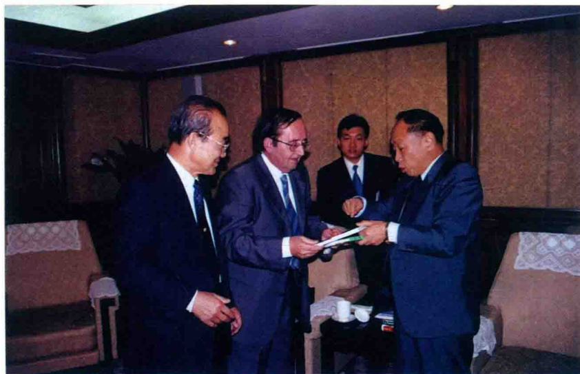
Li Zhaoxing, vicministro de eksteraj aferoj, akceptas gvidantojn de UEA, 2003.