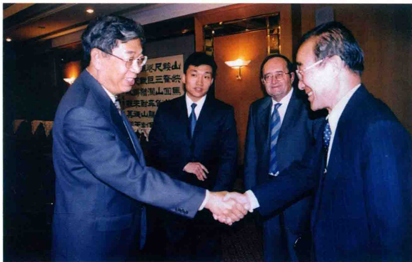
Xu Jialu, vicprezidanto de la Konstanta Komitato de la Ĉina Popola Kongreso, en akcepto de gvidantoj de UEA