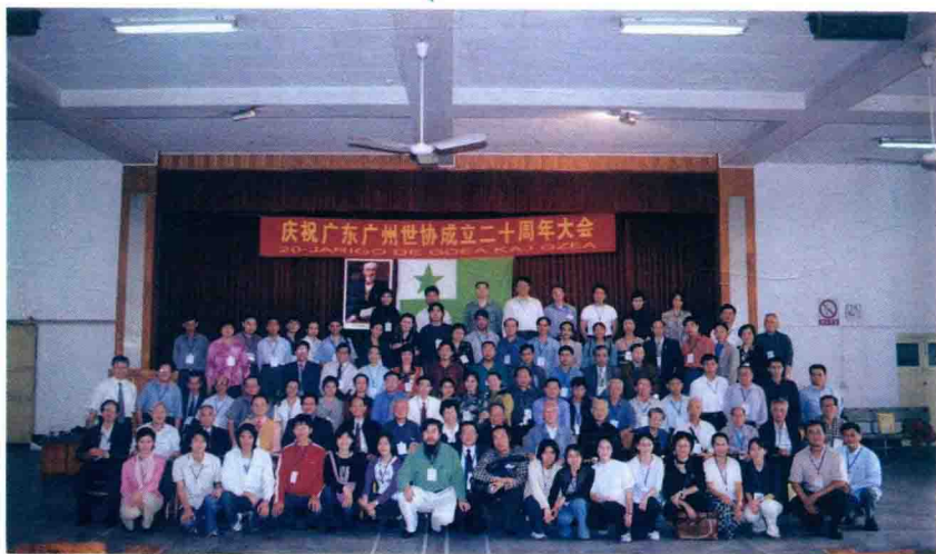
20-a jariĝo de Guangdong-a E-Asocio kaj Guangzhou-a E-Asocio