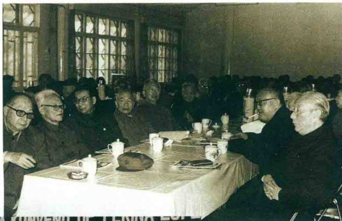
Fondkunveno de la societo "Amikoj de Esperanto" en Pekino, 1981