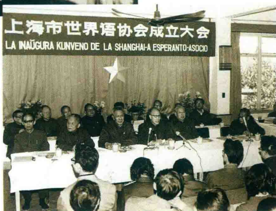
Kunveno de fondiĝo de la Ŝanhaja E-Asocio, 1982