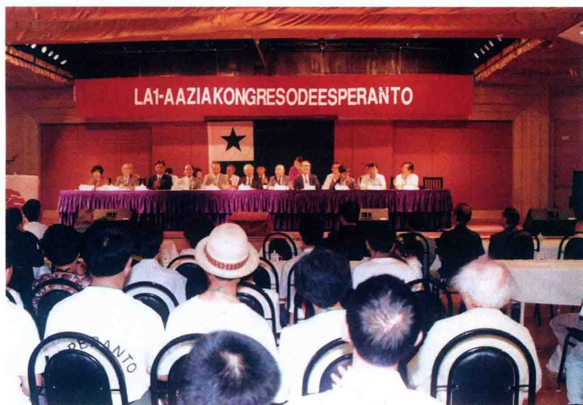
La Unua Azia Kongreso de Esperanto en Ŝanhajo