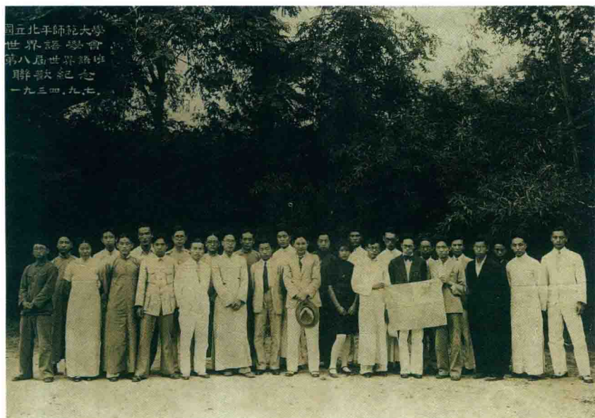
Lernantoj de la 8-a E-kurso de la E-Asocio de la Pejpinga Normala Universitato, 1934