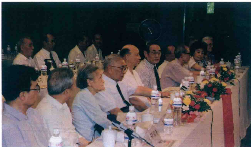
La 4-a Internacia Akademia Konferenco pri Scienco kaj Tekniko en Esperanto sub aŭspicioj de la Ĉina Akademio de Sciencoj, okazinta en Pekino