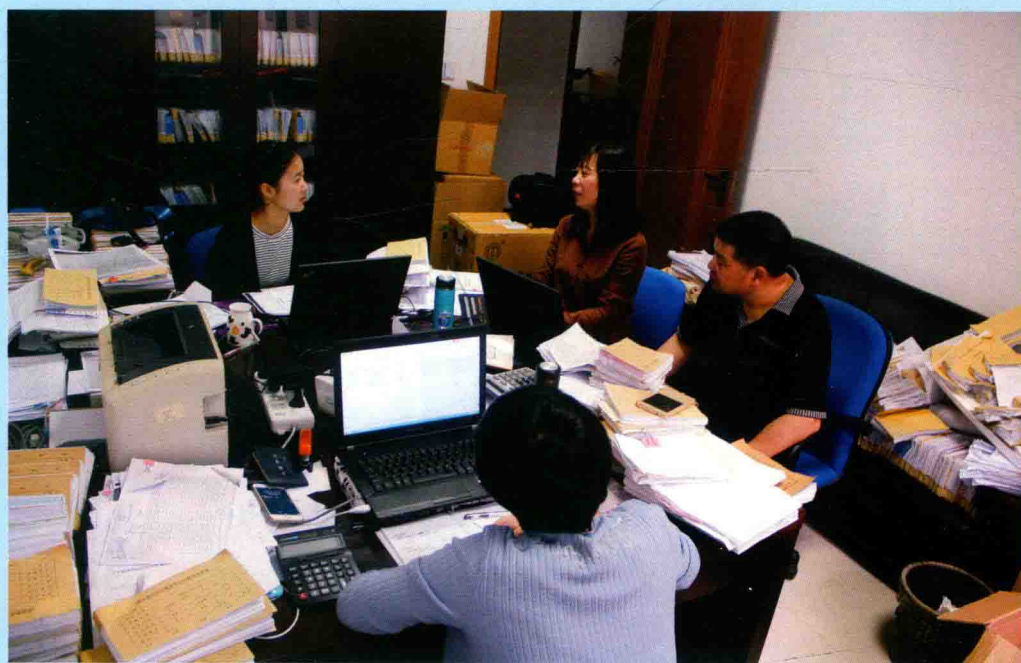
◆ 乐清市卫生局经济责任审计现场