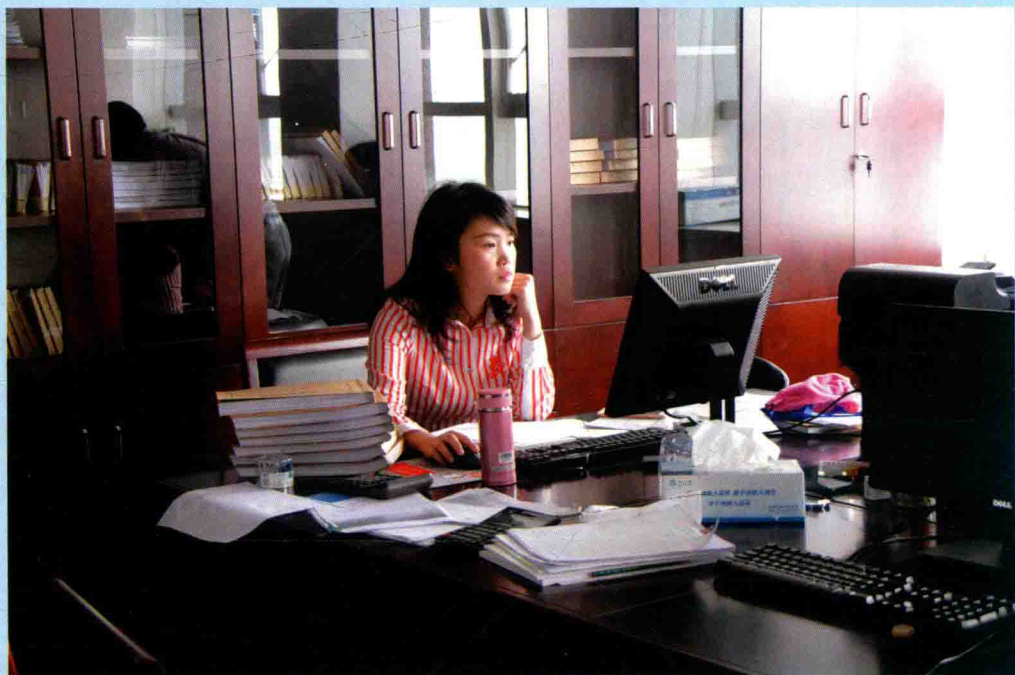
◆ 乐清市财政同级审现场