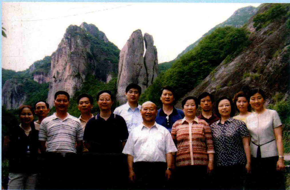
◆ 2004年7月13日，审计署党组成员、纪检组长王道成（右四）视察乐清，浙江省审计厅副厅长孙永珍（右三）、温州市审计局局长盖爱萍（右五）陪同