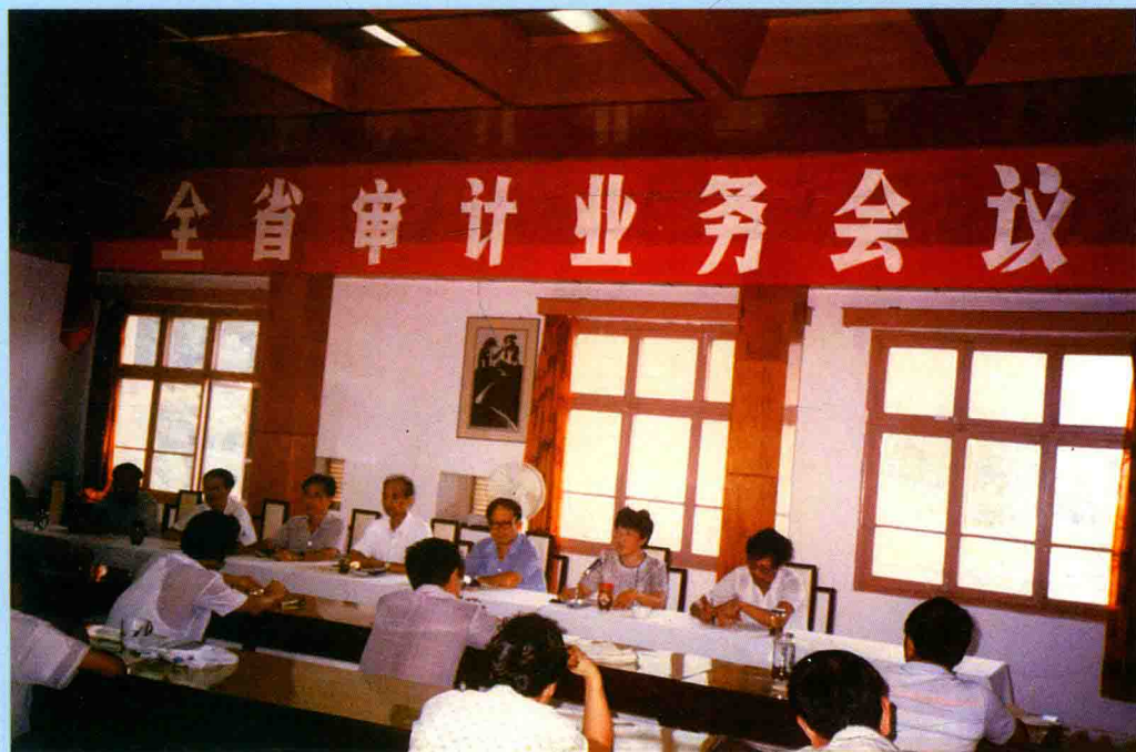
◆ 2004年，全省审计业务会议在乐清市召开，审计署党组成员、纪检组长王道成（正面右四），浙江省审计厅副厅长孙永珍（正面右二）出席