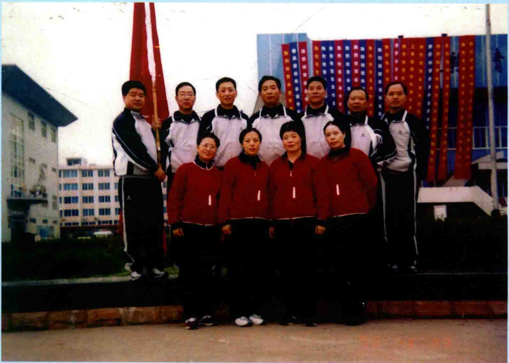
◆ 2000年，乐清市审计局组团参加乐清市总工会举办的首届机关干部运动会