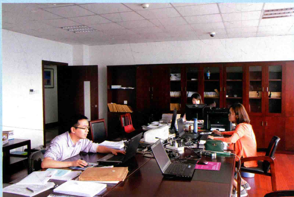
◆ 乐清市财政同级审现场