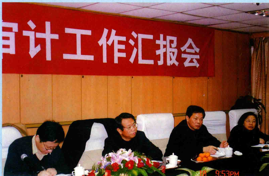
◆ 2006年2月17日，市领导向审计署副审计长刘家义（左二）汇报乐清市审计工作