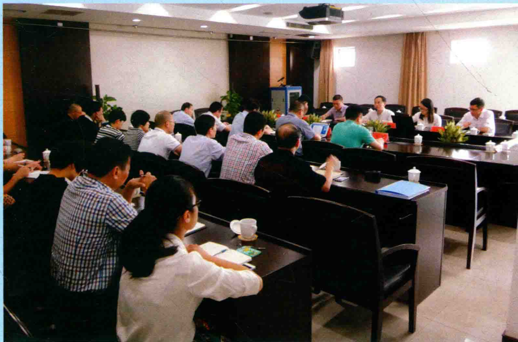
◆ 2015年10月9日，温州市审计局召开对乐清市审计局审计项目质量检查总结会议