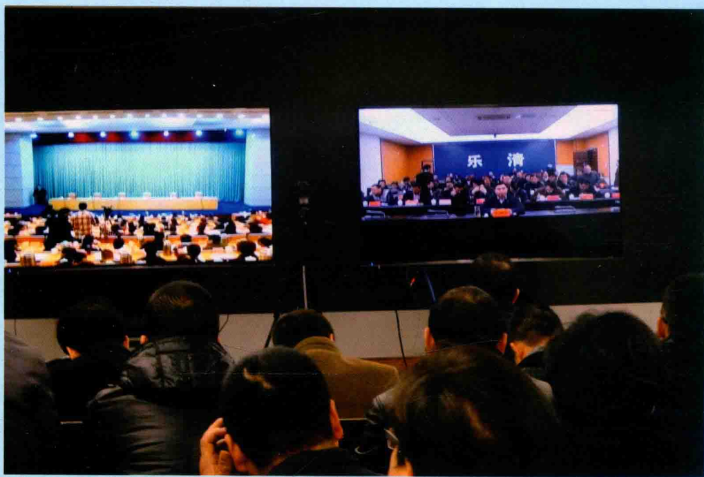
◆ 2015年12月28日，乐清市审计局干部参加审计署工作电视电话会议