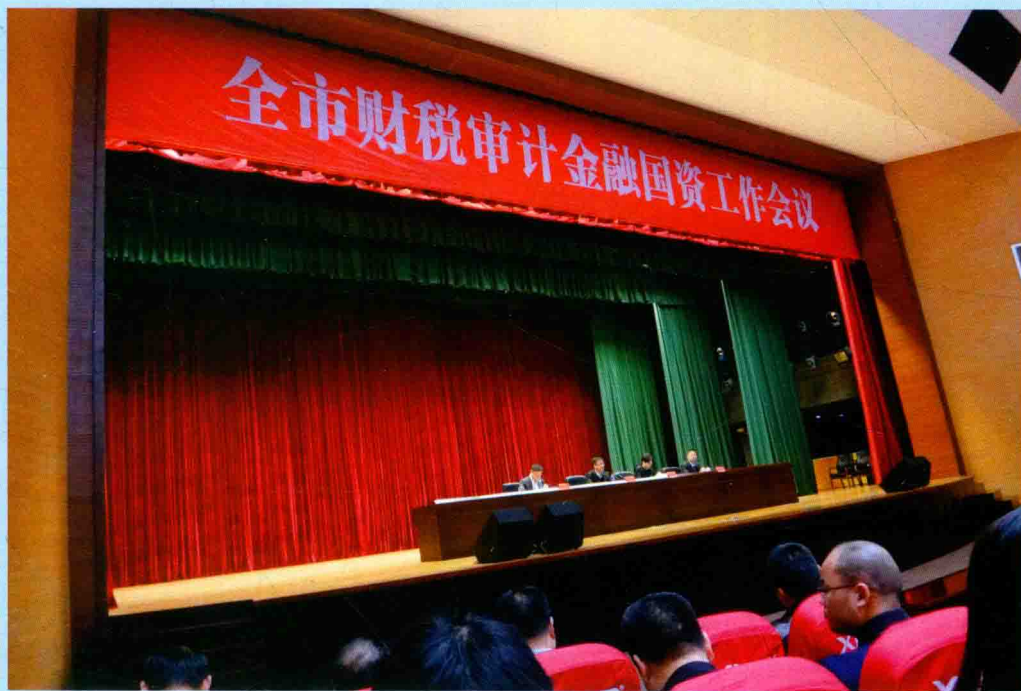
◆ 乐清市审计局干部参加全市财税审计金融国资工作会议