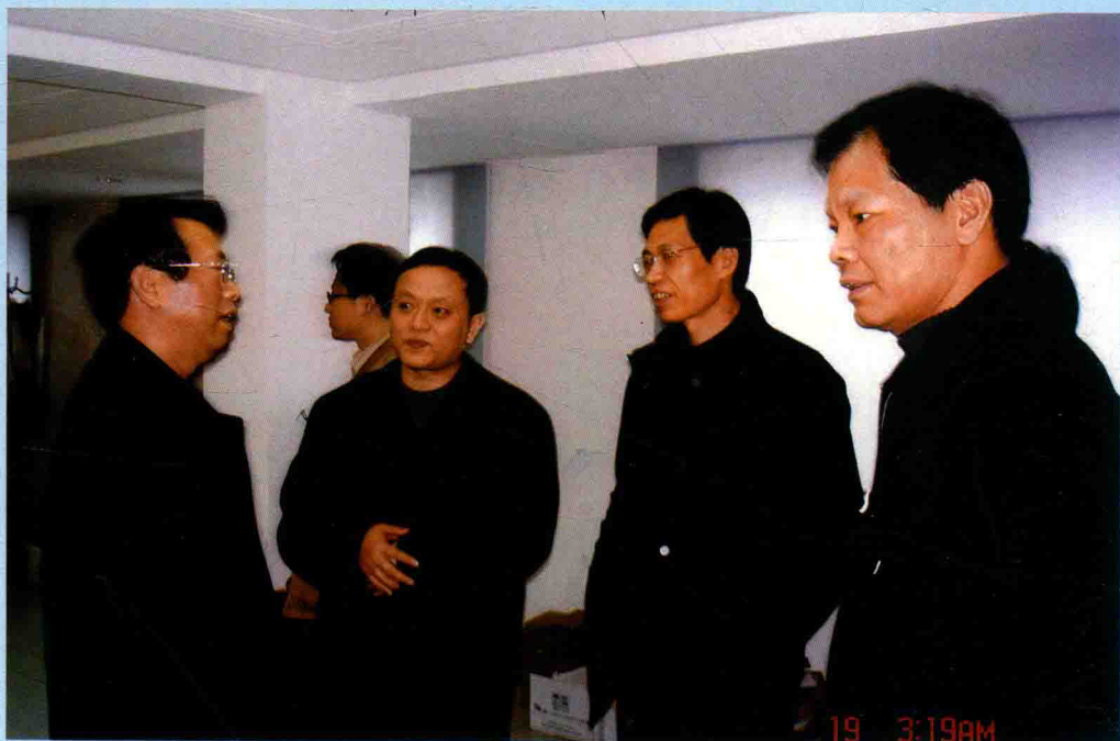
◆ 2006年2月18日，审计署副审计长刘家义（左一）视察乐清市村级财务计算机网络监管中心，市长潘孝政（右二）陪同