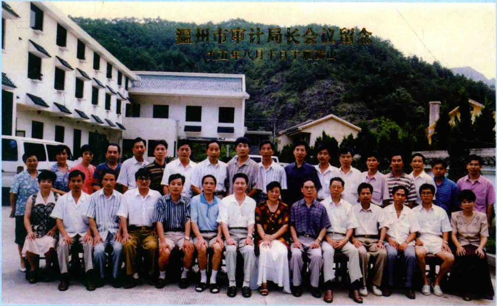
◆ 1995年8月10日，温州市县（市、区）审计局长会议在乐清市召开