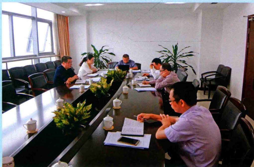
◆ 2015年10月29日，乐清市审计局领导班子召开党的理论教育，市委宣传部派人参加