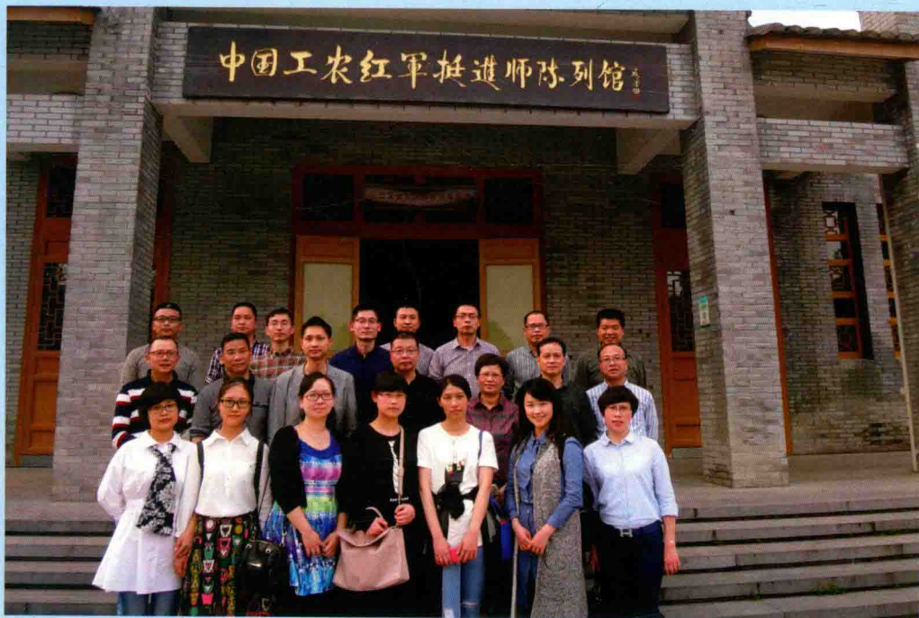
◆ 2015年4月4日，乐清审计局机关支部“七·一”参观红军挺进师陈列馆