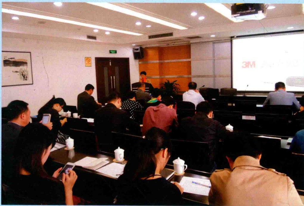
◆ 2014年11月21日，乐清市审计局召开评定“四好课室”述职述廉会议