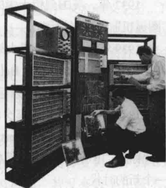
图 1.2 TRADIC

1960年, 出现了一些成功应用商业领域、大学和政府部门的第二代计算机。第二代计算机除了用晶体管代替电子管, 还出现了现代计算机的一些部件, 如打印机、磁带、磁盘、内存、操作系统等。计算机中存储的程序使得计算机有很好的适应性, 可以更有效地用于商业用途。在这一时期出现了更高级的 COBOL (Common Business-Oriented Language) 和 FORTRAN (Formula Translator Formula Translator) 等语言, 以单词、语句和数学公式代替了晦涩的二进制机器码, 使计算机编程变得更加容易。第二代计算机的发展催生了一批新的职业 (如程序员、分析员和计算机系统专家), 整个软件产业也由此诞生。