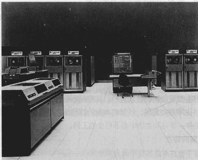
图 1.3 第三代计算机的标志性产品 IBM S/360

的通用性适用于各方面的用户，它具有“360度”全方位的特点，并由此得名。IBM 为此投入了 50 亿美元的研发费用，远远超过研制原子弹花费的 20 亿美元。IBMS/360 成为第三代计算机的标志性产品。