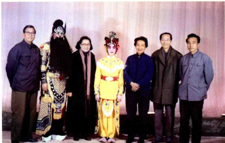
红线女、关肃霜观摩《三打陶三春》合影 (从左至右)王佩林、罗长德、红线女、王玉珍、关肃霜、迟金声、陆松龄