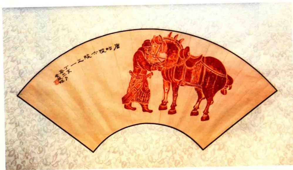
迟金声颖拓唐昭陵六骏之一